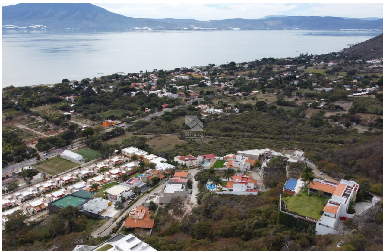
VISTA AÉREA DESDE TERRENO