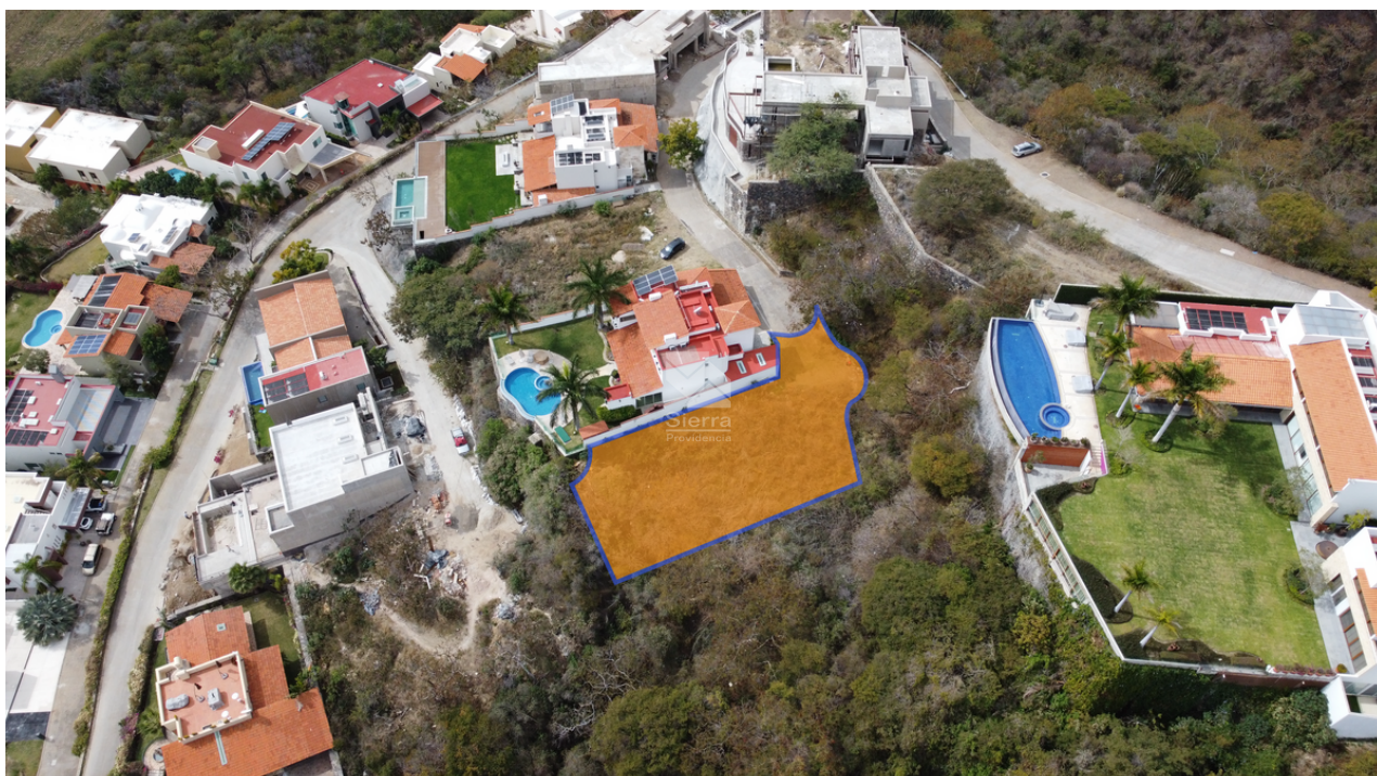
VISTA AÉREA DEL TERRENO