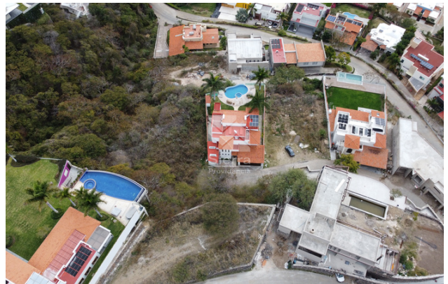
VISTA AL TERRENO