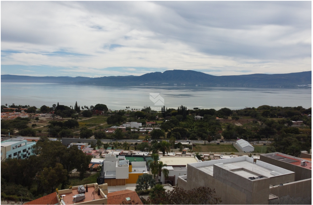
VISTA DESDE TERRENO