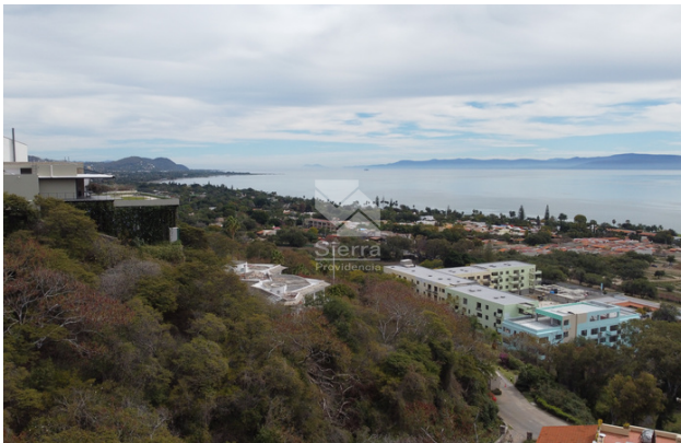
VISTA DESDE TERRENO