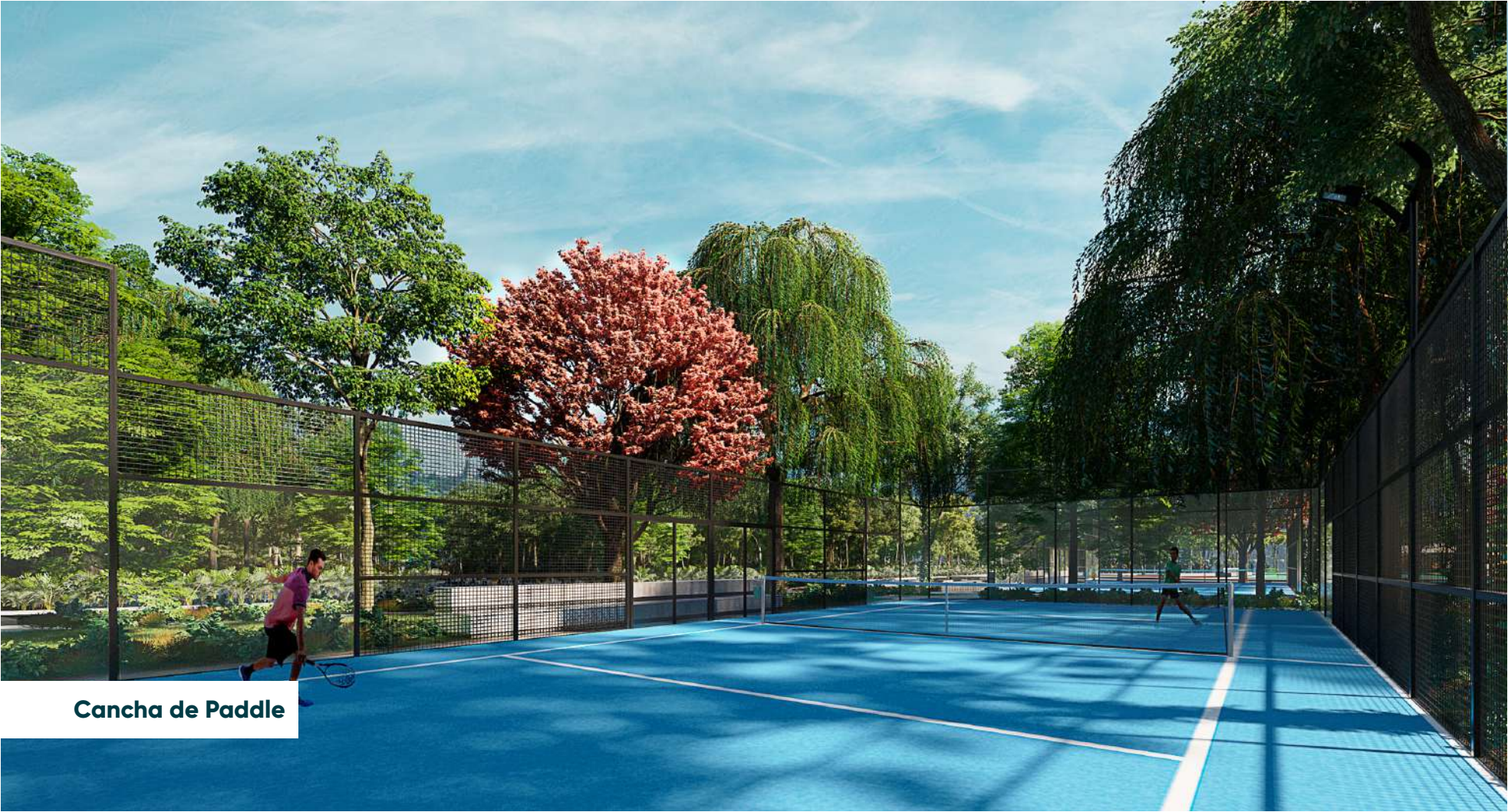
Cancha de Paddle