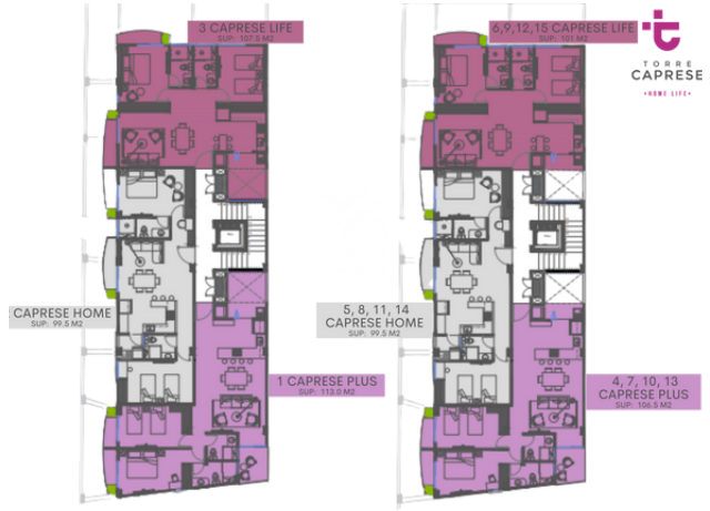
PLANTA 2DO NIVEL.