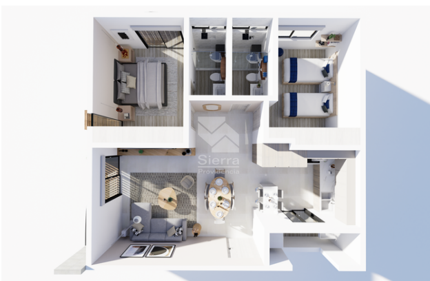
PLANO DE DEPARTAMENTO