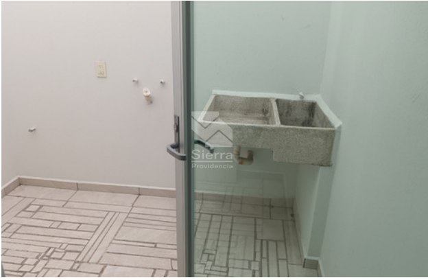
CUARTO DE LAVADO