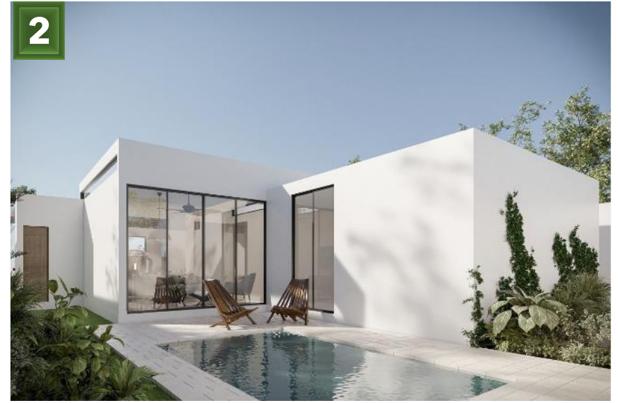
2. Posterior - Piscina