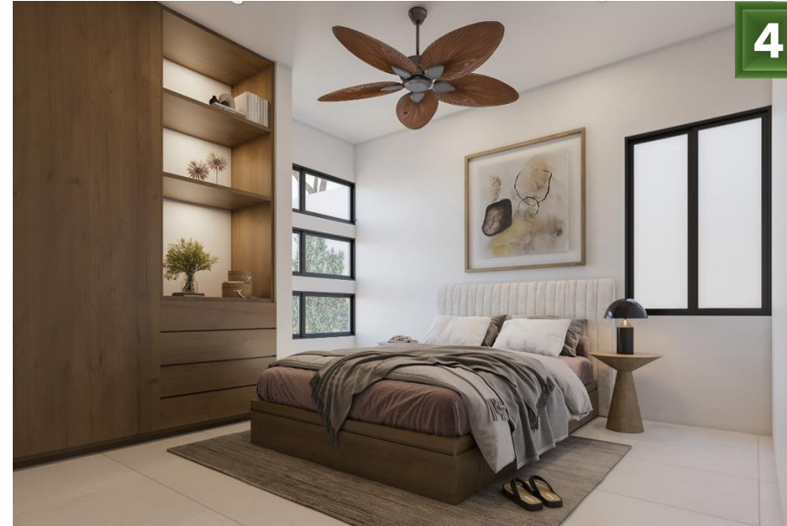
4. Recamara 1 o estudio