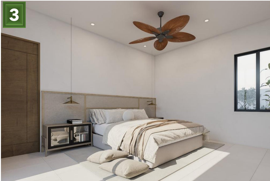
3. Recamara Principal