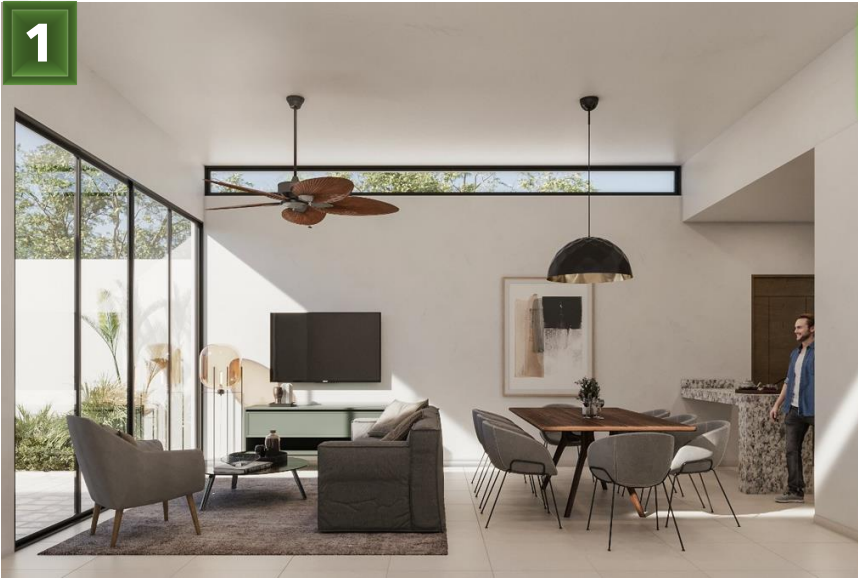
1. Sala Comedor - (Altura y media)