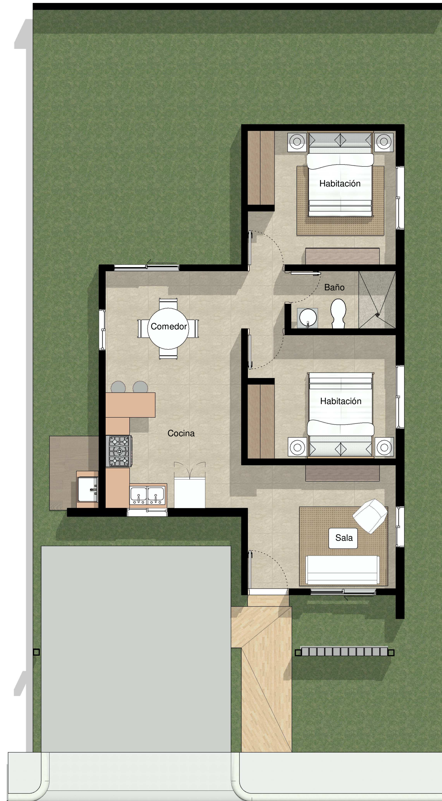
1 PLANTA ARG. NIVEL 1 1 : 50