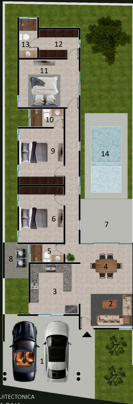
PLANTA ARQUITECTONICA PLANTA BAJA