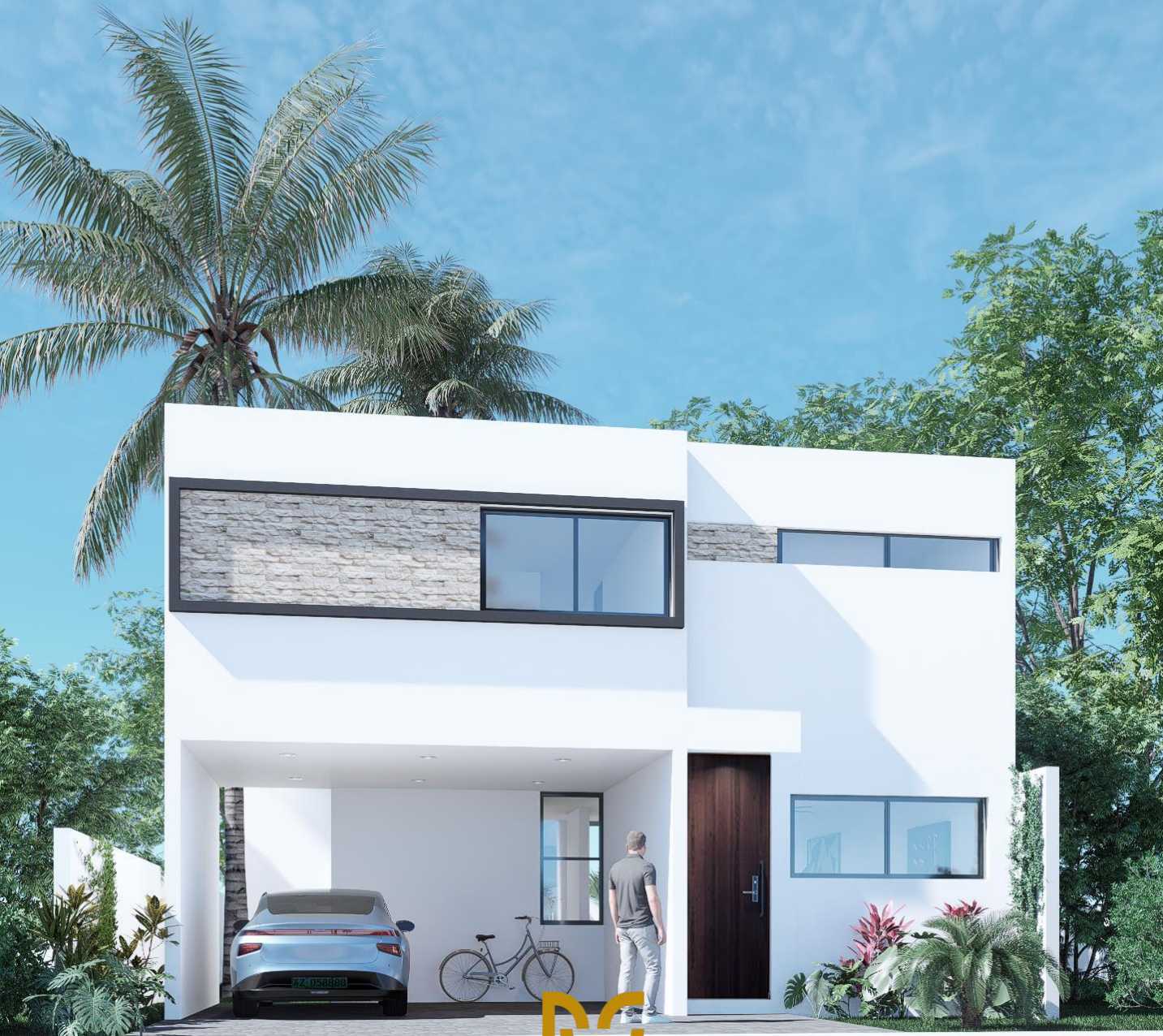
FACHADA A Imagen ilustrativa