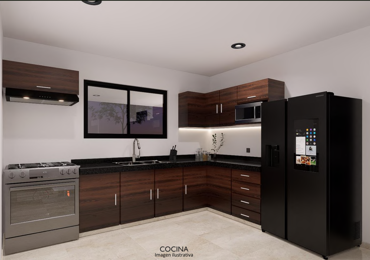
COCINA Imagen ilustrativa

Cocina tipo integral con meseta de granito, gavetas inferiores y aéreas, tarja doble.*