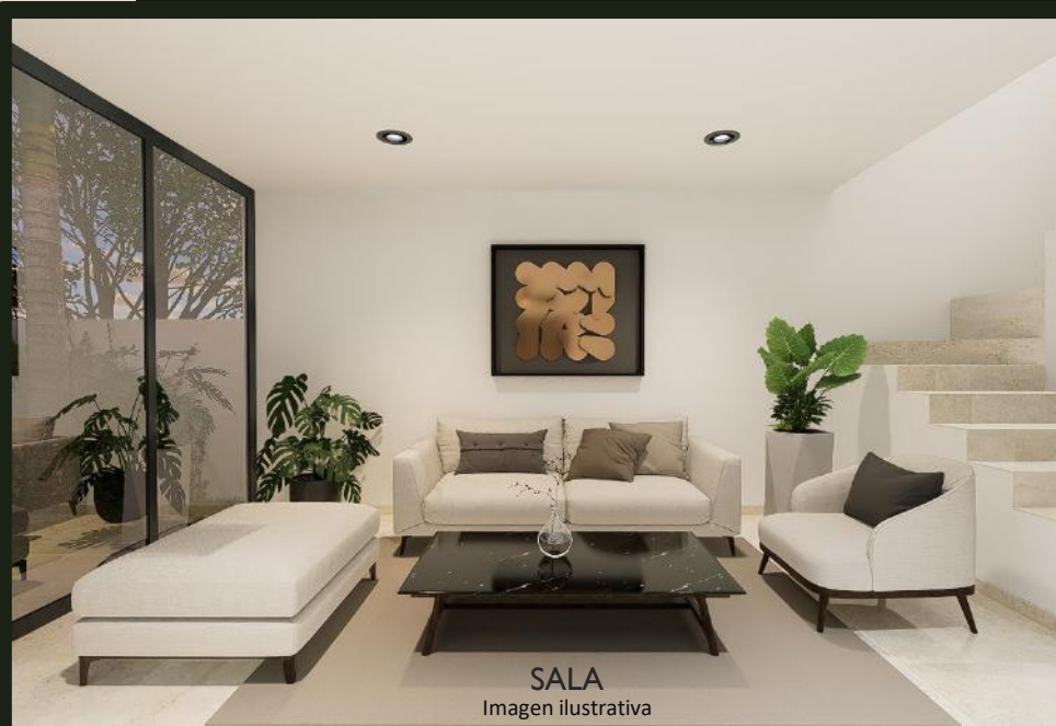
SALA Imagen ilustrativa