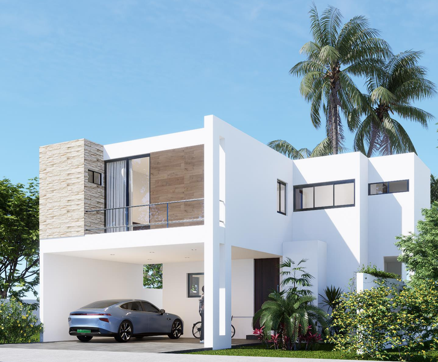
FACHADA B Imagen ilustrativa