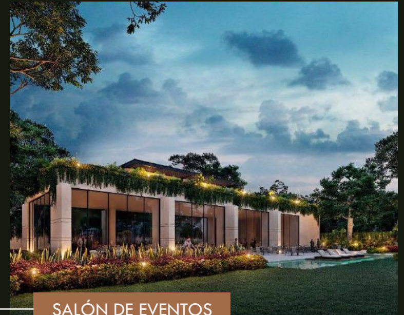
SALÓN DE EVENTOS