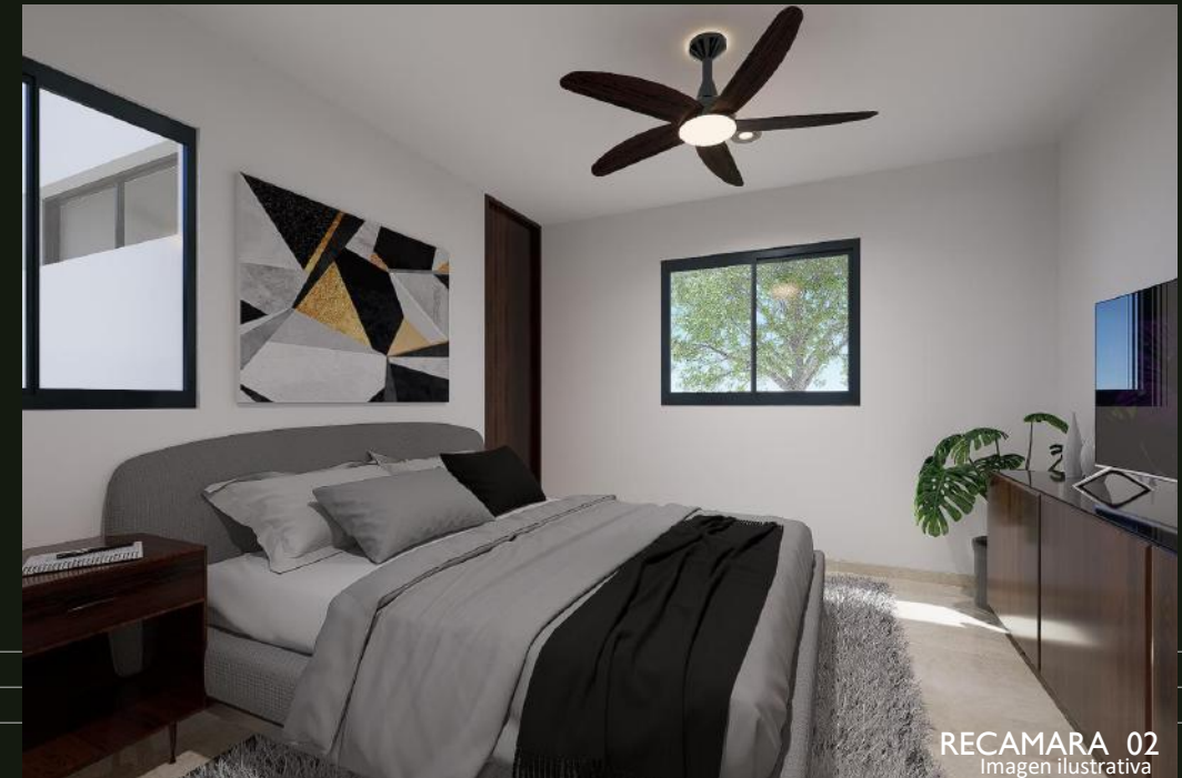
RECAMARA 02 Imagen ilustrativa