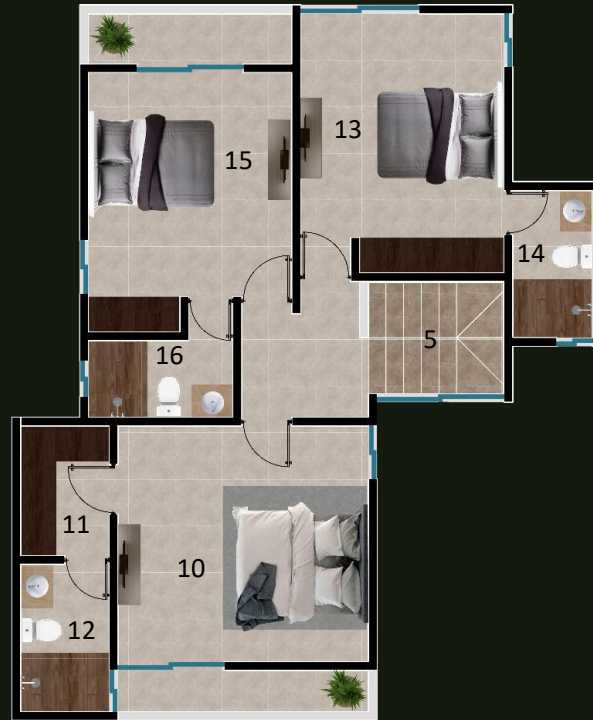
PLANTA ARQUITECTONICA PLANTA ALTA