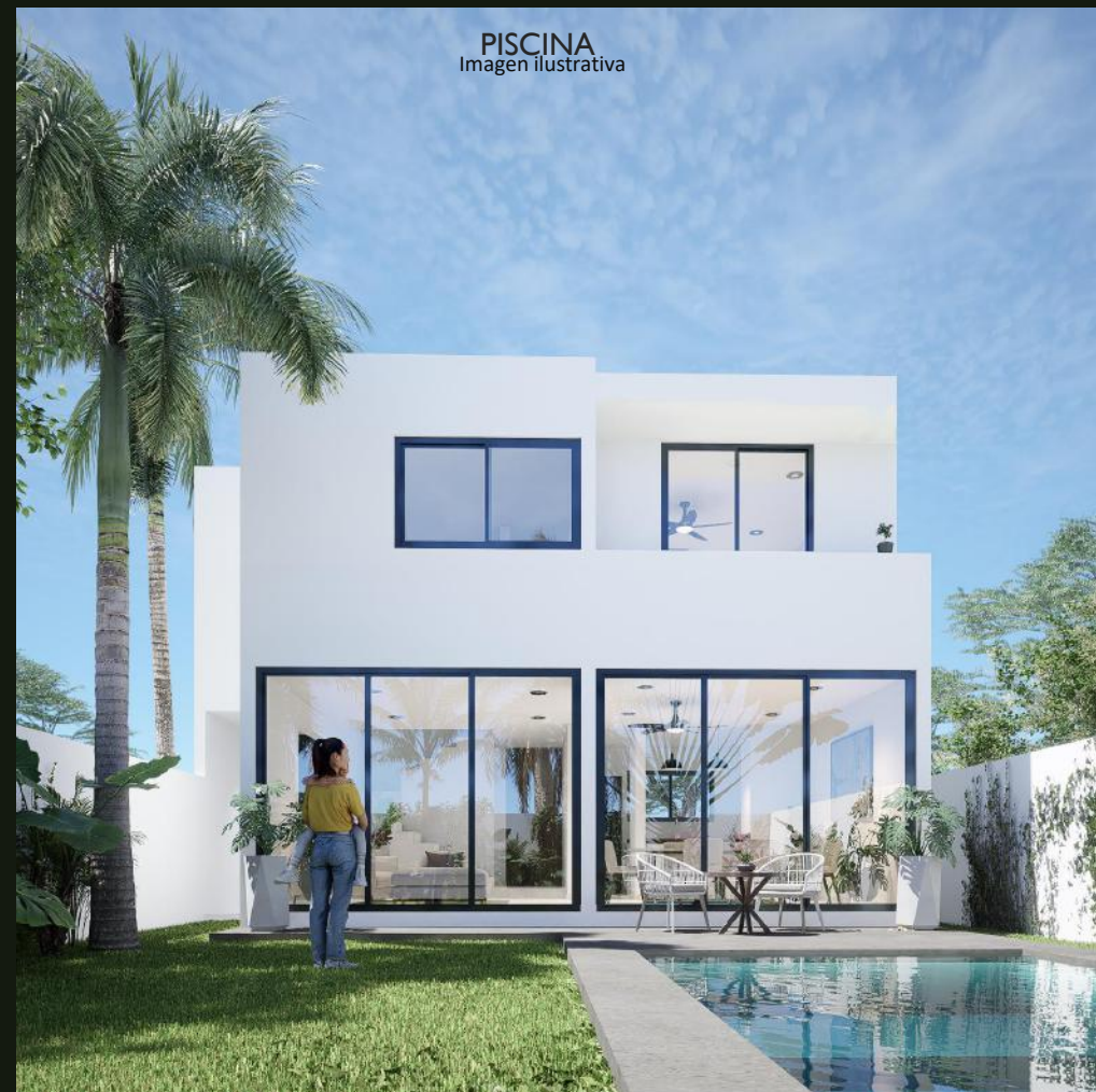
PISCINA Imagen ilustrativa