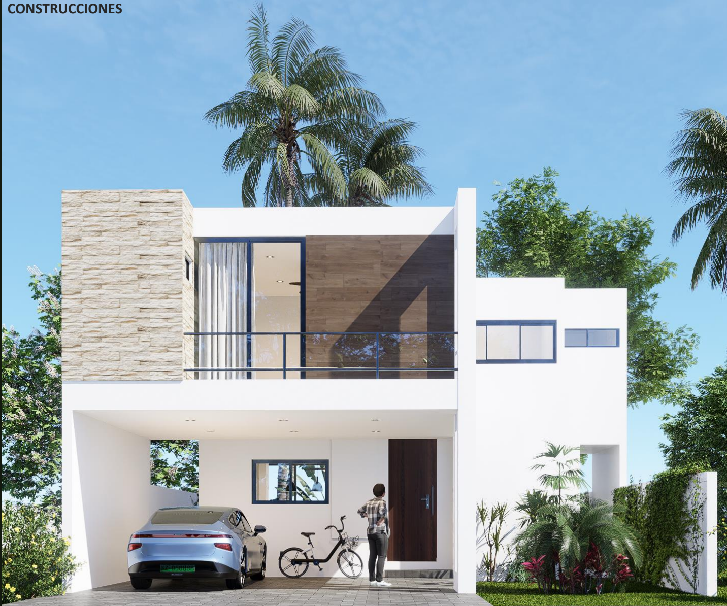
FACHADA B Imagen ilustrativa