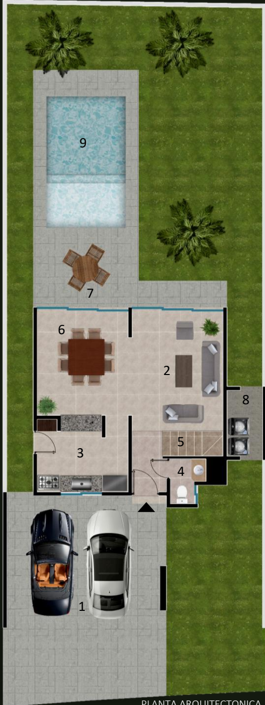
PLANTA ARQUITECTONICA PLANTA BAJA