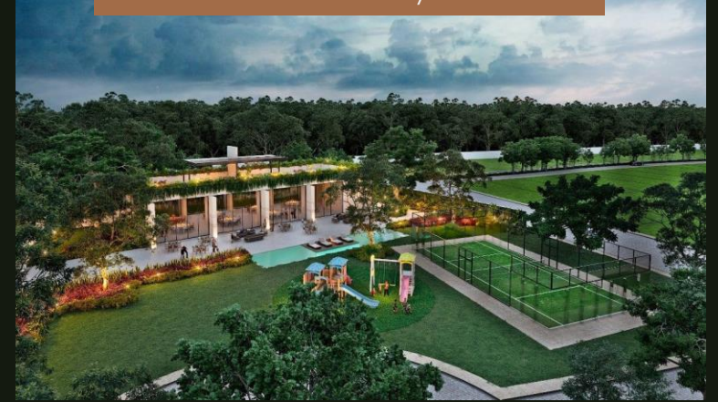
CANCHA DE PADEL / PISCINA

Privada residencial al Norte de Mérida en excelente zona con alta plusvalía debido a la cercanía con puntos importantes, como hospitales, plazas, comercios, escuelas, universidades y a las carreteras que conectan con las playas de Yucatán y zonas turísticas.