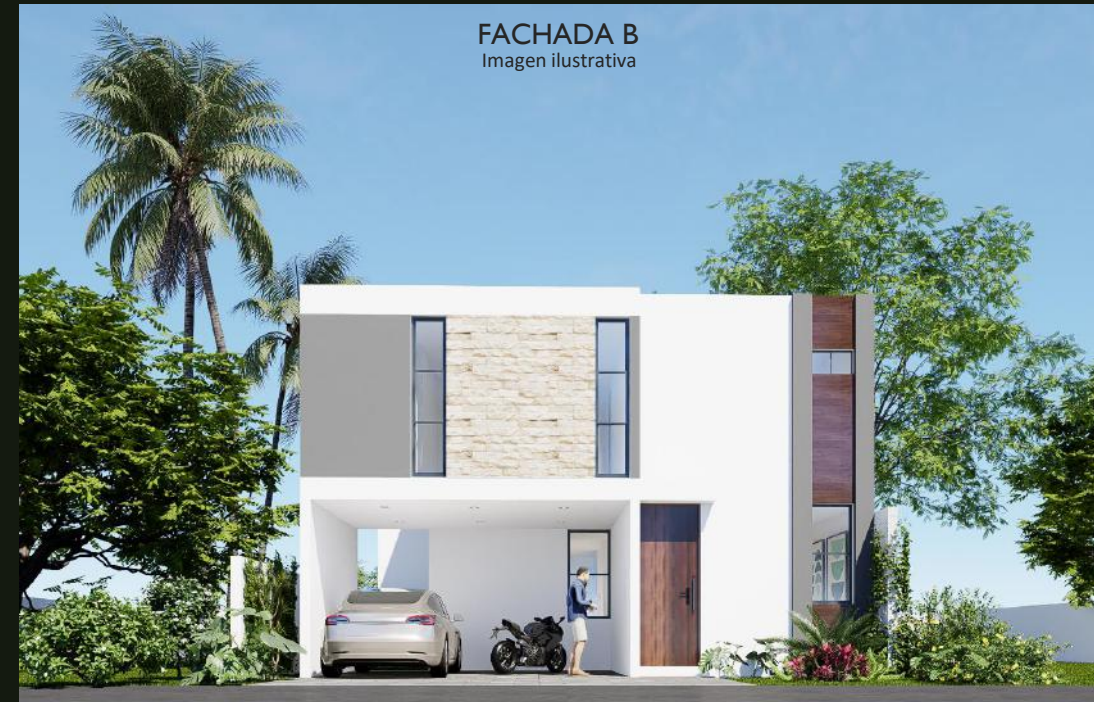
FACHADA B Imagen ilustrativa