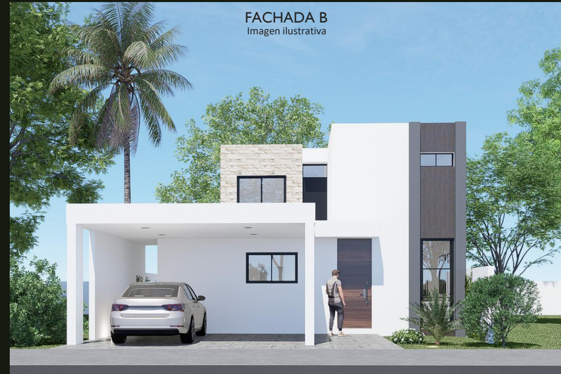
FACHADA B Imagen ilustrativa