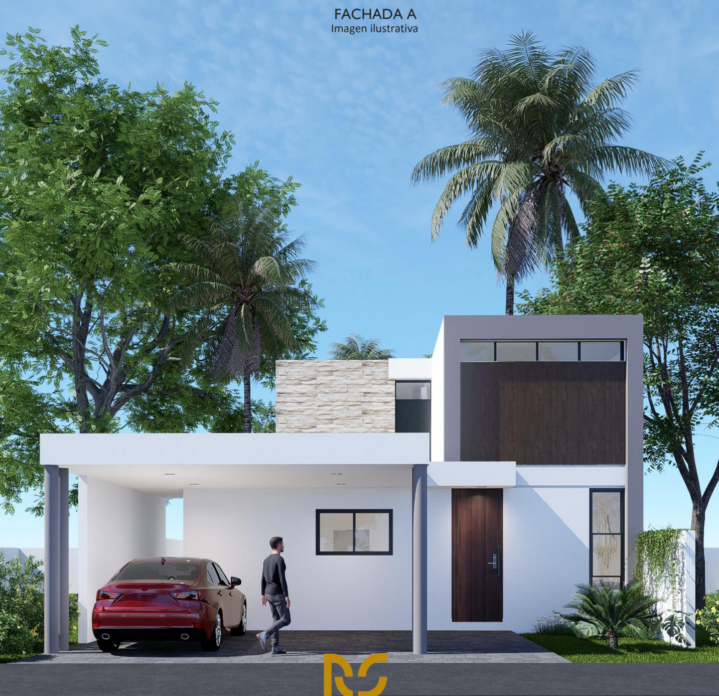
FACHADA A Imagen ilustrativa