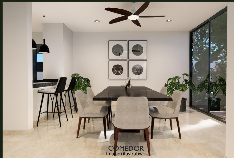
COMEDOR Imagen ilustrativa