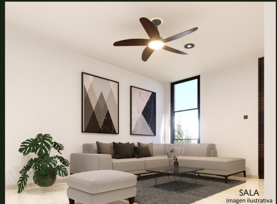
SALA Imagen ilustrativa