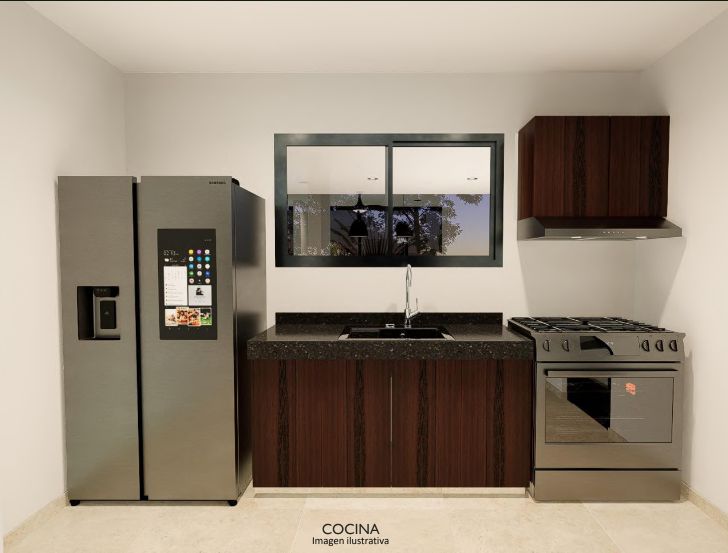
COCINA Imagen ilustrativa

Cocina tipo integral con meseta de granito, gavetas inferiores y aéreas, tarja doble.*