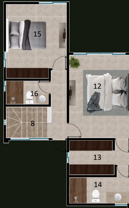
PLANTA ARQUITECTONICA PLANTA ALTA