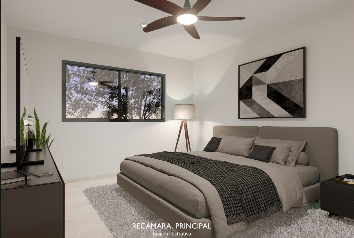
RECAMARA PRINCIPAL Imagen ilustrativa