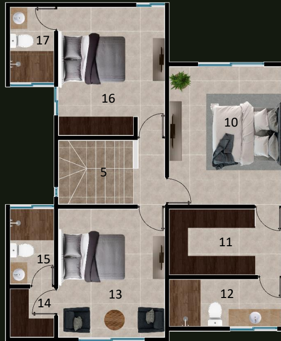
PLANTA ARQUITECTONICA PLANTA ALTA