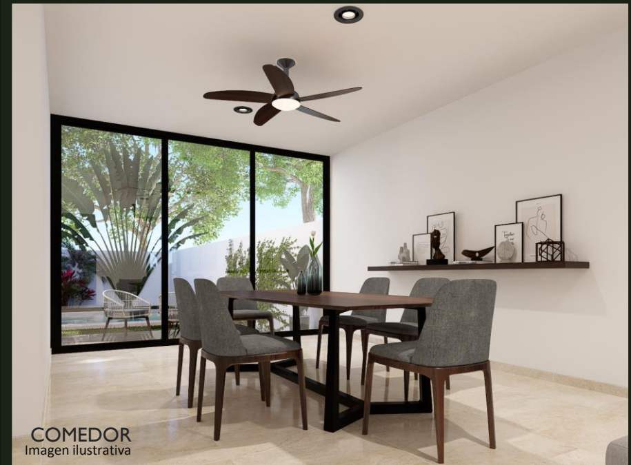
COMEDOR Imagen ilustrativa