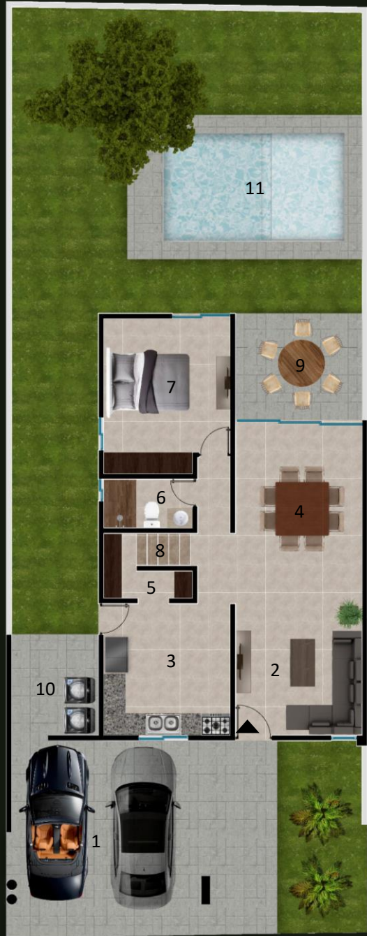
PLANTA ARQUITECTONICA PLANTA BAJA