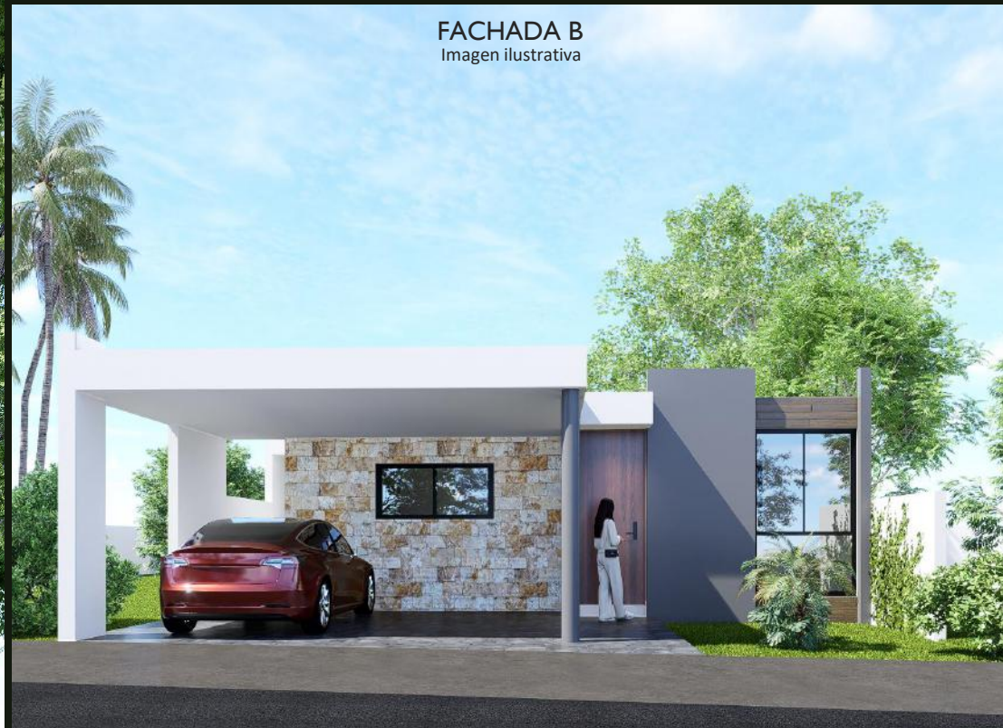
FACHADA B Imagen ilustrativa