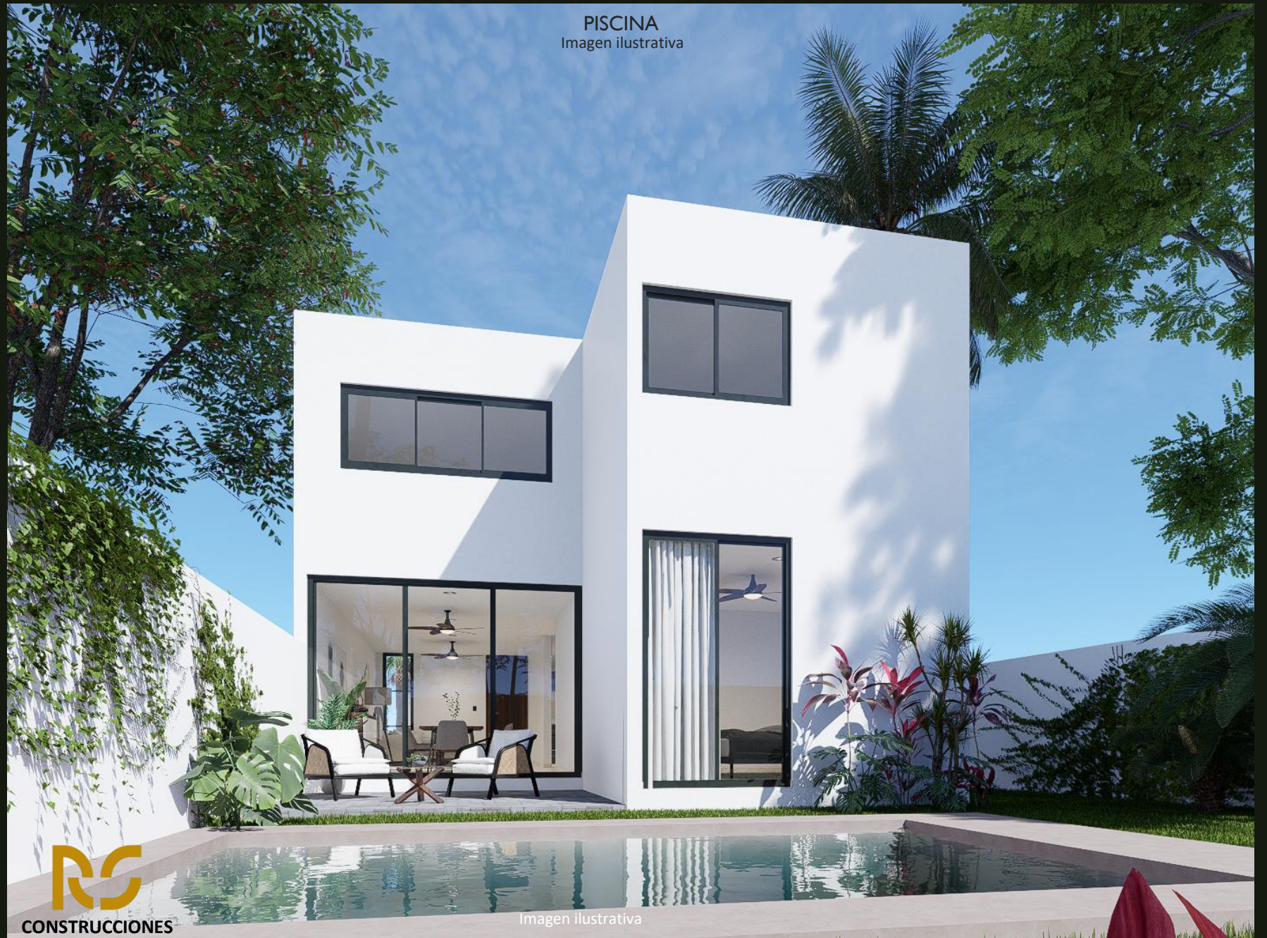
PISCINA Imagen ilustrativa