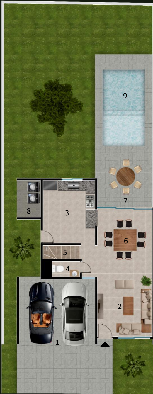
PLANTA ARQUITECTONICA PLANTA BAJA