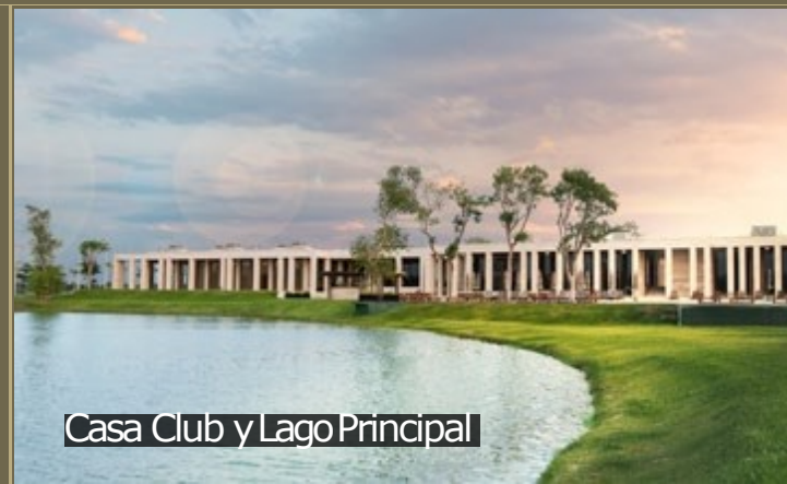
Casa Club y Lago Principal