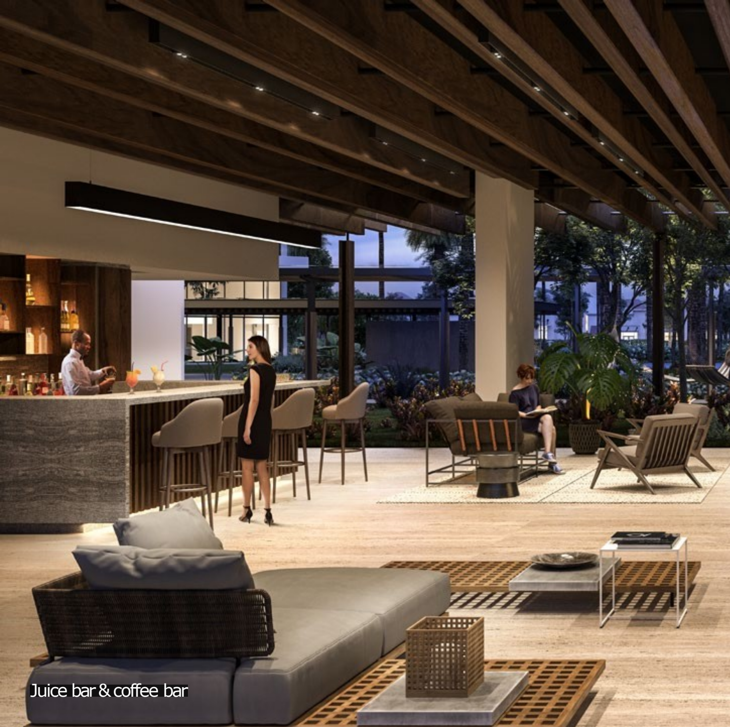
Juice bar & coffee bar