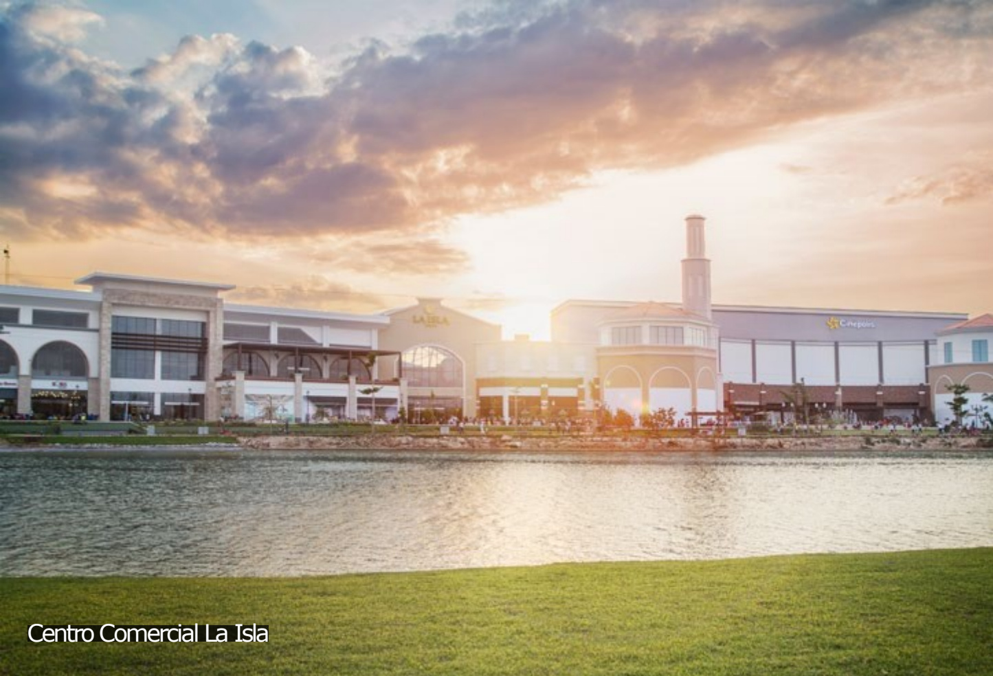
Centro Comercial La Isla