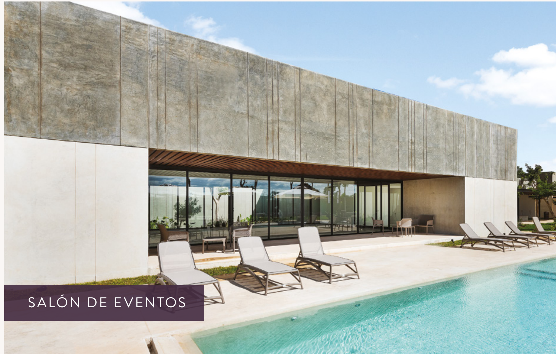
SALÓN DE EVENTOS