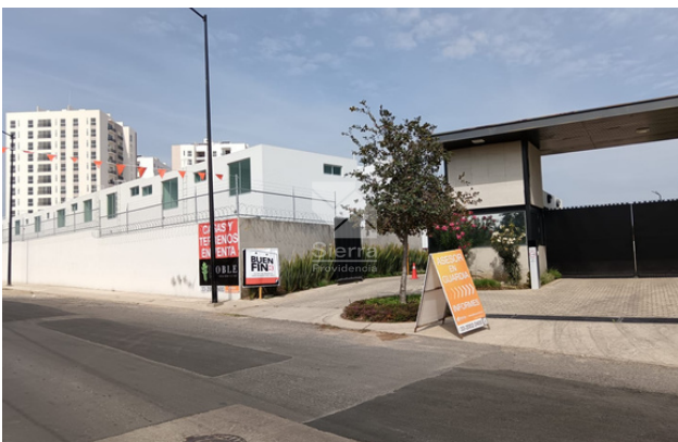
INGRESO AL COTO