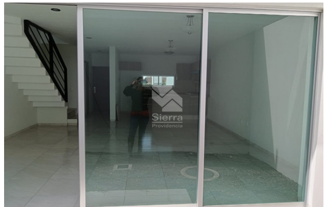
VISTA DESDE JARDÍN