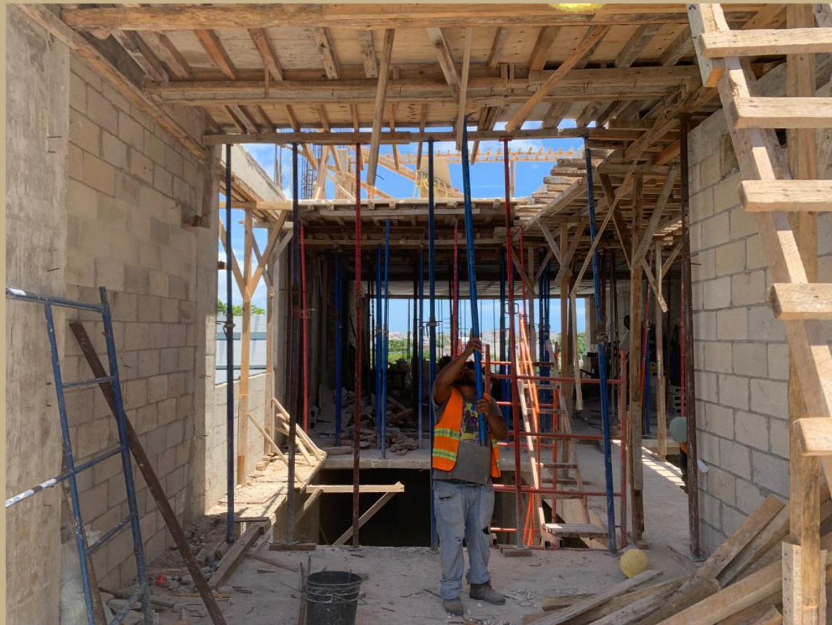
descimbrado parte del ultimo nivel