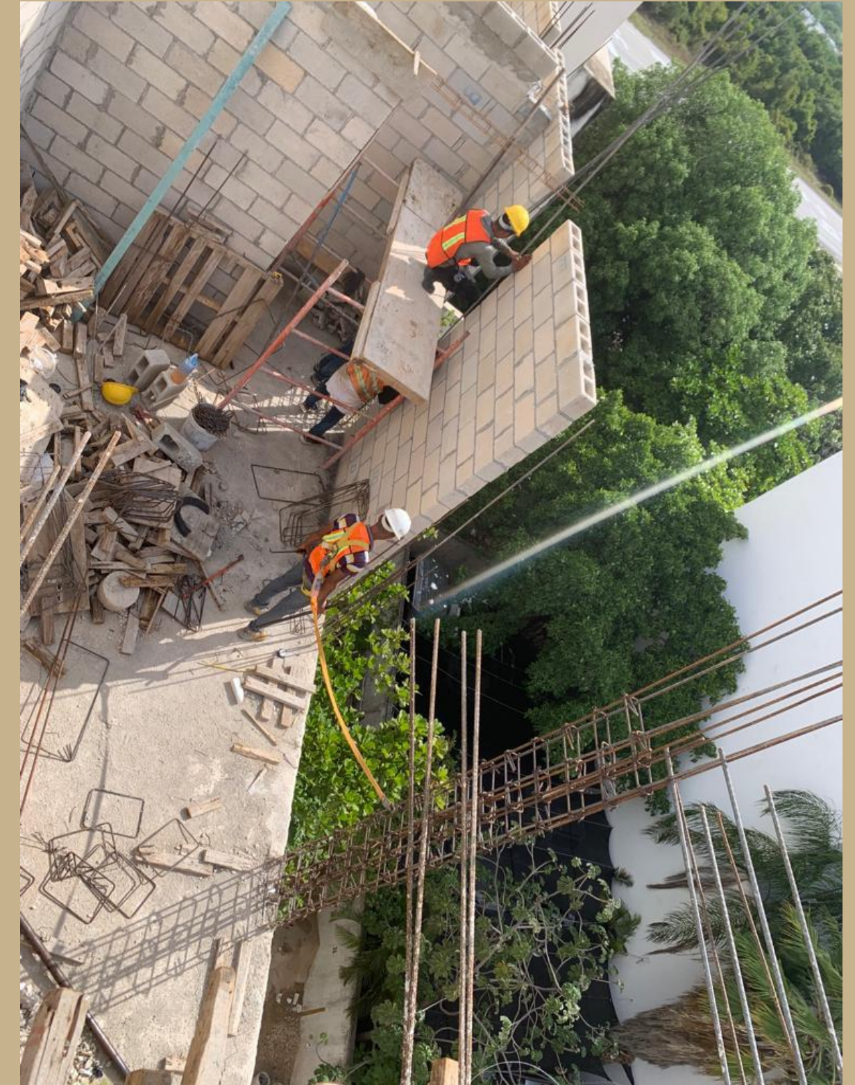
fabricacion de muros ultimo nivel