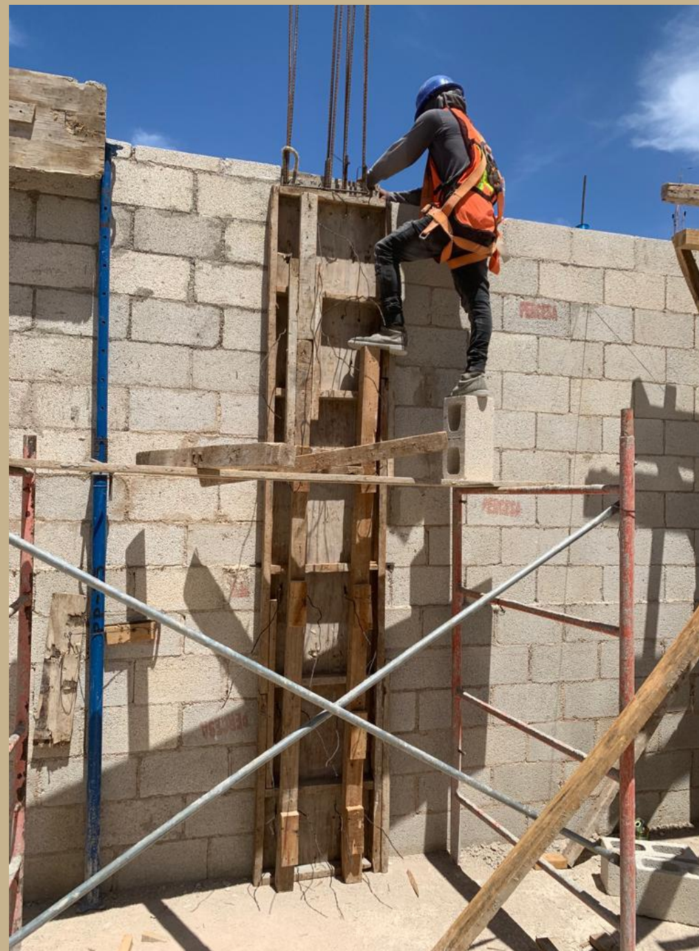
colado de ultimas columnas