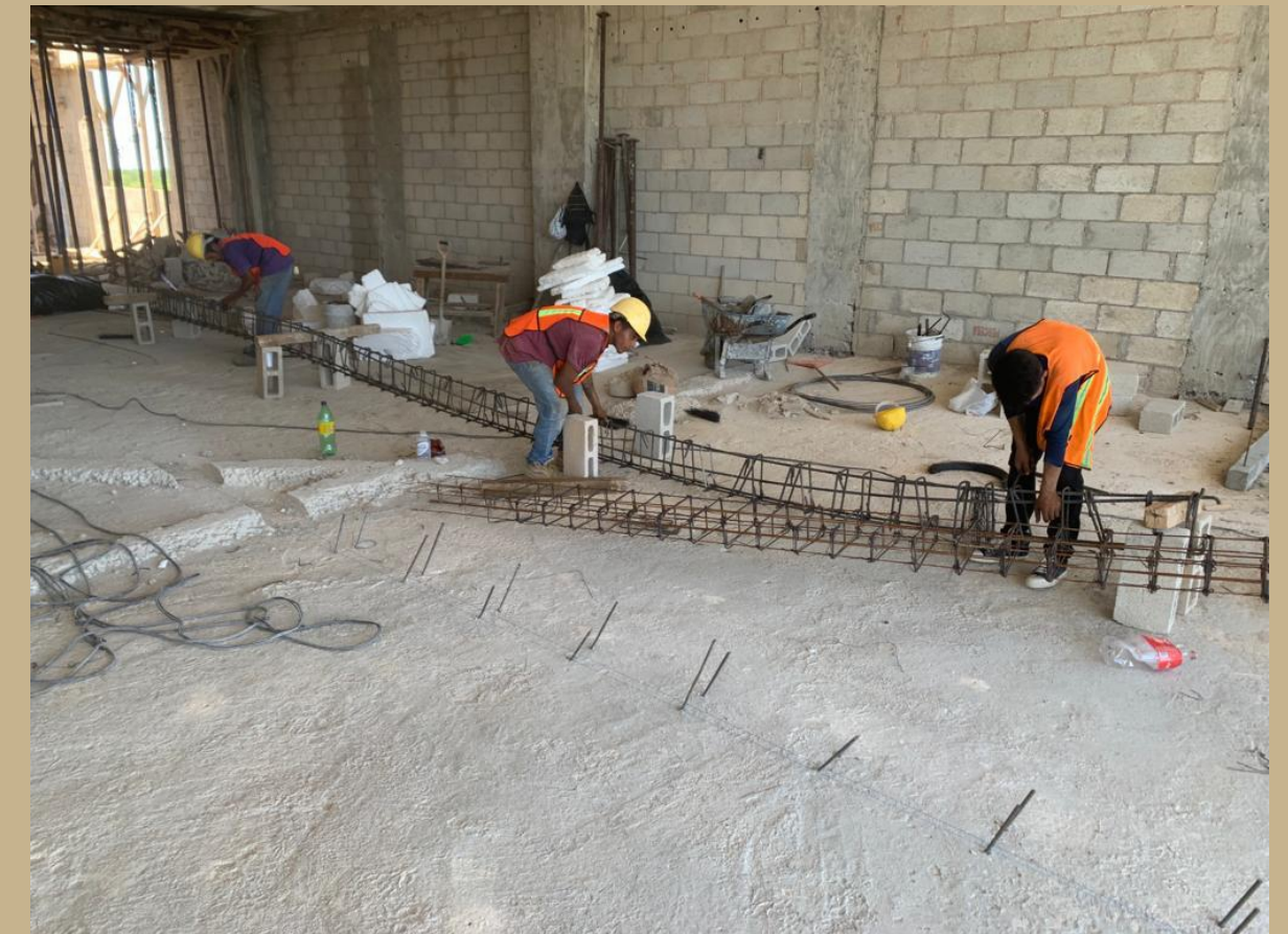
armado de trabes para albercas