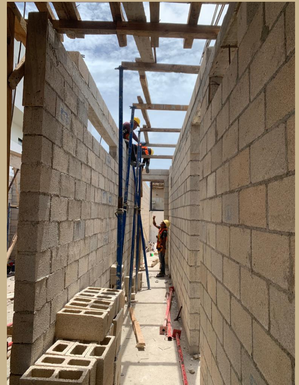
cimbrado para ultimos pasillos