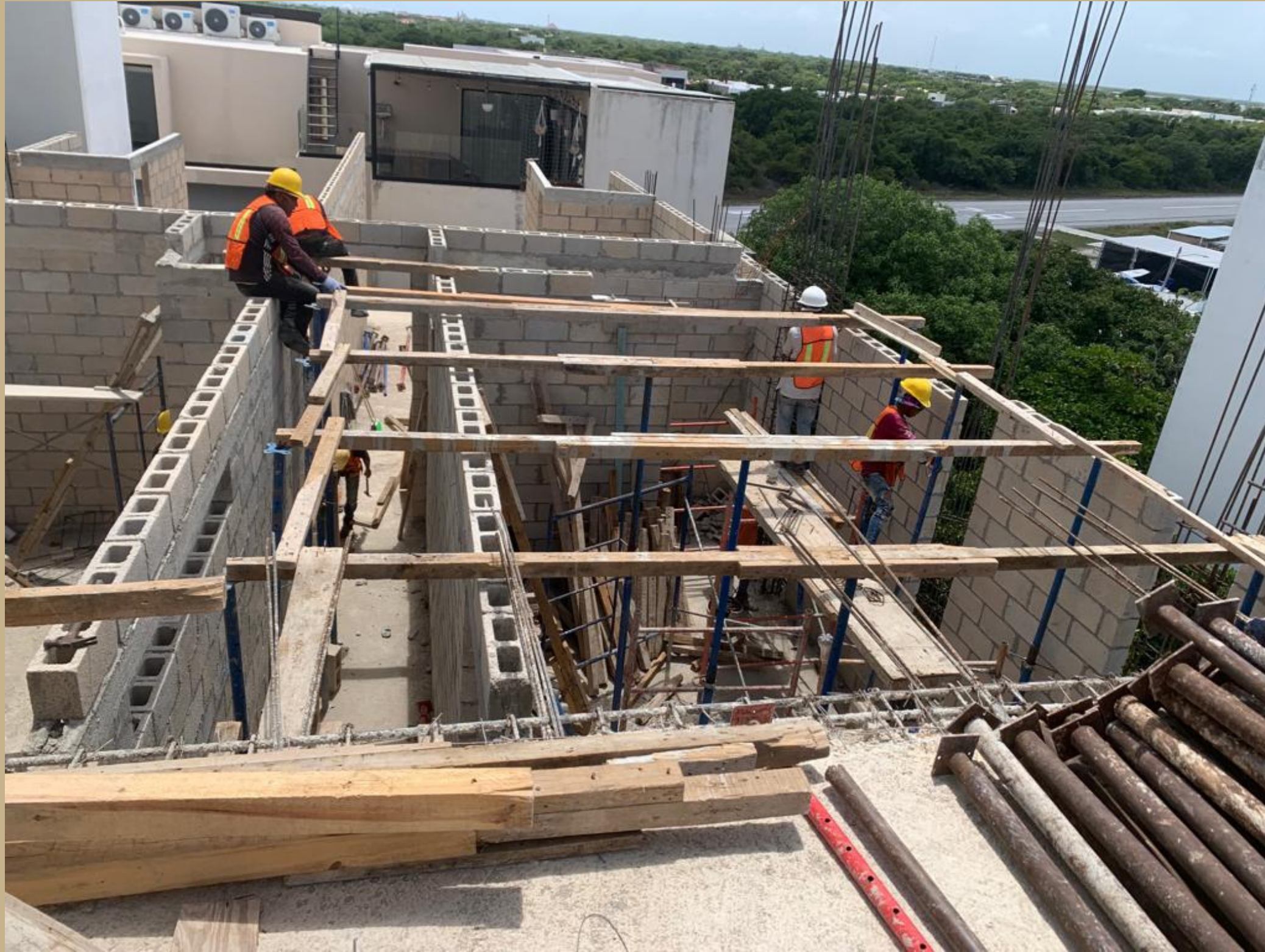
colocacion de cimbra ultimo nivel