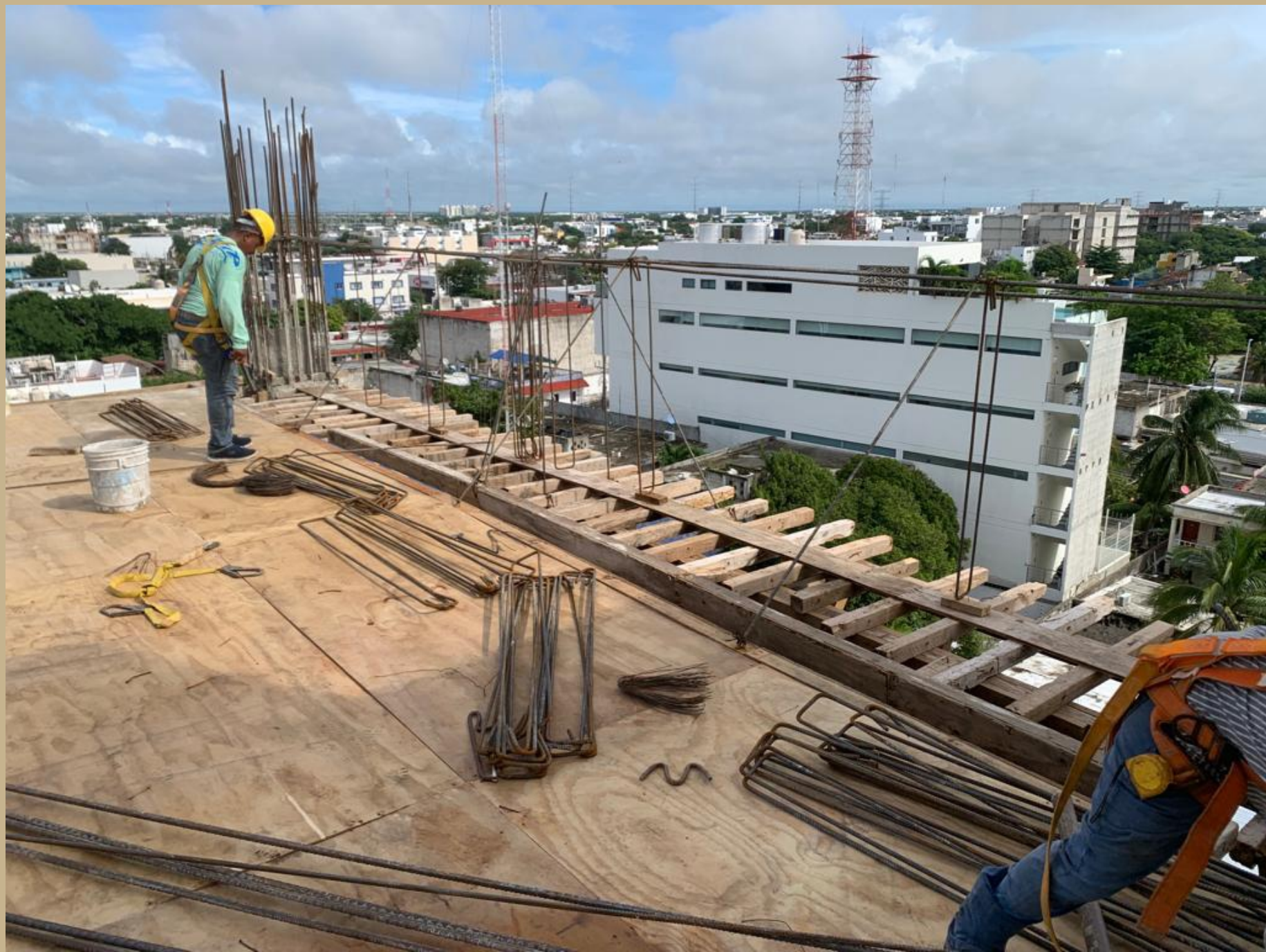
preparado de losa tapa nivel 6