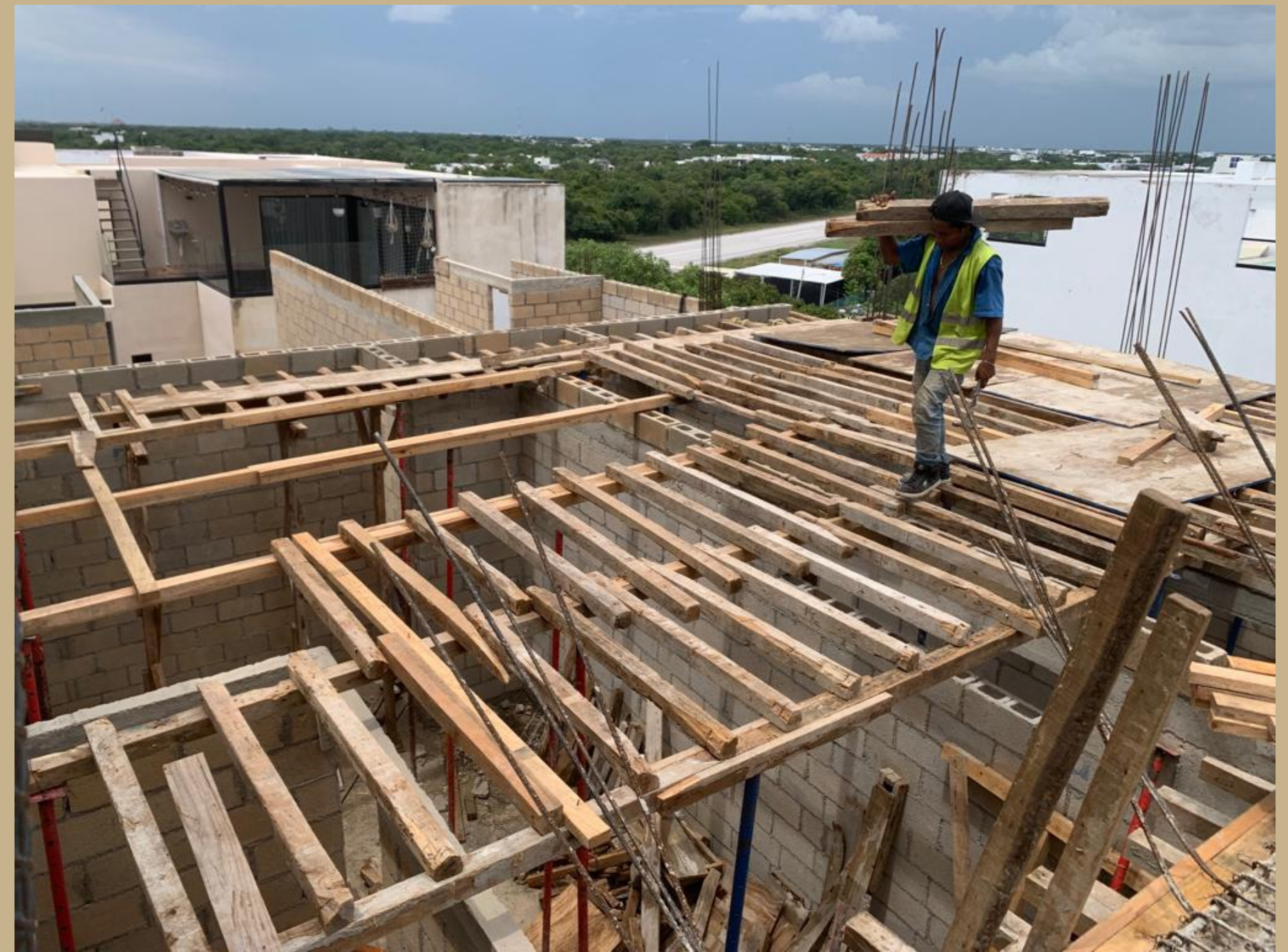
preparado de losa tapa en nivel 5