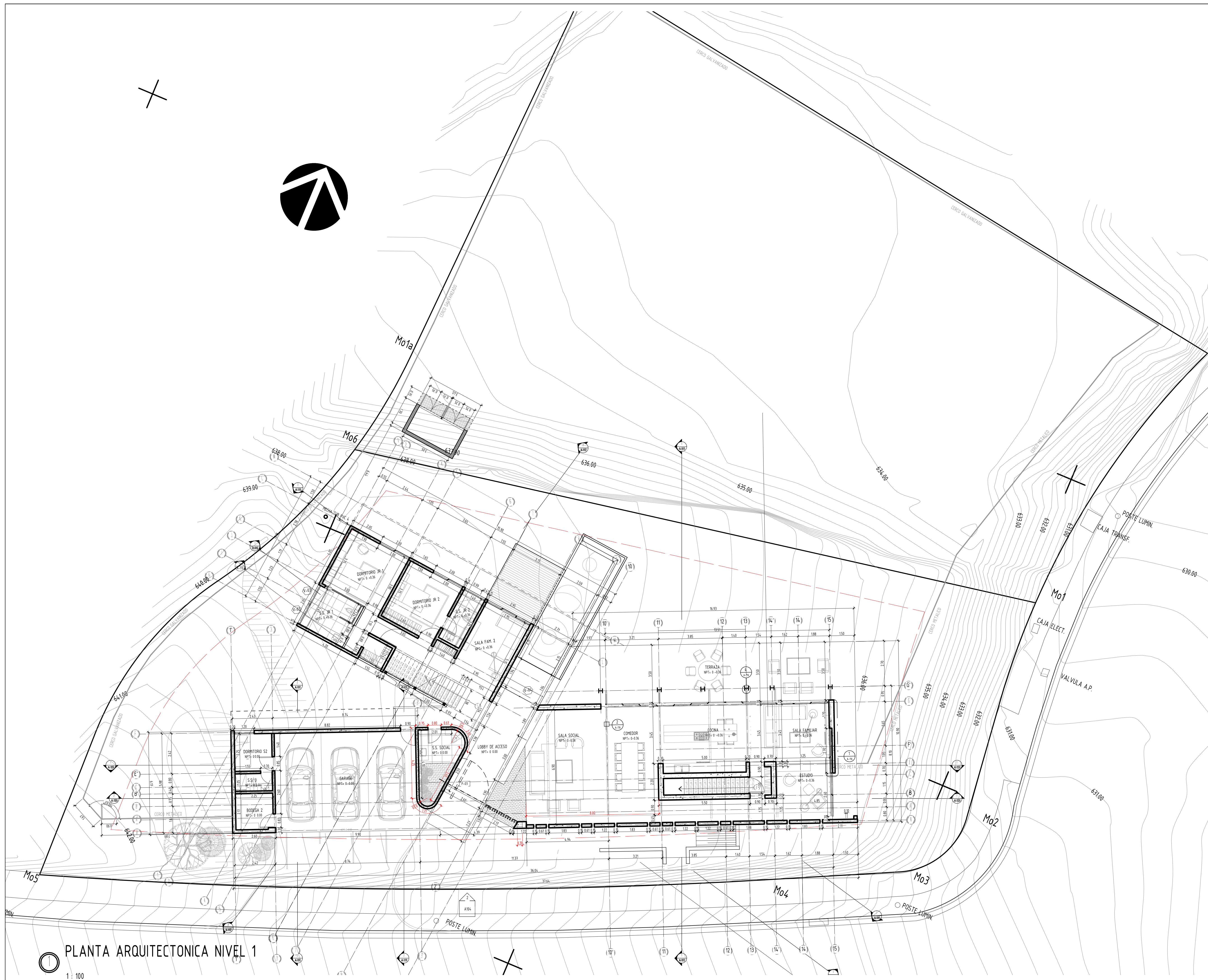
PLANTA ARQUITECTONICA NIVEL 1