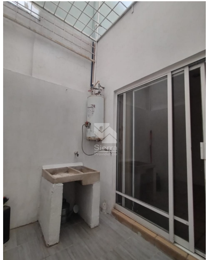
ÁREA DE LAVADO