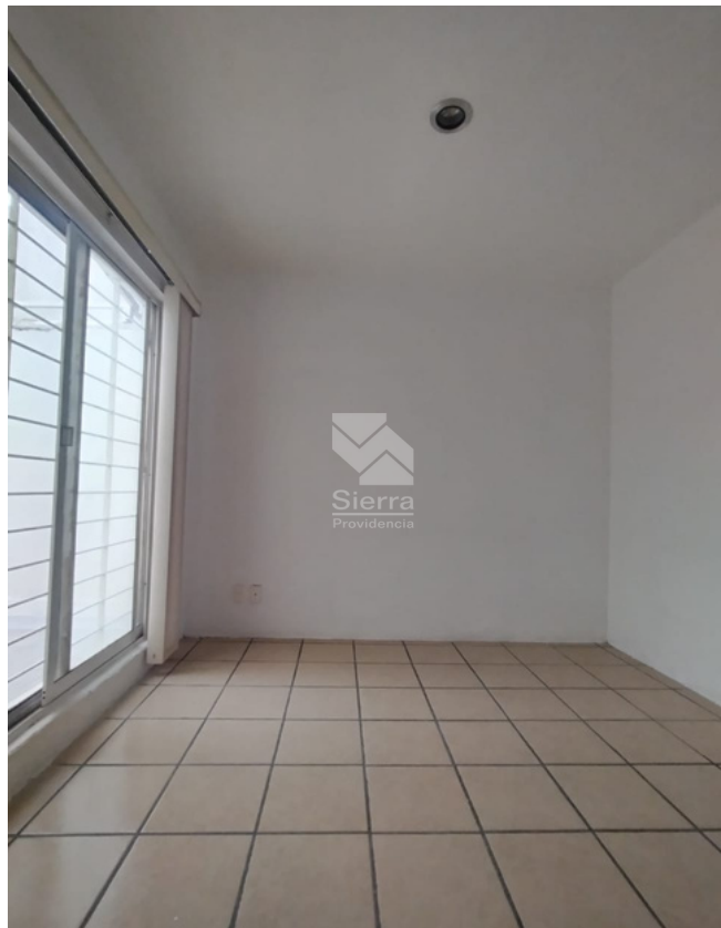
SALA DE TV O ESTUDIO