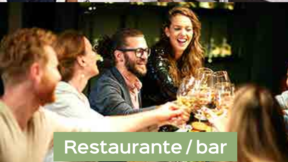
Restaurante / bar