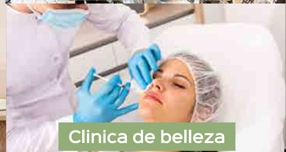
Clinica de belleza