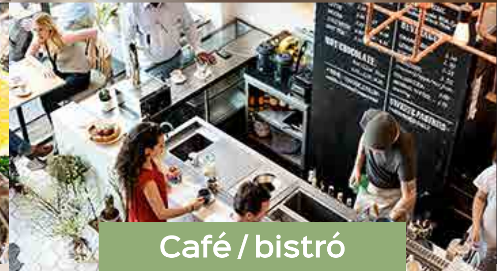
Café / bistró