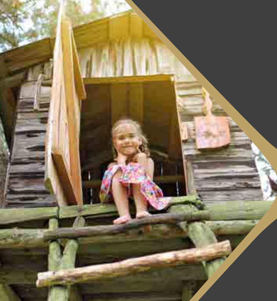
CASA DEL ÁRBOL