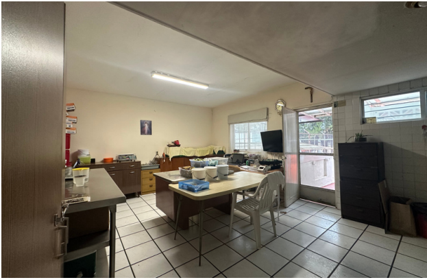
CUARTO MULTIUSOS PA