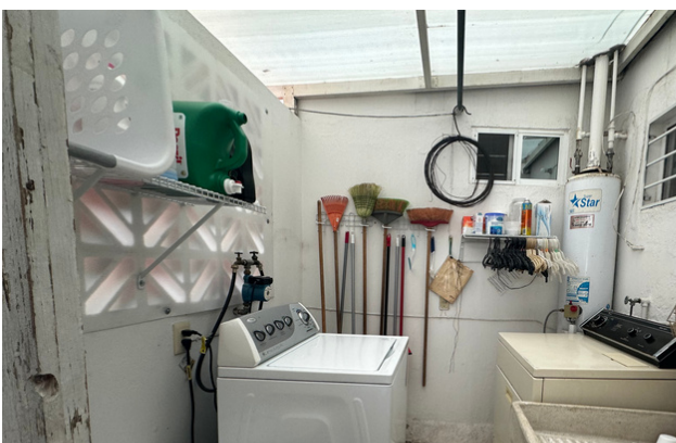
ÁREA DE SERVICIO PLANTA ALTA