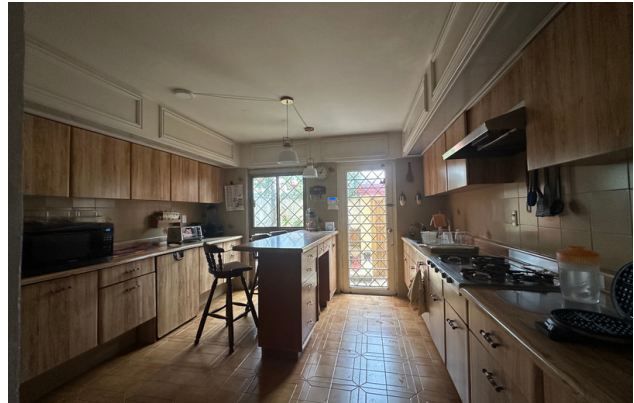
COCINA E INGRESO