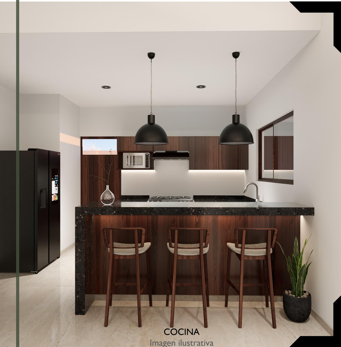
COCINA Imagen ilustrativa