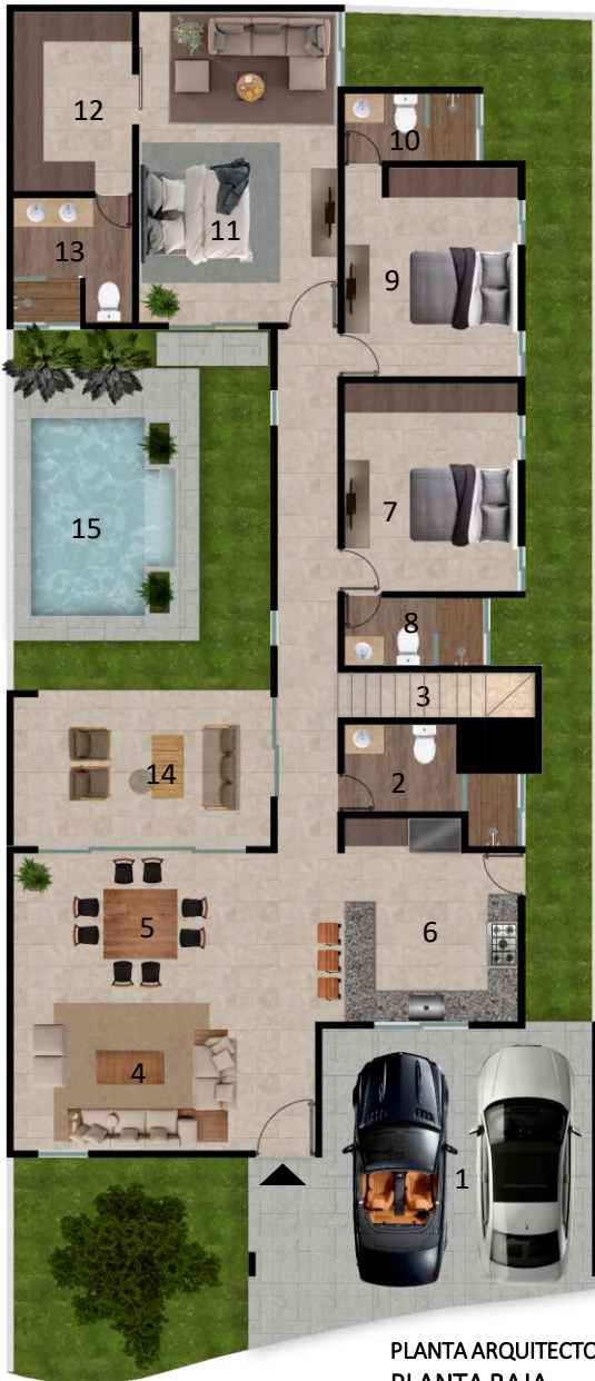
PLANTA ARQUITECTONICA PLANTA BAJA