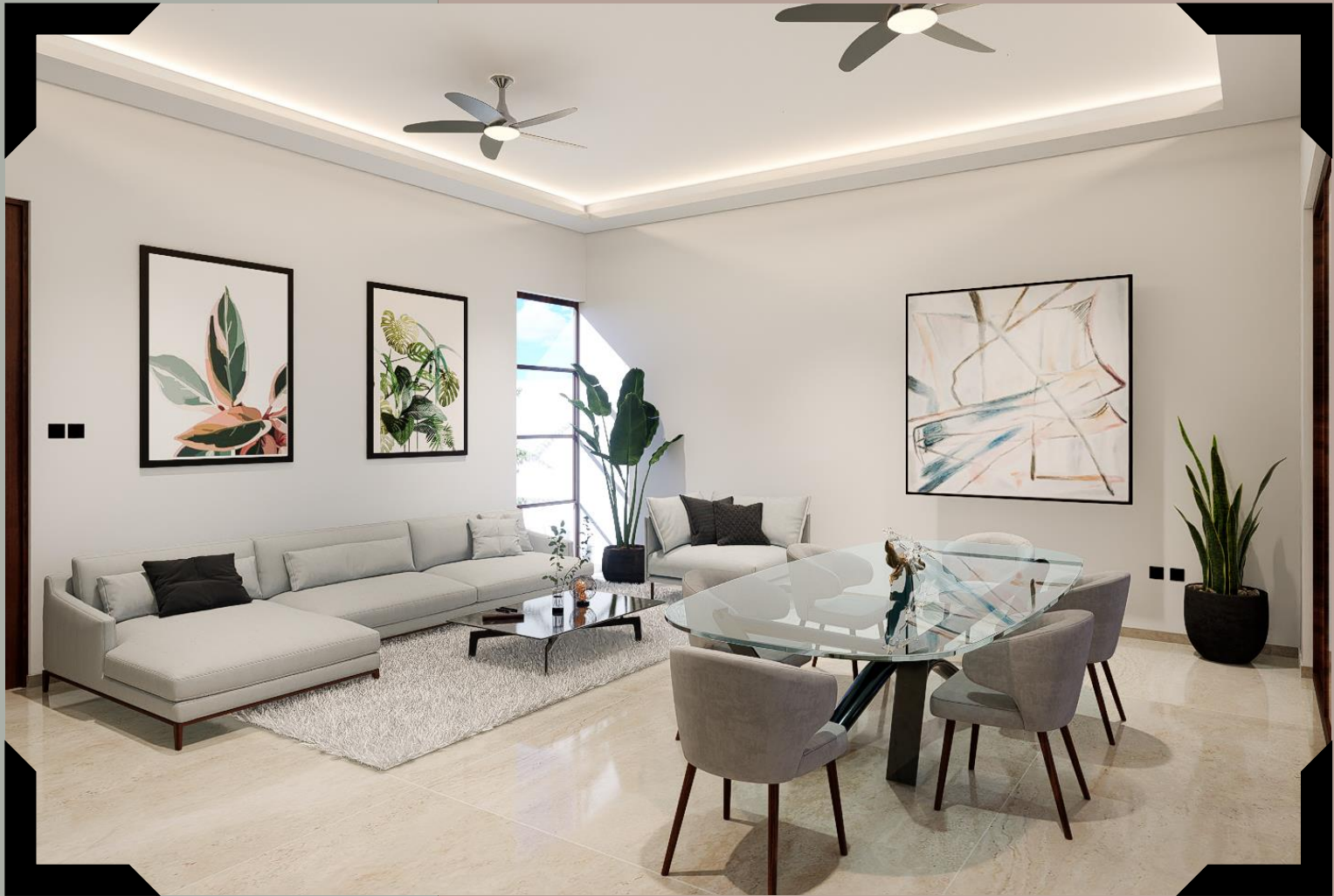
SALA – COMEDOR Imagen ilustrativa