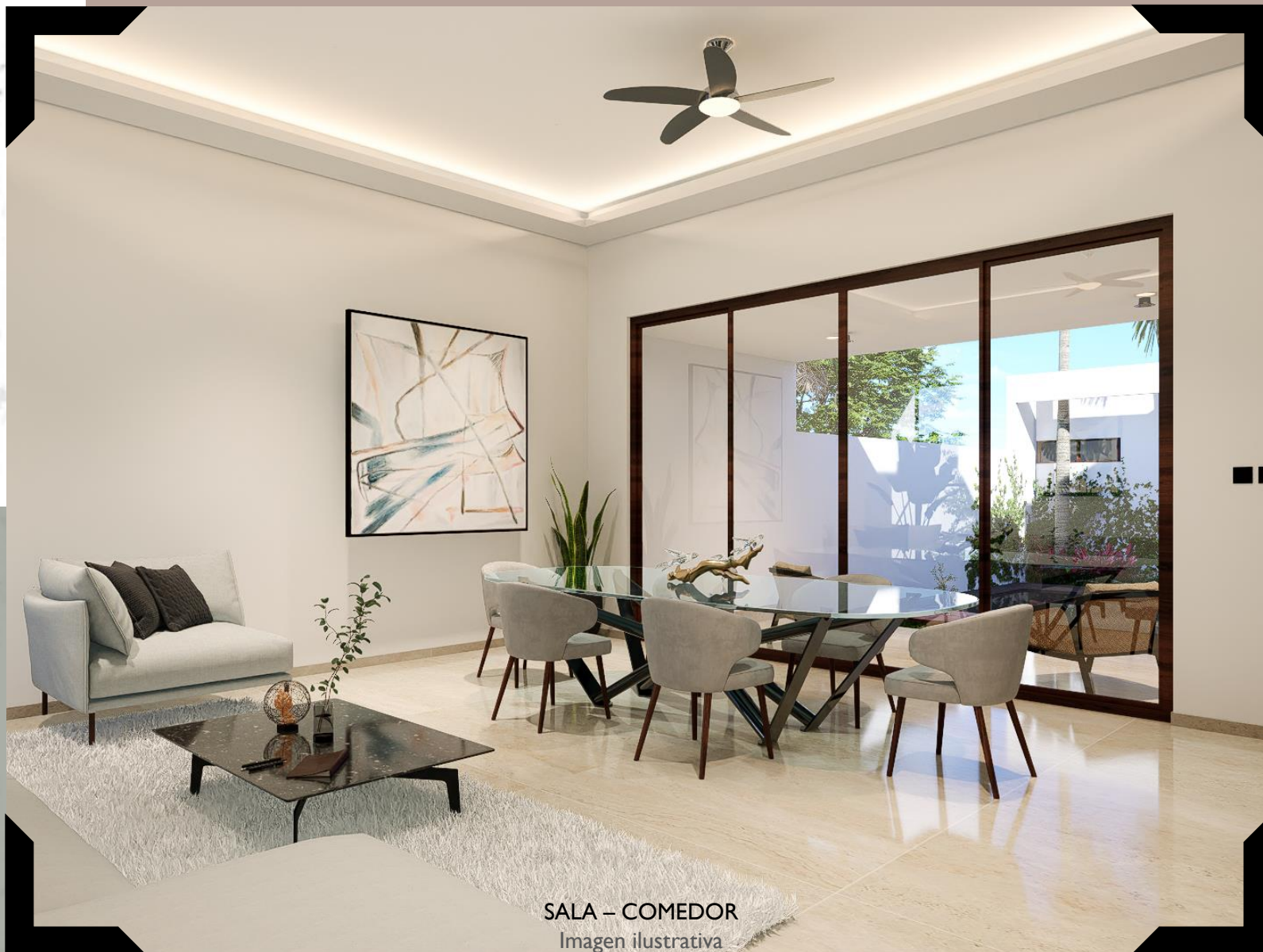
SALA – COMEDOR Imagen ilustrativa