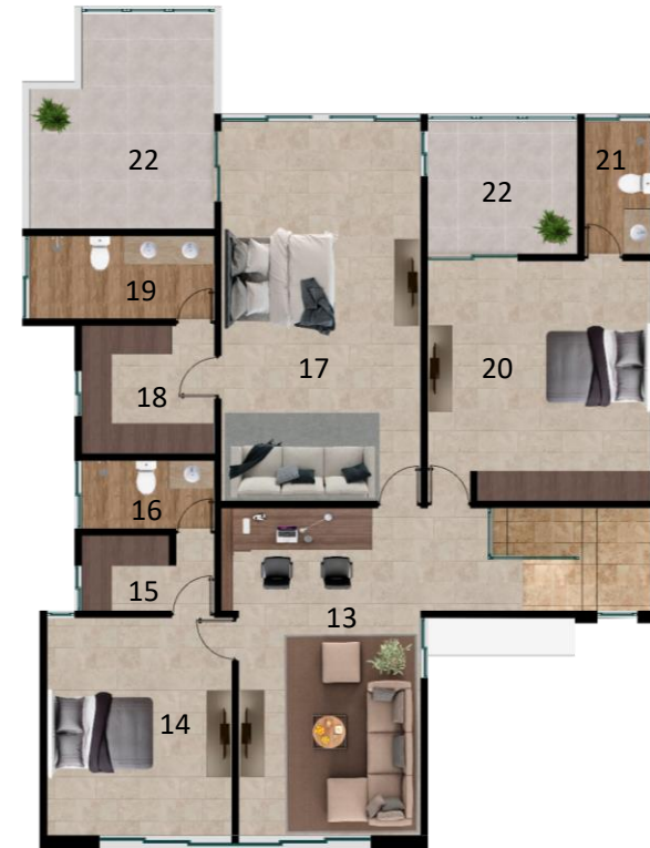
PLANTA ARQUITECTONICA PLANTA ALTA