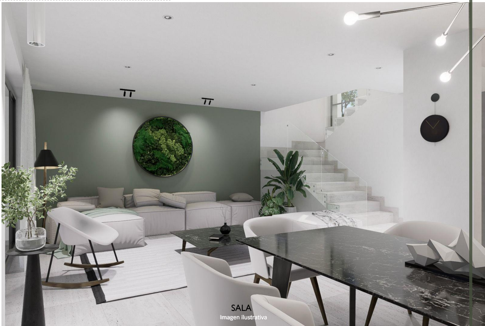
SALA Imagen ilustrativa