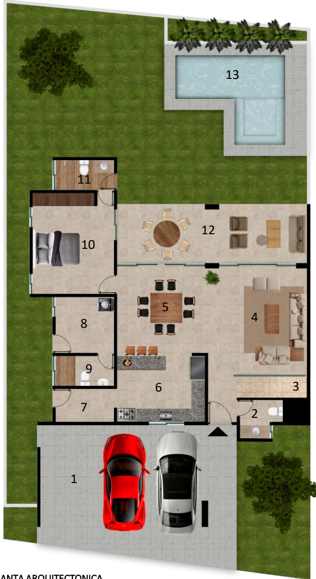
PLANTA ARQUITECTONICA PLANTA BAJA