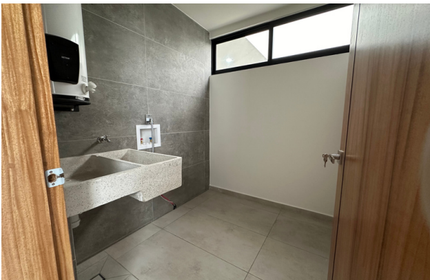
ÁREA DE LAVADO