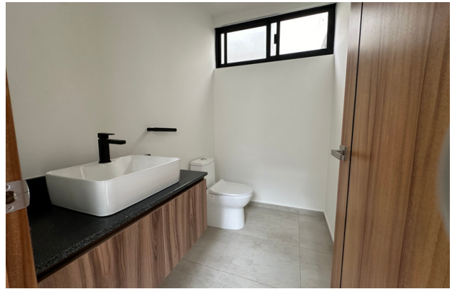
BAÑO DE VISITAS