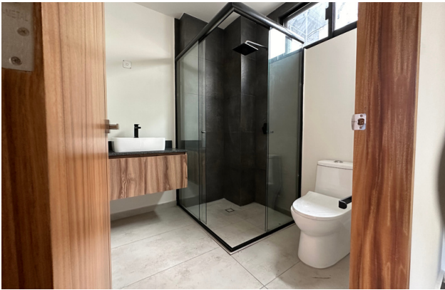
BAÑO SEGUNDA RECÁMARA