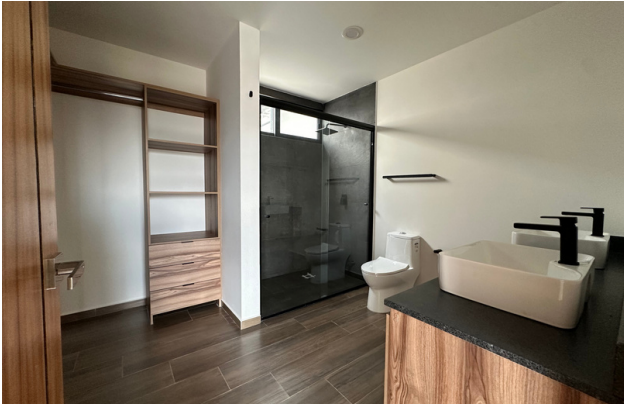
VESTIDOR Y BAÑO COMPLETO