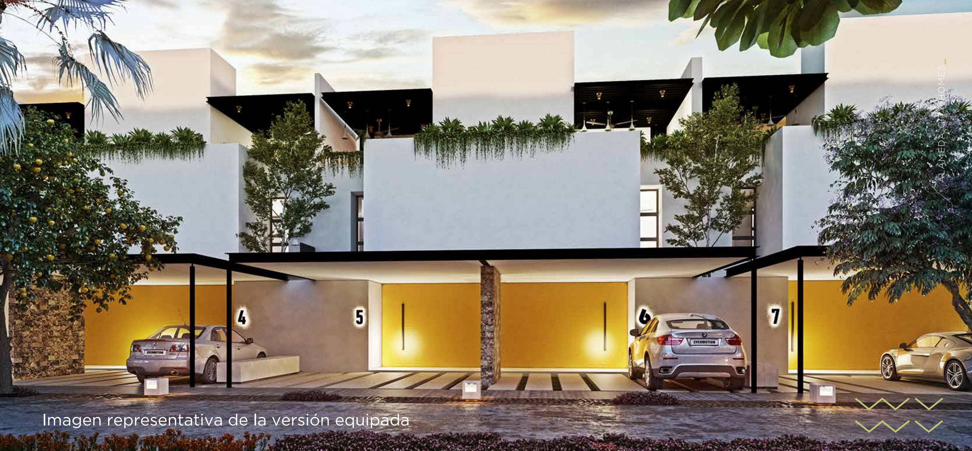
Imagen representativa de la versión equipada