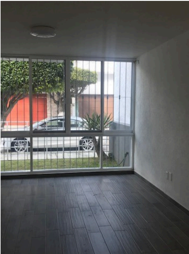
SALA Y COMEDOR