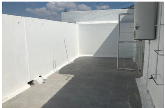
ÁREA DE SERVICIO