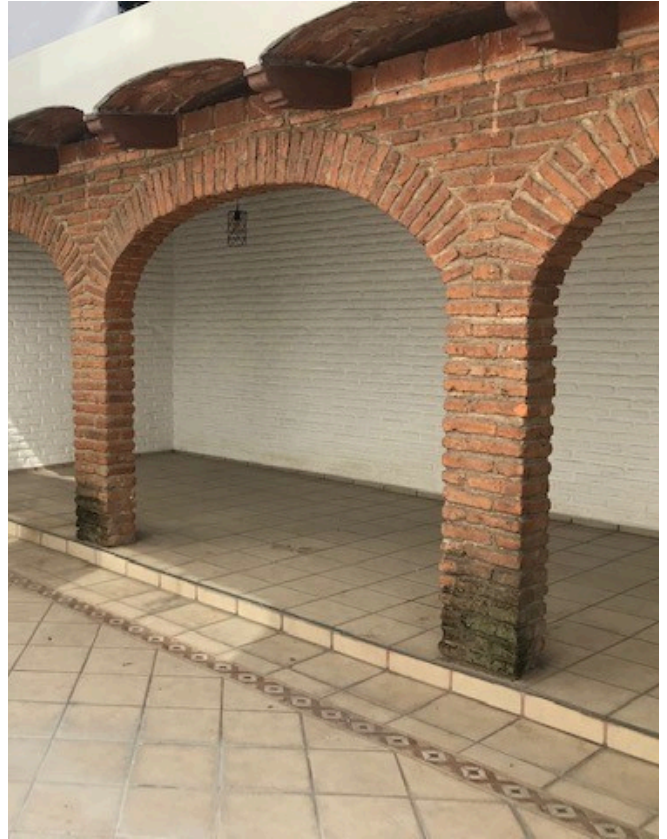
TERRAZA CON FUENTE