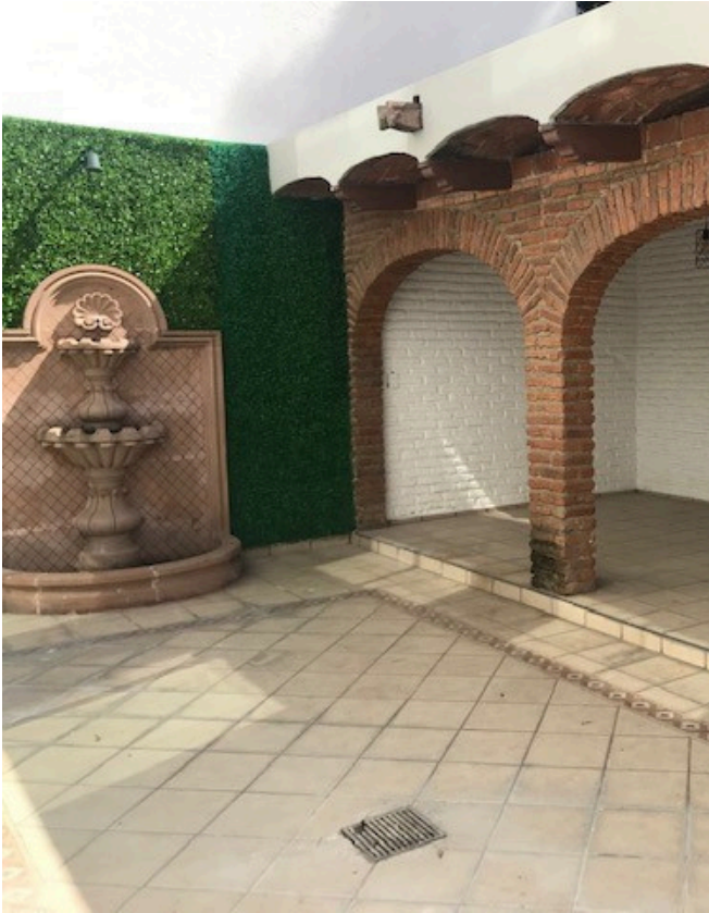
TERRAZA CON FUENTE