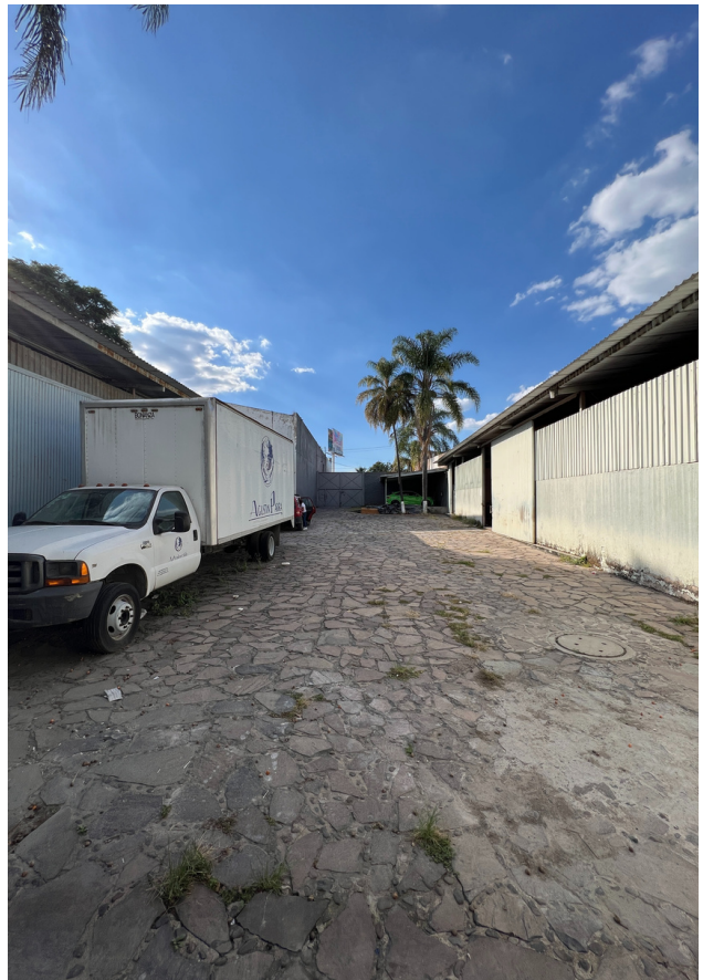
PATIO DE MANIOBRAS