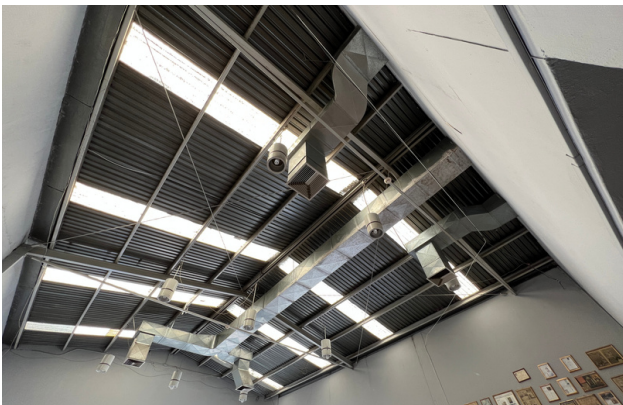
TECHO DE LÁMINA