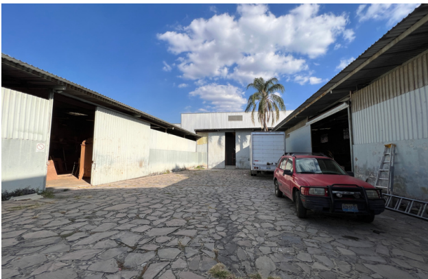
PATIO DE MANIOBRAS