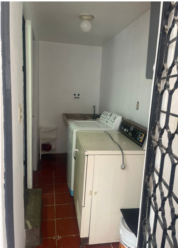
ÁREA DE LAVADO