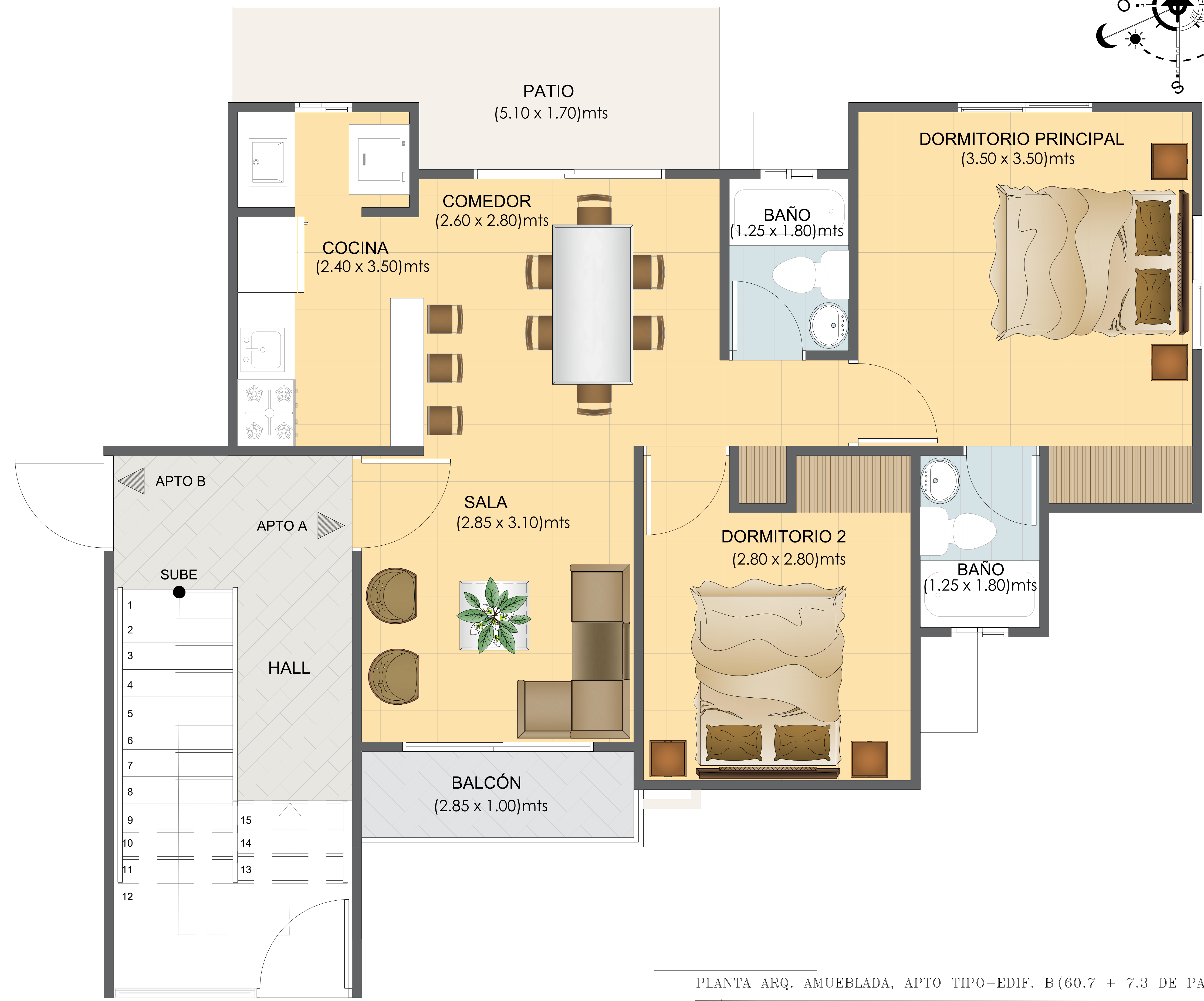
PLANTA ARQ. AMUEBLADA, APTO TIPO-EDIF. B (60.7 + 7.3 DE PATIO)