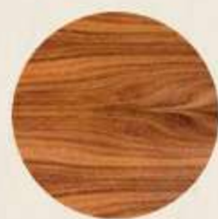
CARPINTERÍA MADERA TZALAM