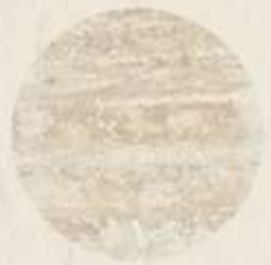
PISOS DE MÁRMOL TRAVERTINO VERACRUZ