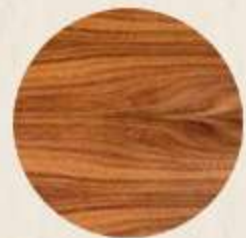
CARPINTERÍA MADERA TZALAM