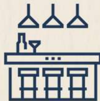
ÁREA BAR TECHADA