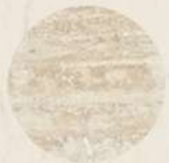
PISOS DE MÁRMOL TRAVERTINO VERACRUZ