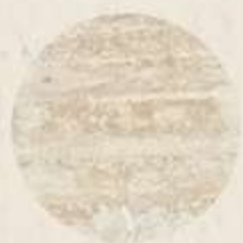
PISOS DE MÁRMOL TRAVERTINO VERACRUZ