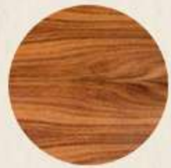
CARPINTERÍA MADERA TZALAM