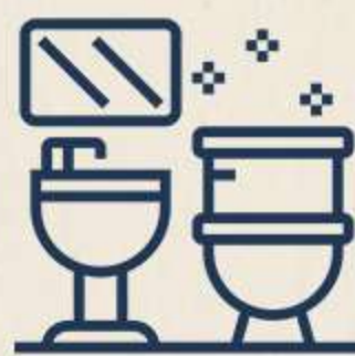
BAÑOS MUJERES Y HOMBRES