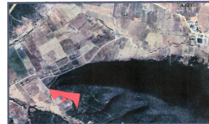
CROQUIS DE UBICACION SIN ESCALA