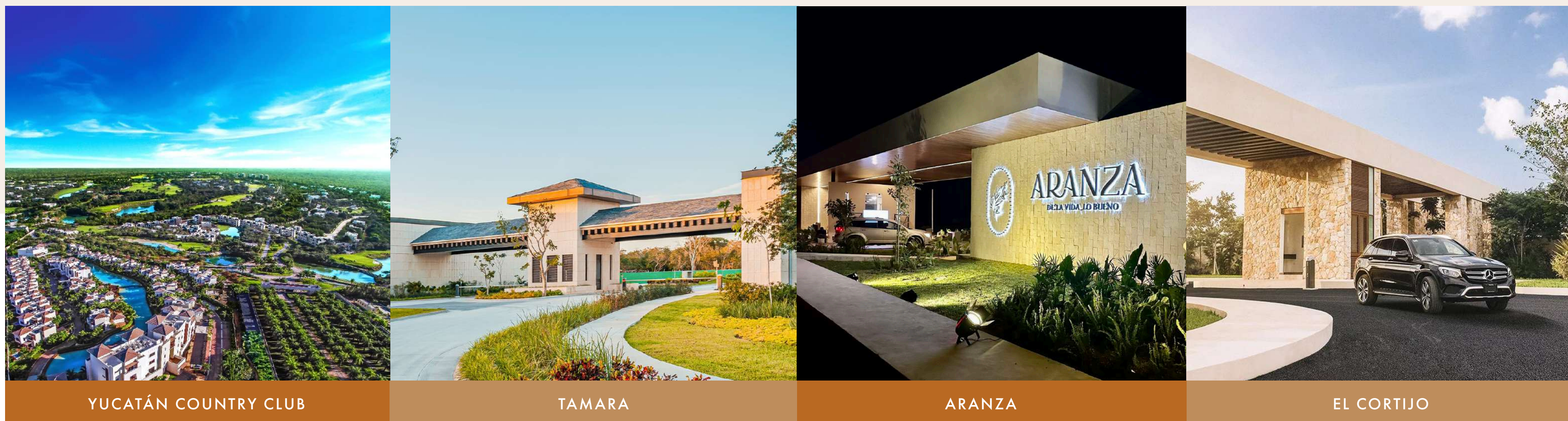
YUCATÁN COUNTRY CLUB