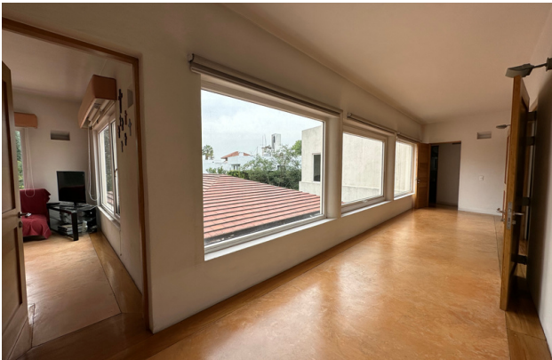
DISTRIBUCIÓN PLANTA ALTA