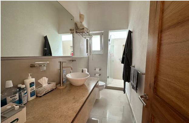
BAÑO SEGUNDA RECÁMARA