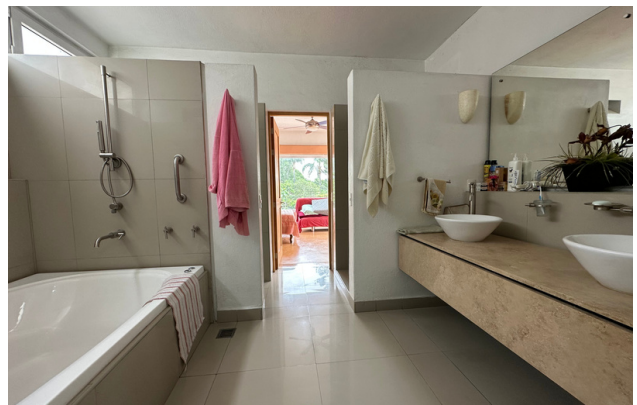
BAÑO RECÁMARA PRINCIPAL