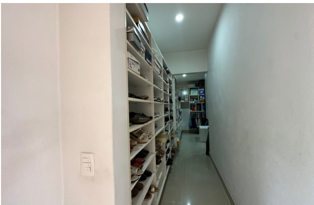
CLOSET RECÁMARA PRINCIPAL