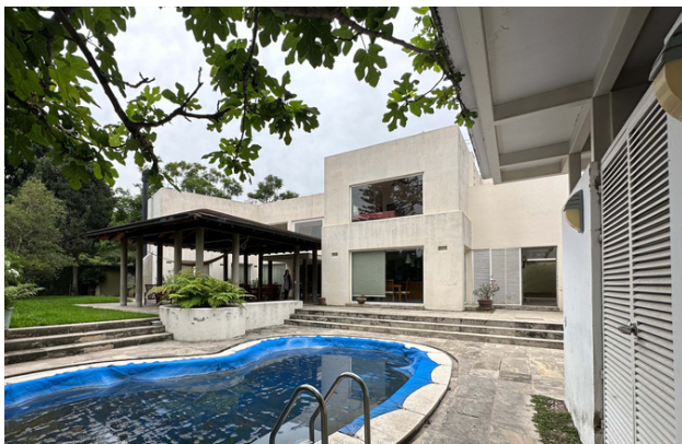
FACHADA Y ALBERCA