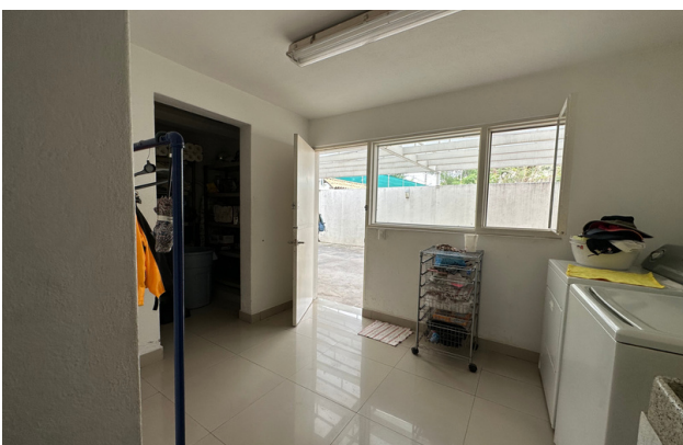
ÁREA DE SERVICIO