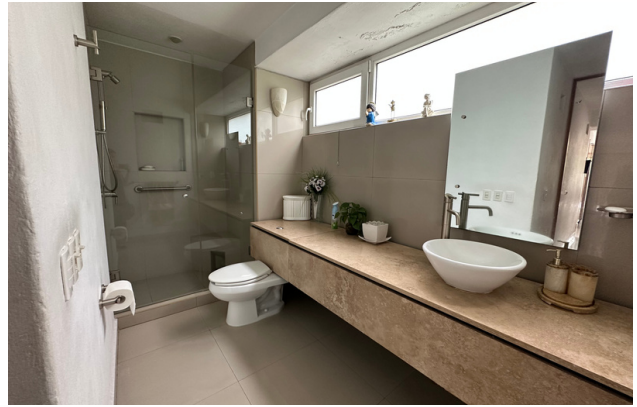
BAÑO DE VISITAS