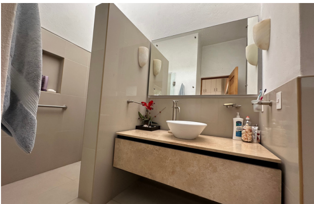
BAÑO TERCER RECÁMARA