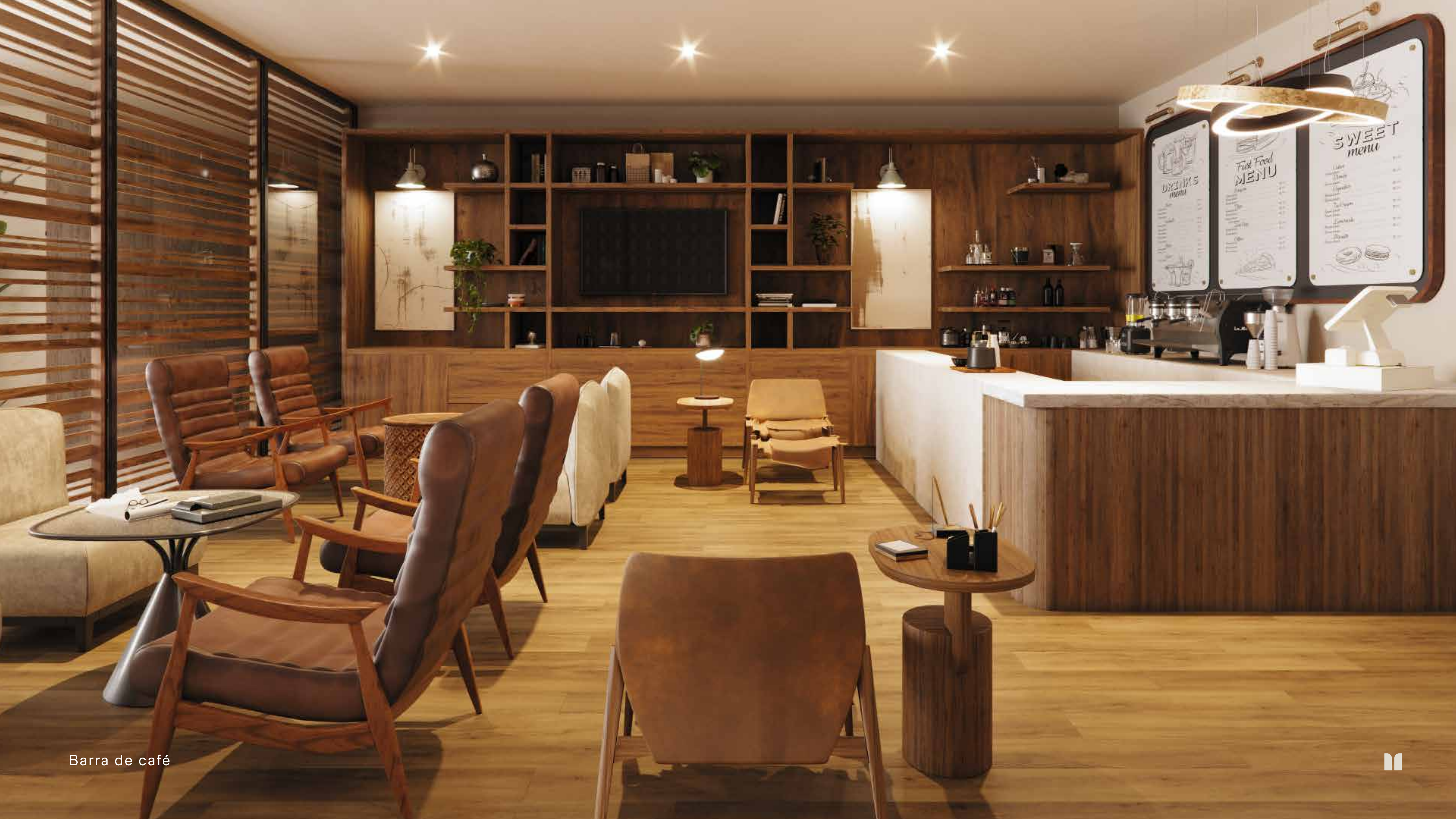
Barra de café