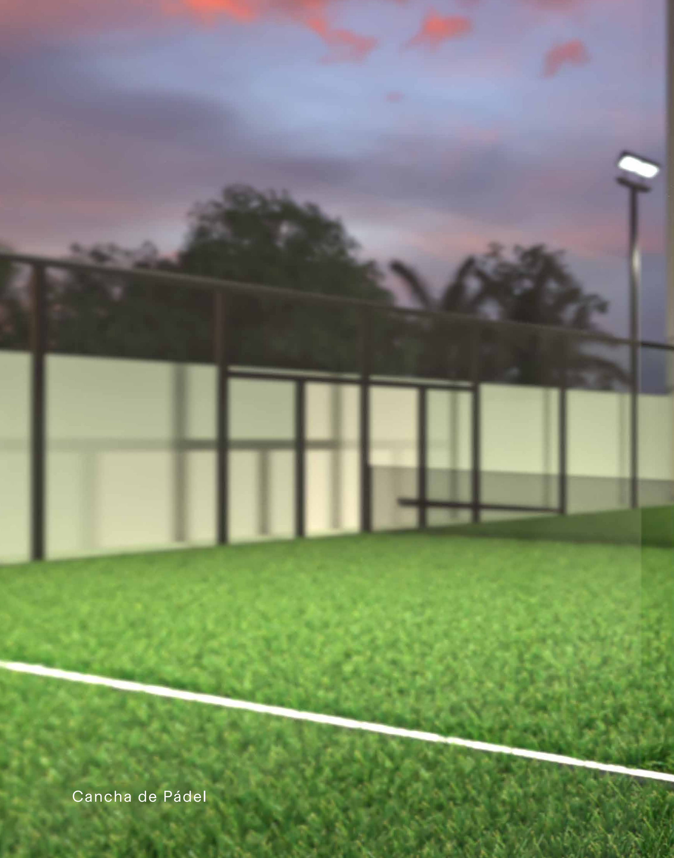
Cancha de Pádel