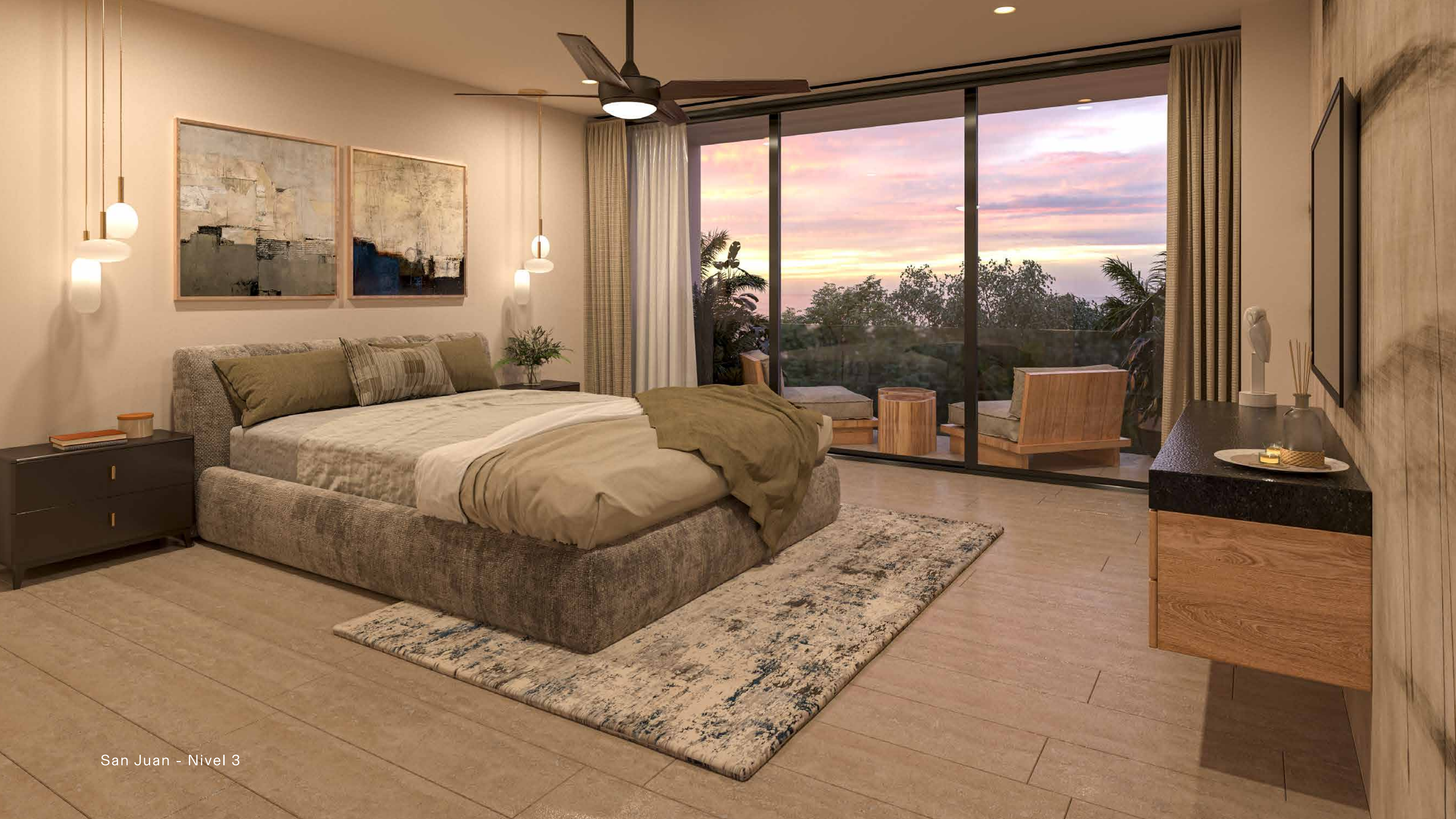
San Juan - Nivel 3