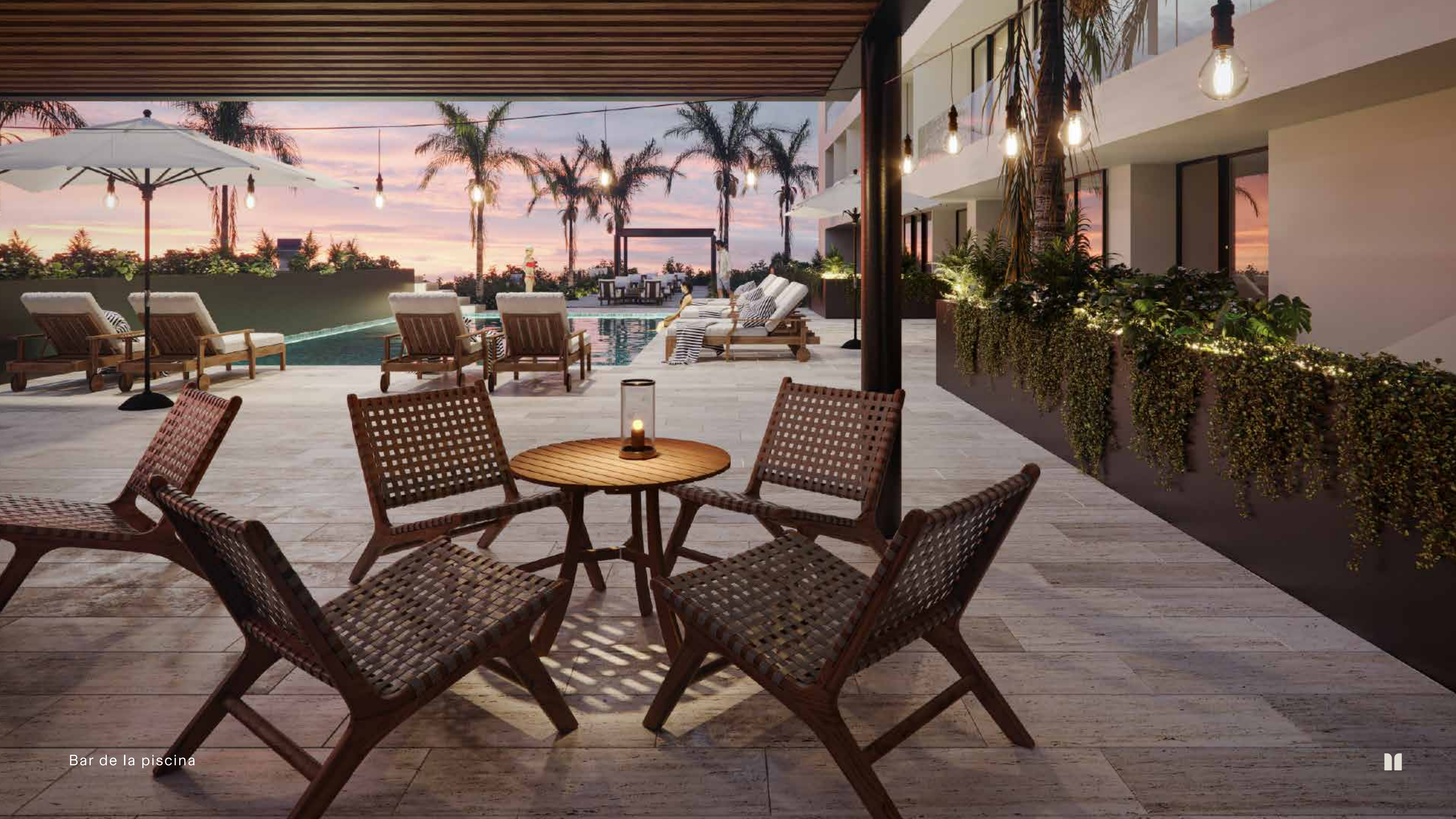
Bar de la piscina