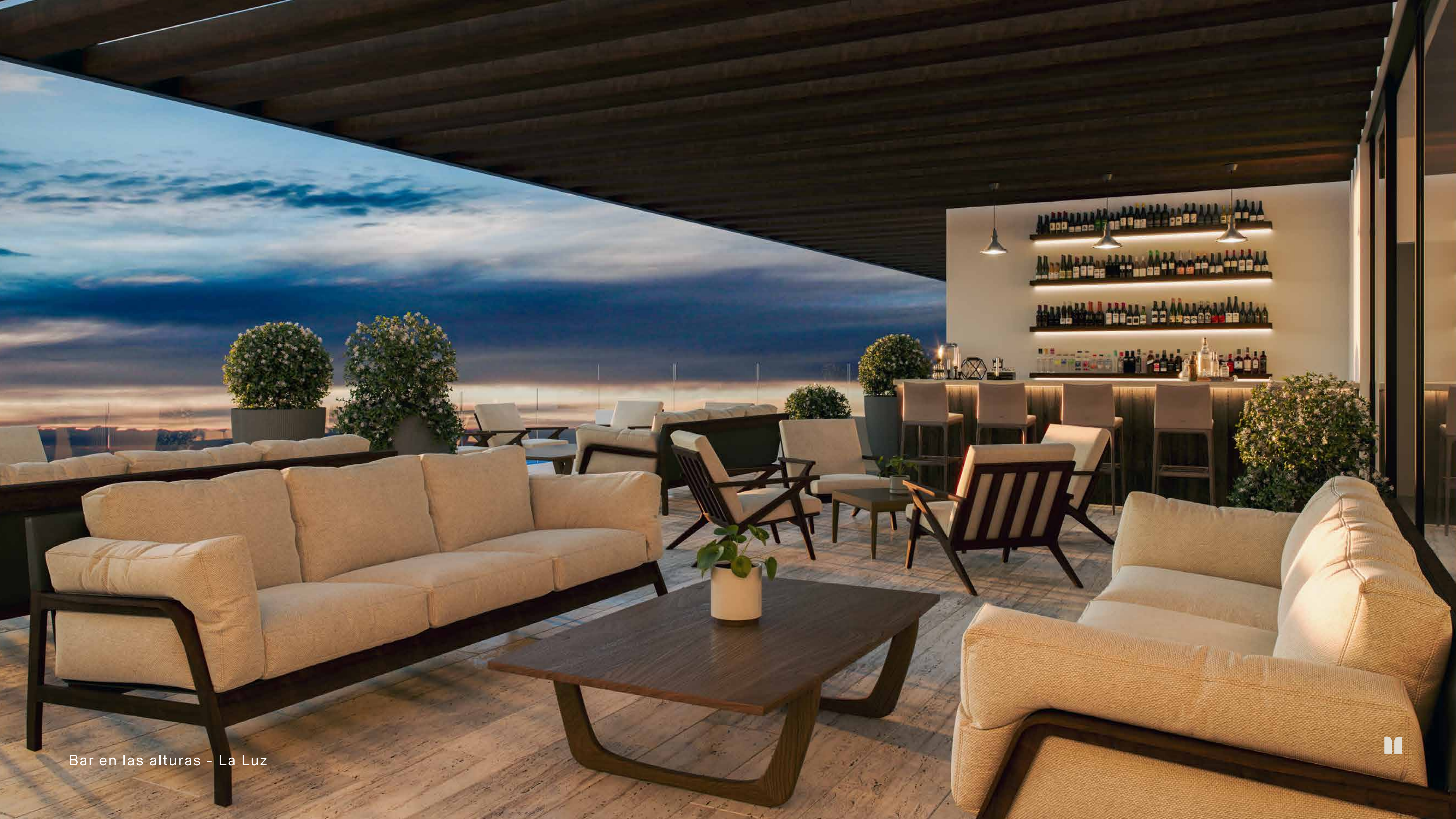
Bar en las alturas - La Luz