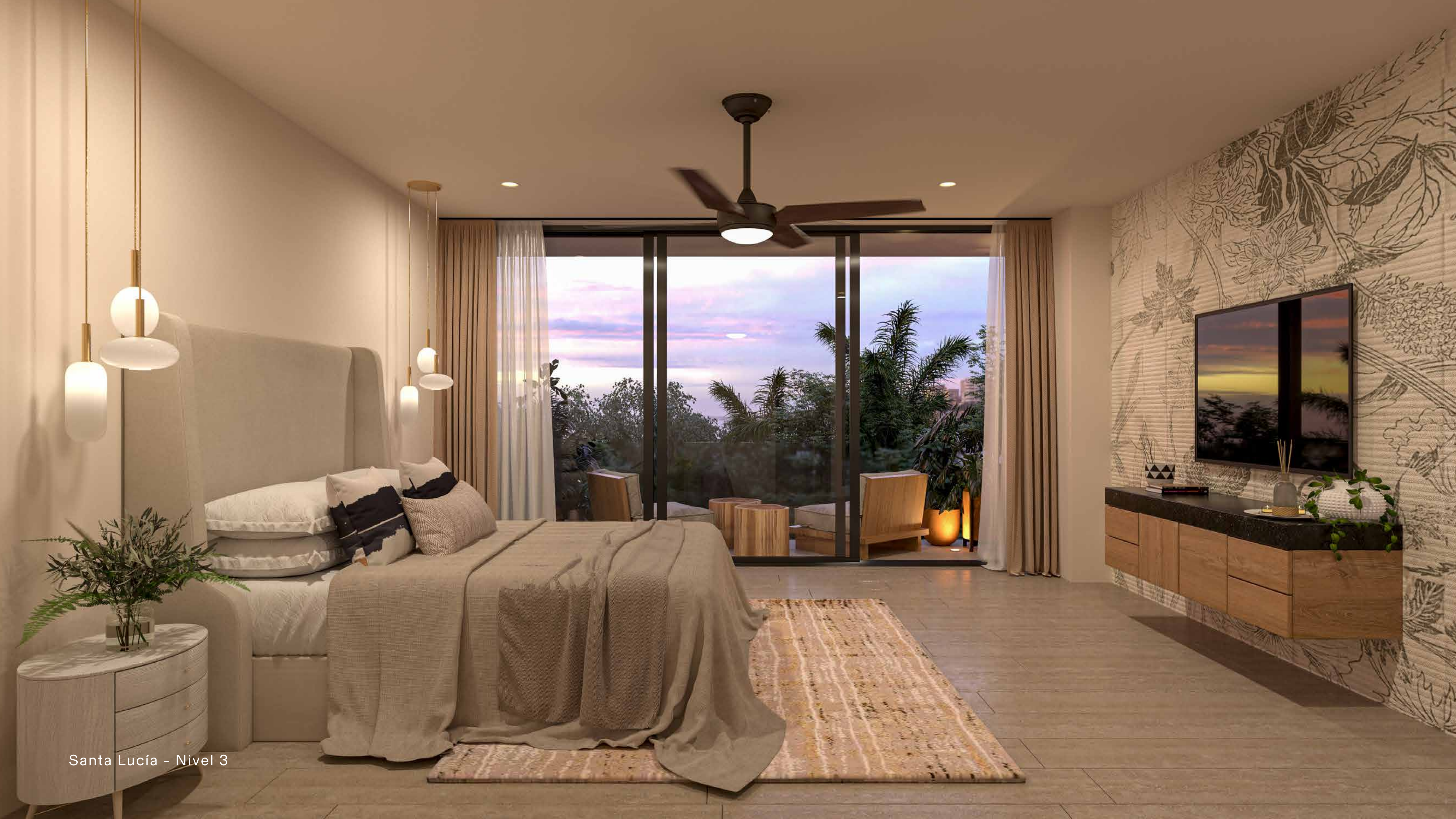
Santa Lucía - Nivel 3