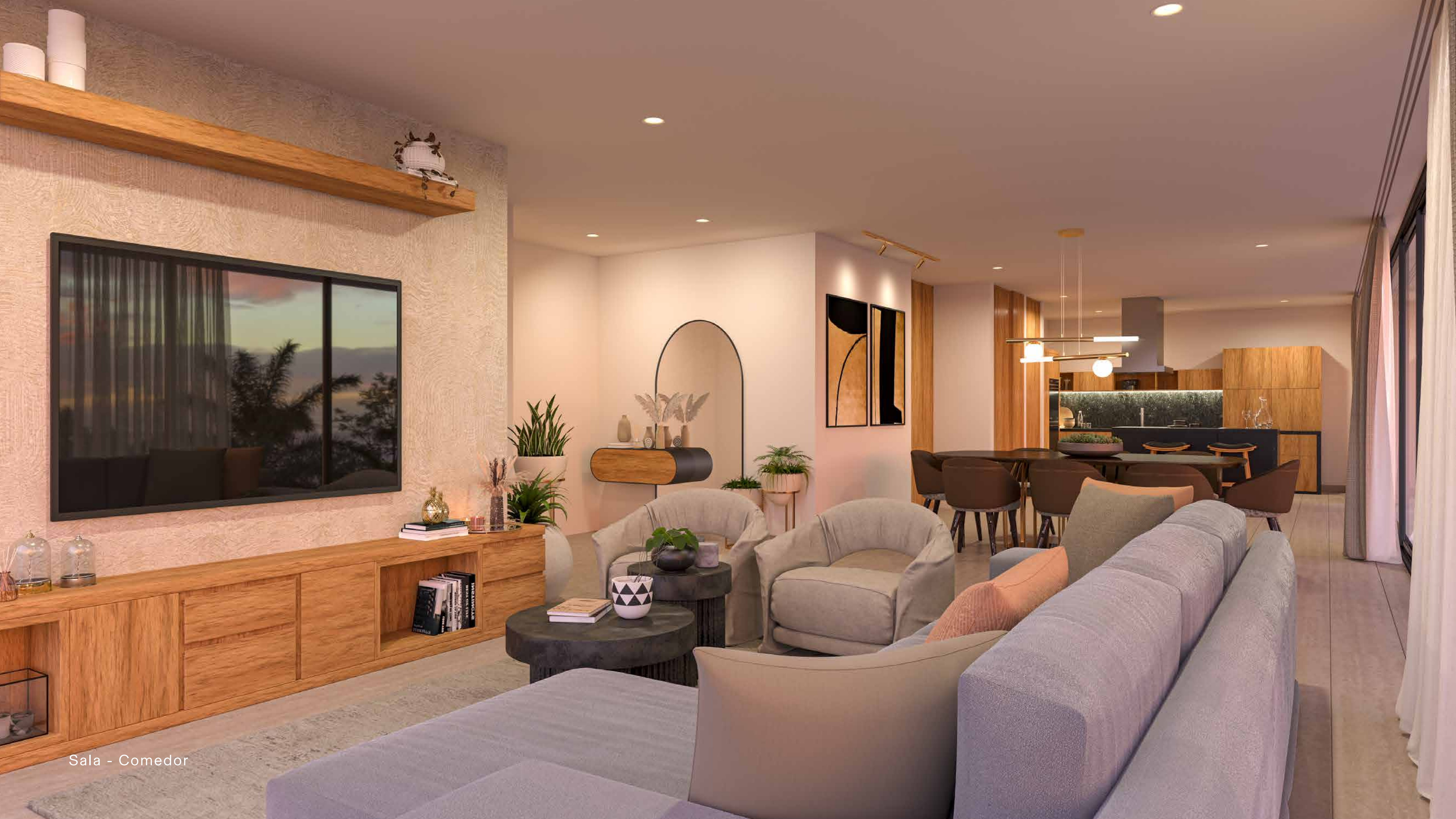
Sala - Comedor