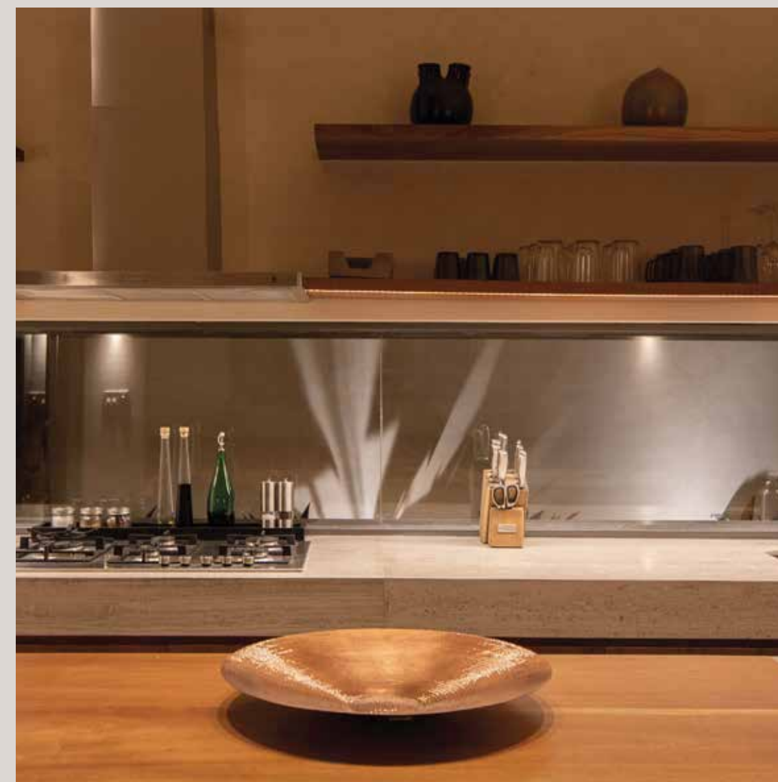
Diseños y materiales que realzan la arquitectura de la península, creando espacios únicos.