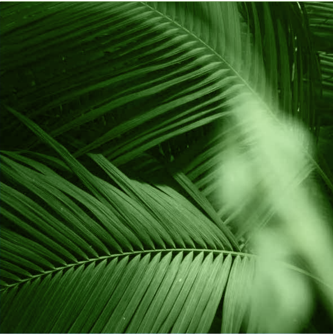
Espacios privados que convergen con patios y zonas jardinadas.