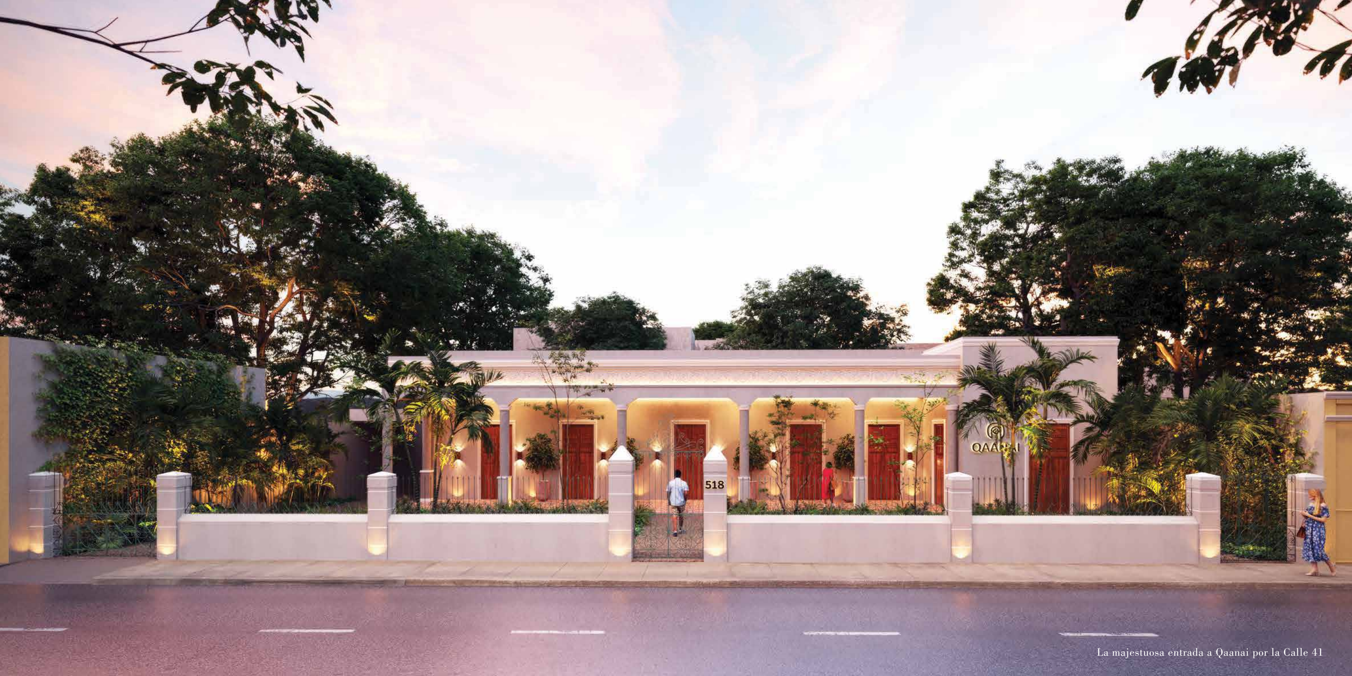
La majestuosa entrada a Qaanai por la Calle 41