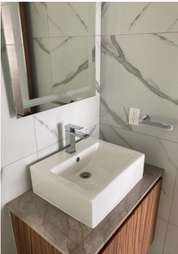
BAÑO DE VISITAS