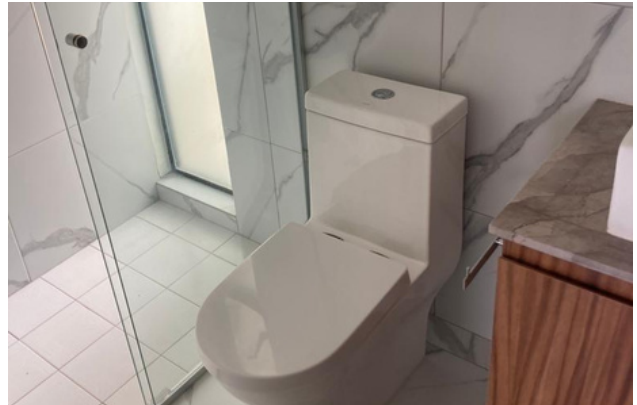
BAÑO DE VISITAS