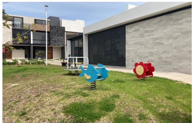
ÁREA DE JUEGOS INFANTILES