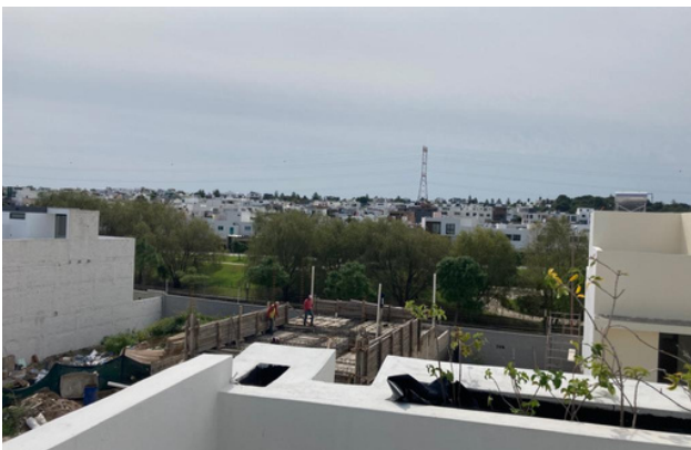
VISTA DESDE ROOF GARDEN