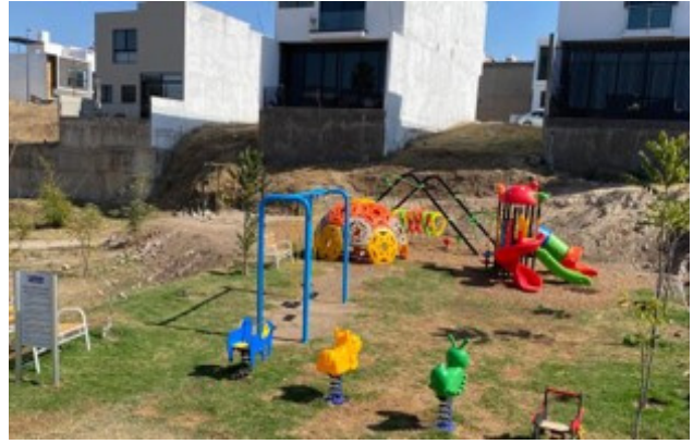
ÁREA DE JUEGOS INFANTILES