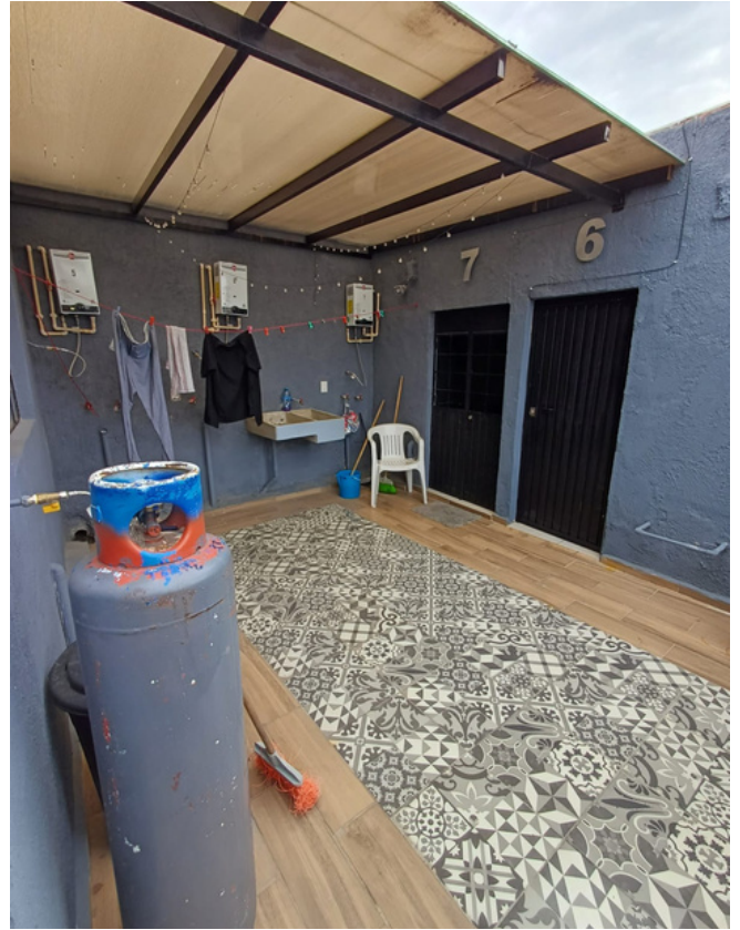
DEPARTAMENTO 6 Y 7