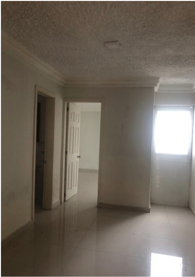
ÁREA DE T.V.