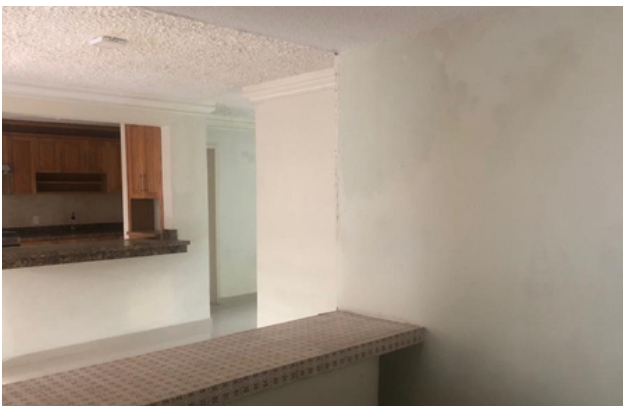
VISTA DESDE EL BAR