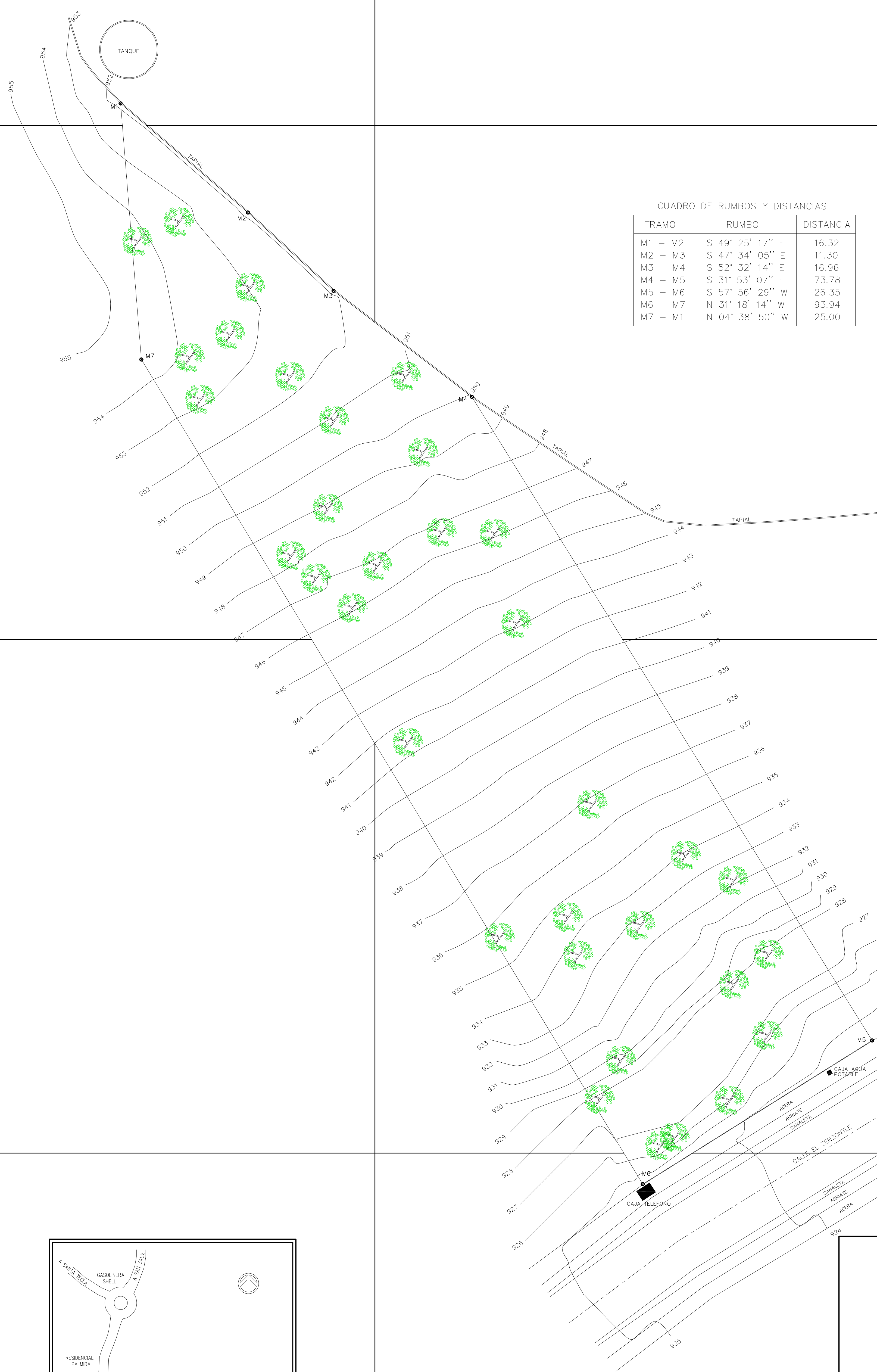
CUADRO DE RUMBOS Y DISTANCIAS