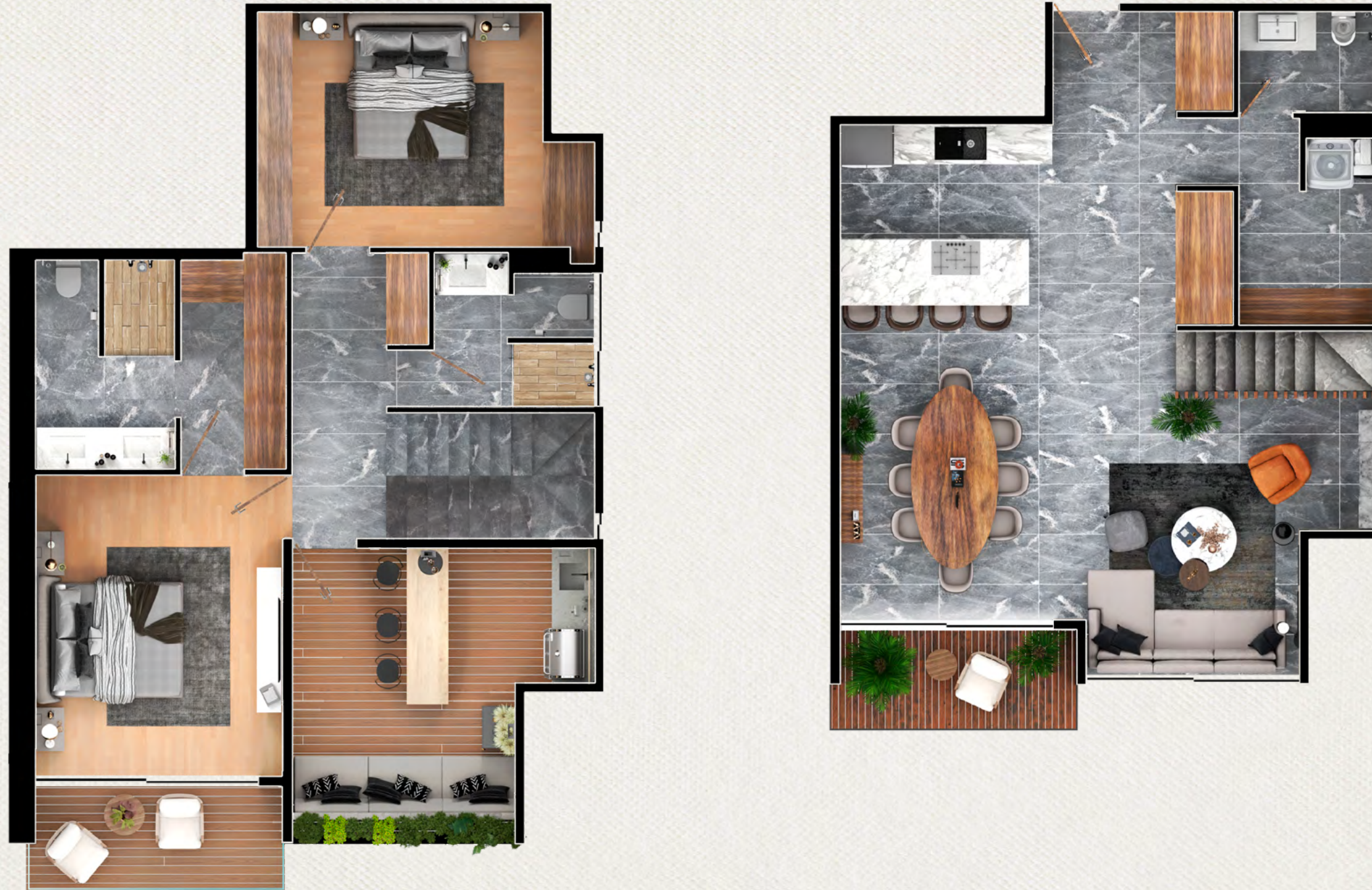
ALTO PH - B - 151.21 m 2 ROOF GARDEN 17 m 2