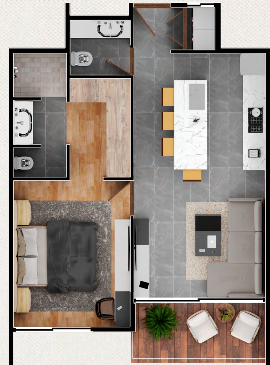
ALTO A - 68.50 m 2