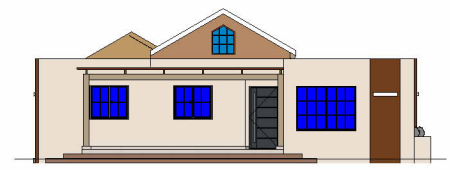
3 Elevacion Frontal 3 Hab 1 : 250