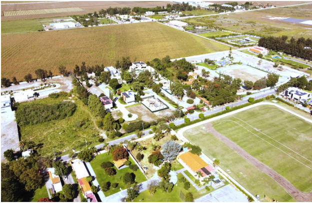
VISTA AÉREA LATERAL