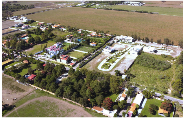
VISTA AÉREA LATERAL