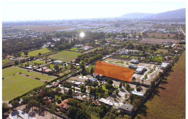
VISTA AÉREA TRASERA