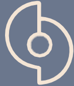
Fire pit zones