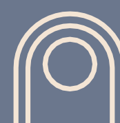
16 cajones de estacionamiento de visitas