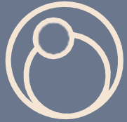
Área de hamacas