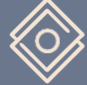
Piscina con diferentes áreas