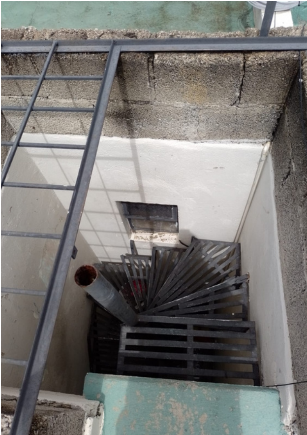
ESCALERAS DE SERVICIO