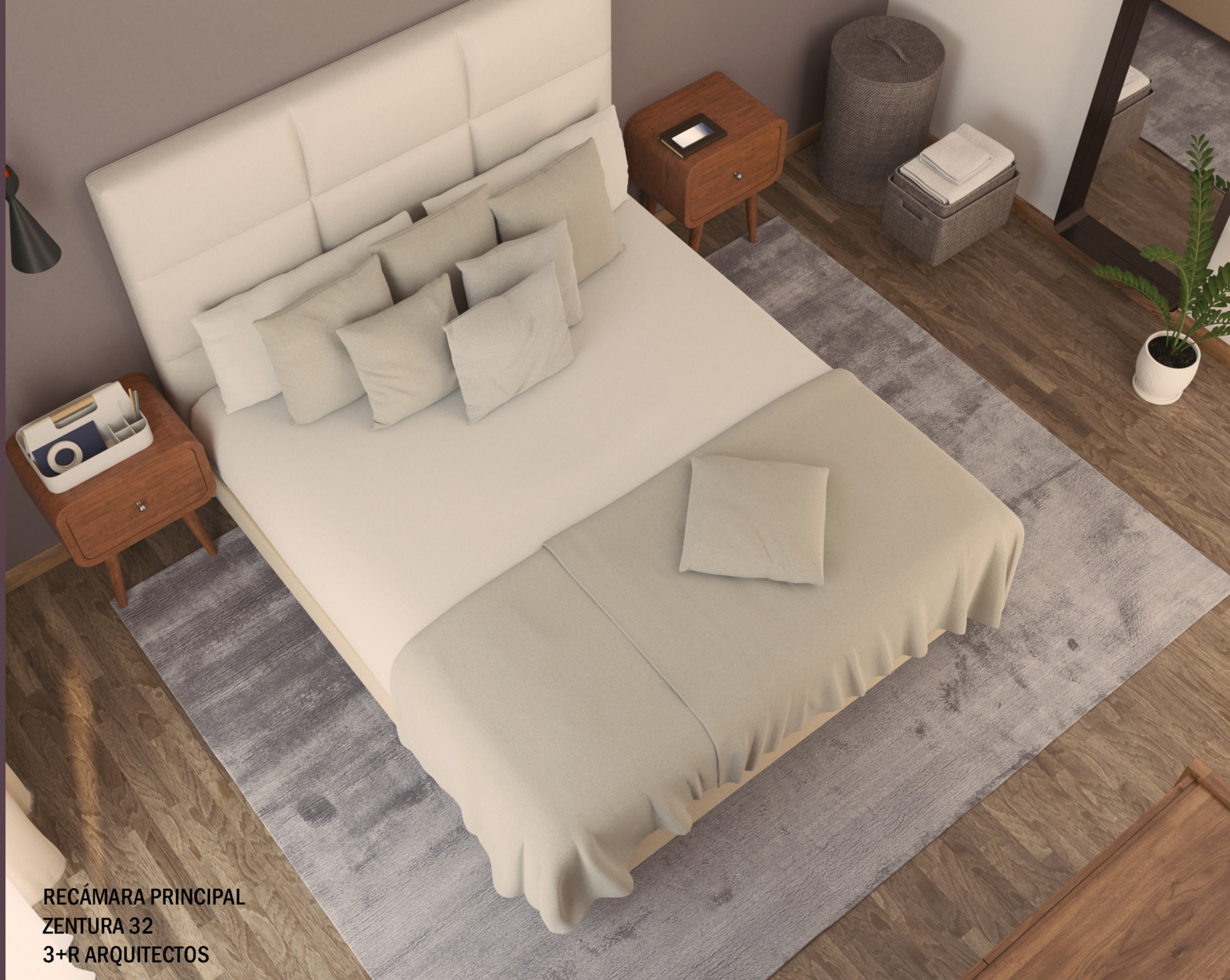
RECÁMARA PRINCIPAL ZENTURA 32 3+R ARQUITECTOS