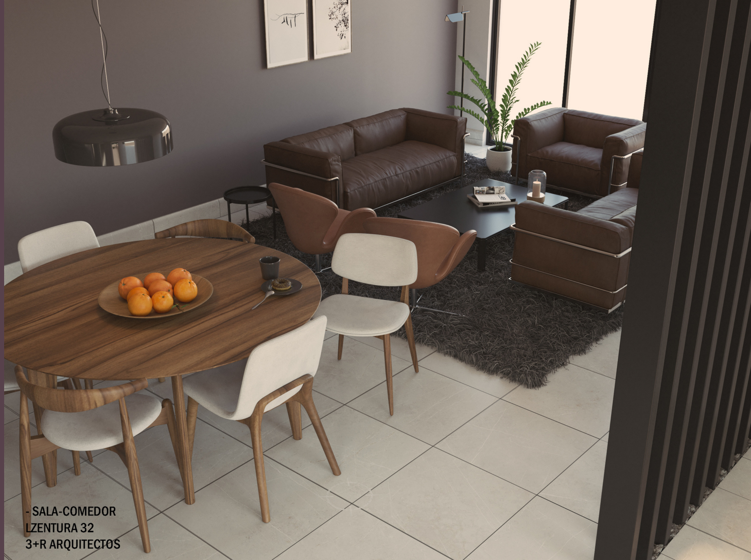
- SALA-COMEDOR LZENTURA 32 3+R ARQUITECTOS