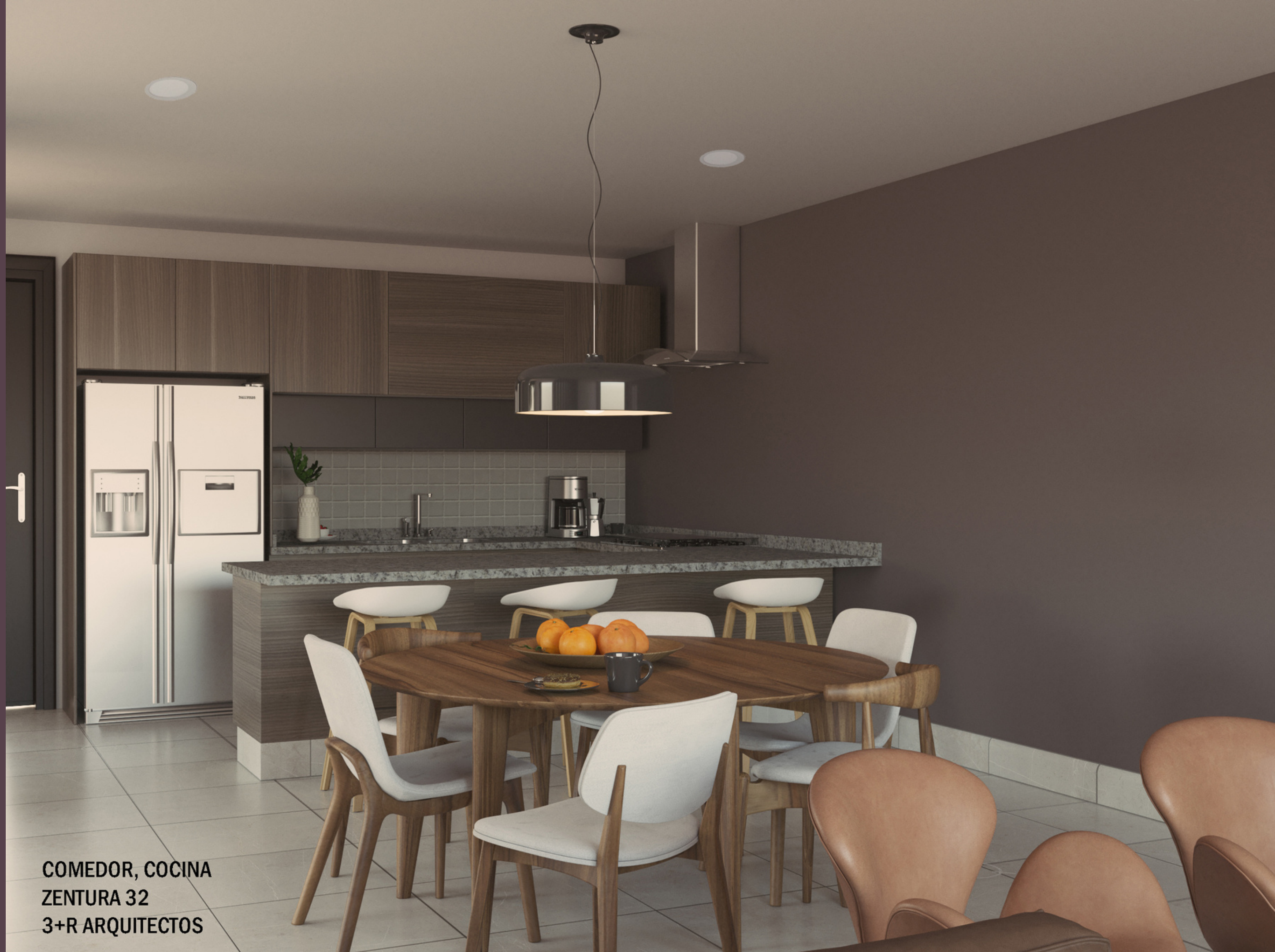
COMEDOR, COCINA ZENTURA 32 3+R ARQUITECTOS