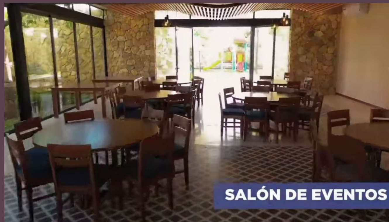
SALÓN DE EVENTOS