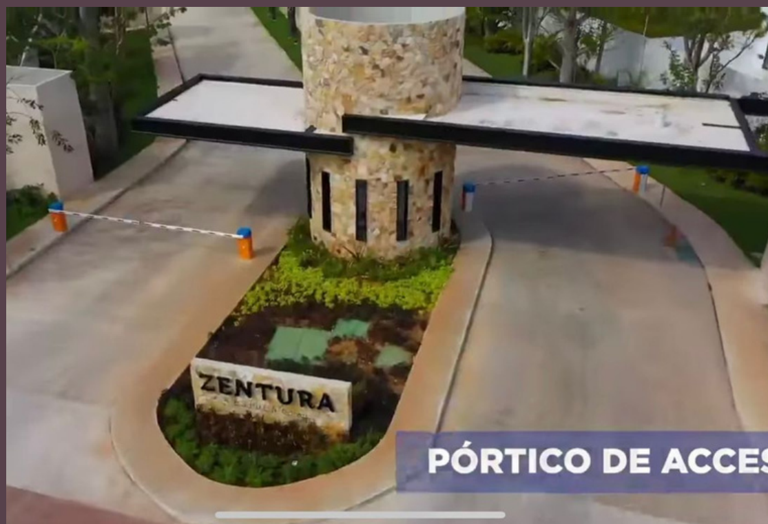
PÓRTICO DE ACCESO