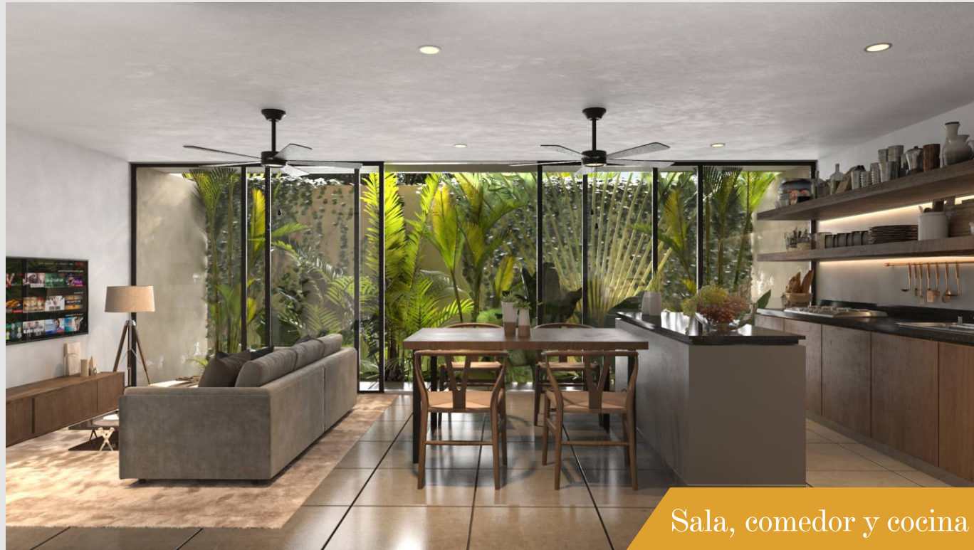
Sala, comedor y cocina