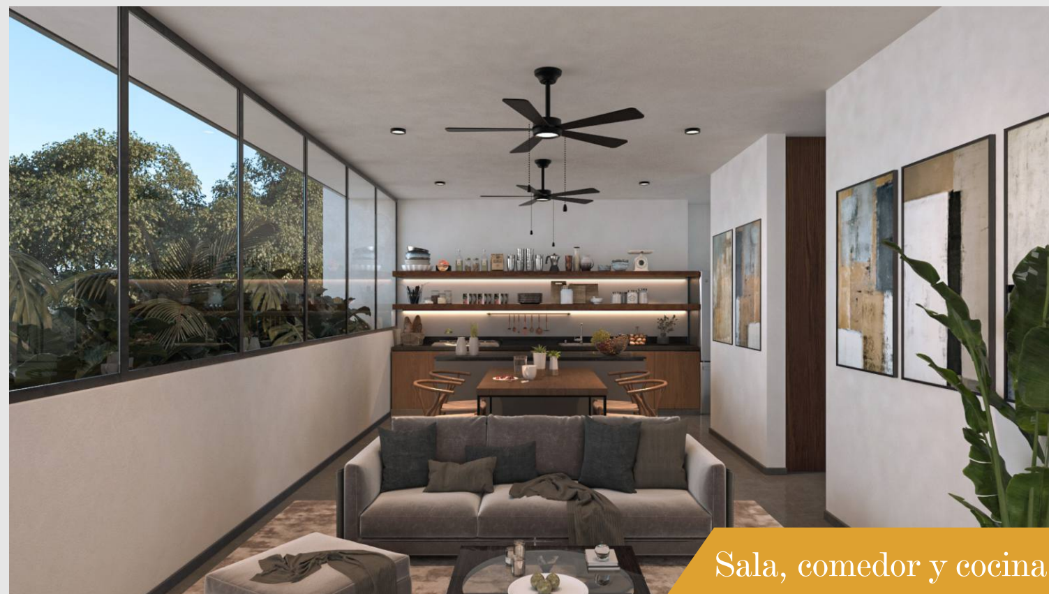
Sala, comedor y cocina