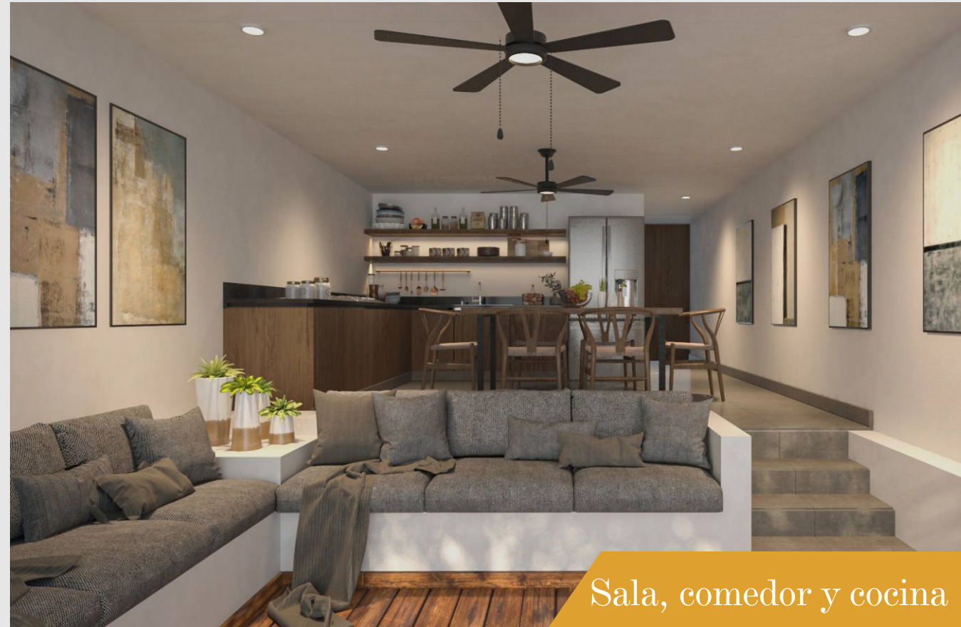
Sala, comedor y cocina