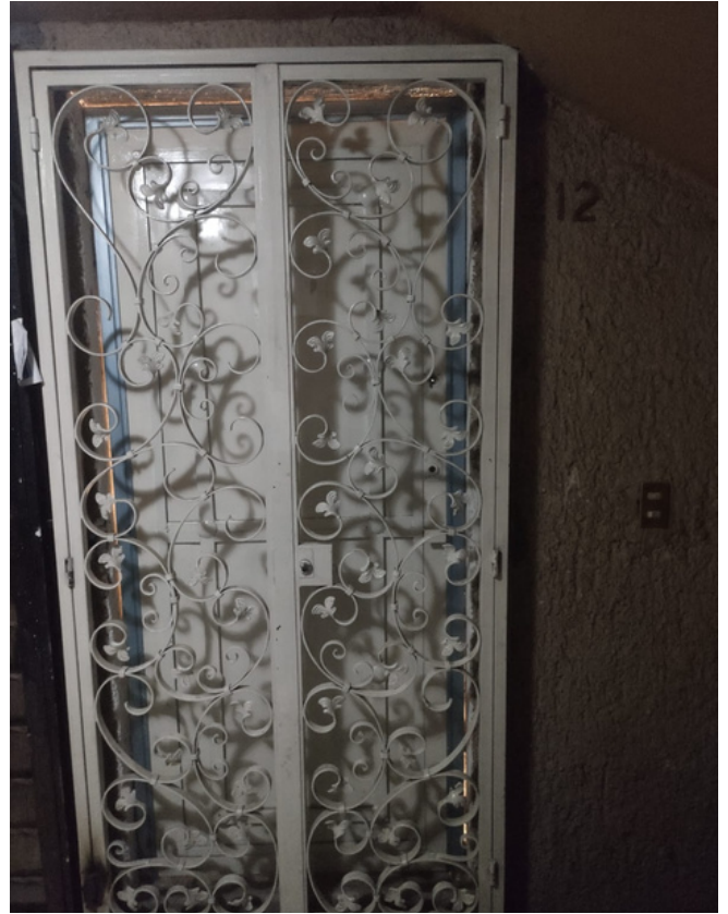
INGRESO A DEPARTAMENTO