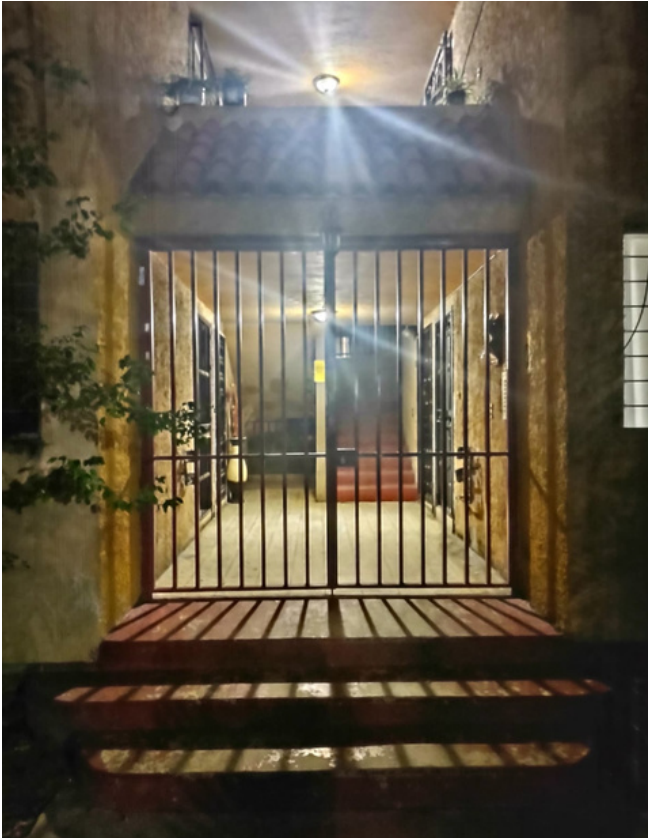
INGRESO A TORRE