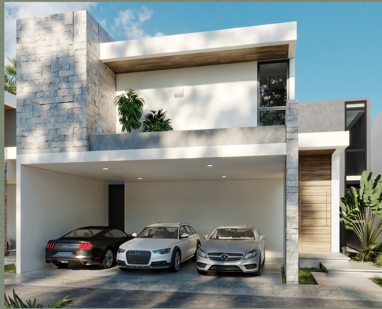
MODELO B 316.09 m 2