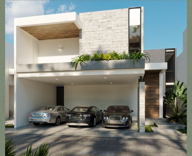
MODELO C 314.05 m 2