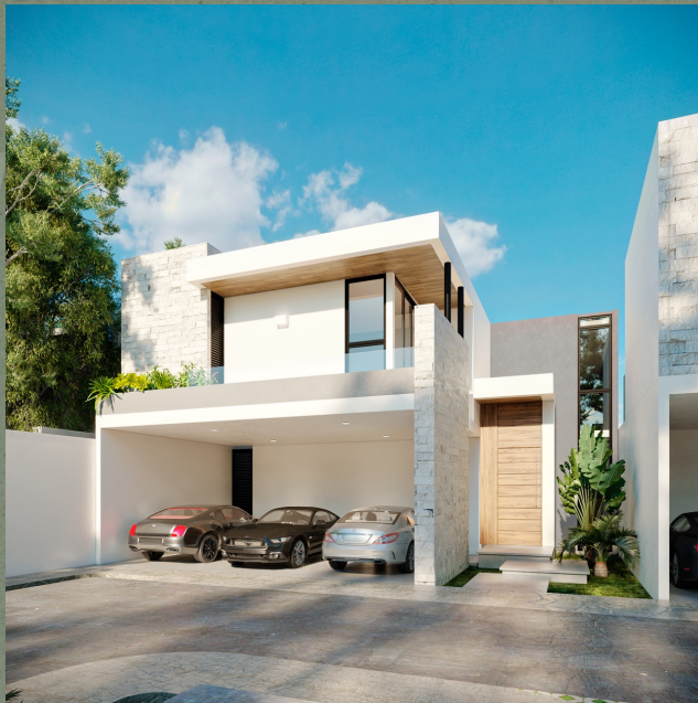
MODELO A 315.81 m 2

3 Fachadas diferentes, mismos interiores.