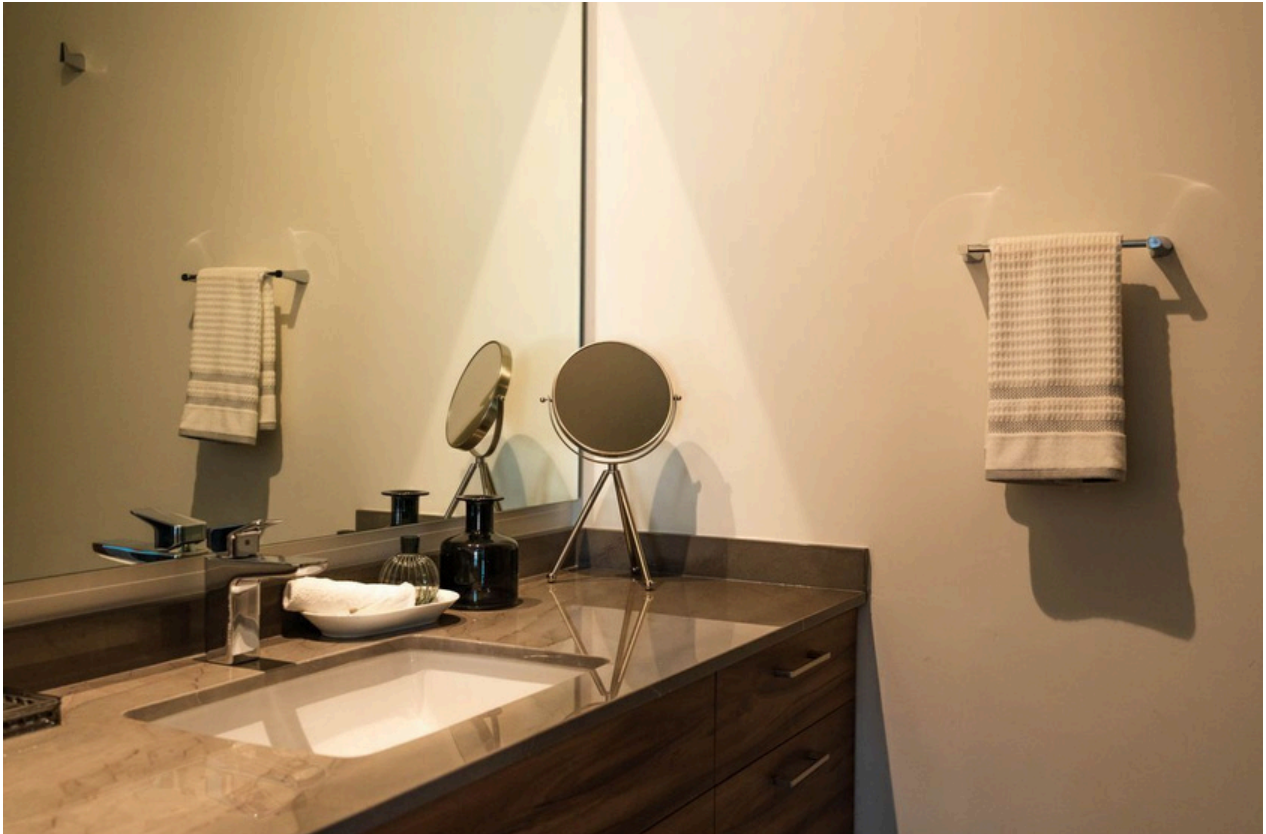
BAÑO COMPLETO RECÁMARA PRINCIPAL