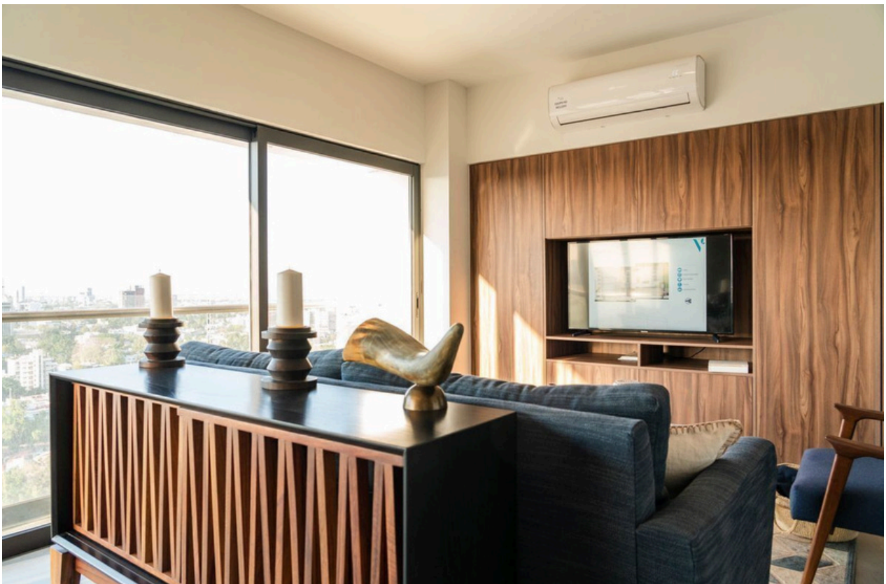
ESTAR DE T.V.