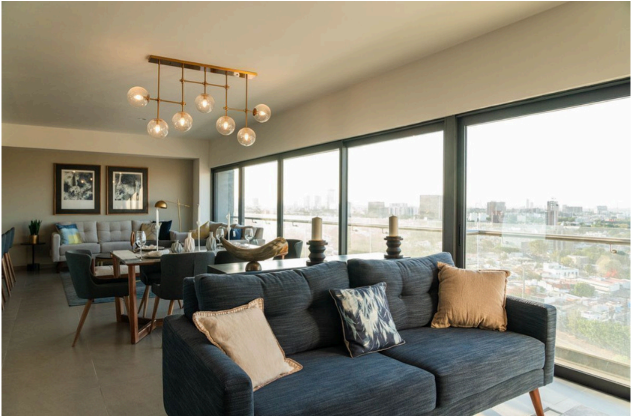
ESTAR DE T.V.