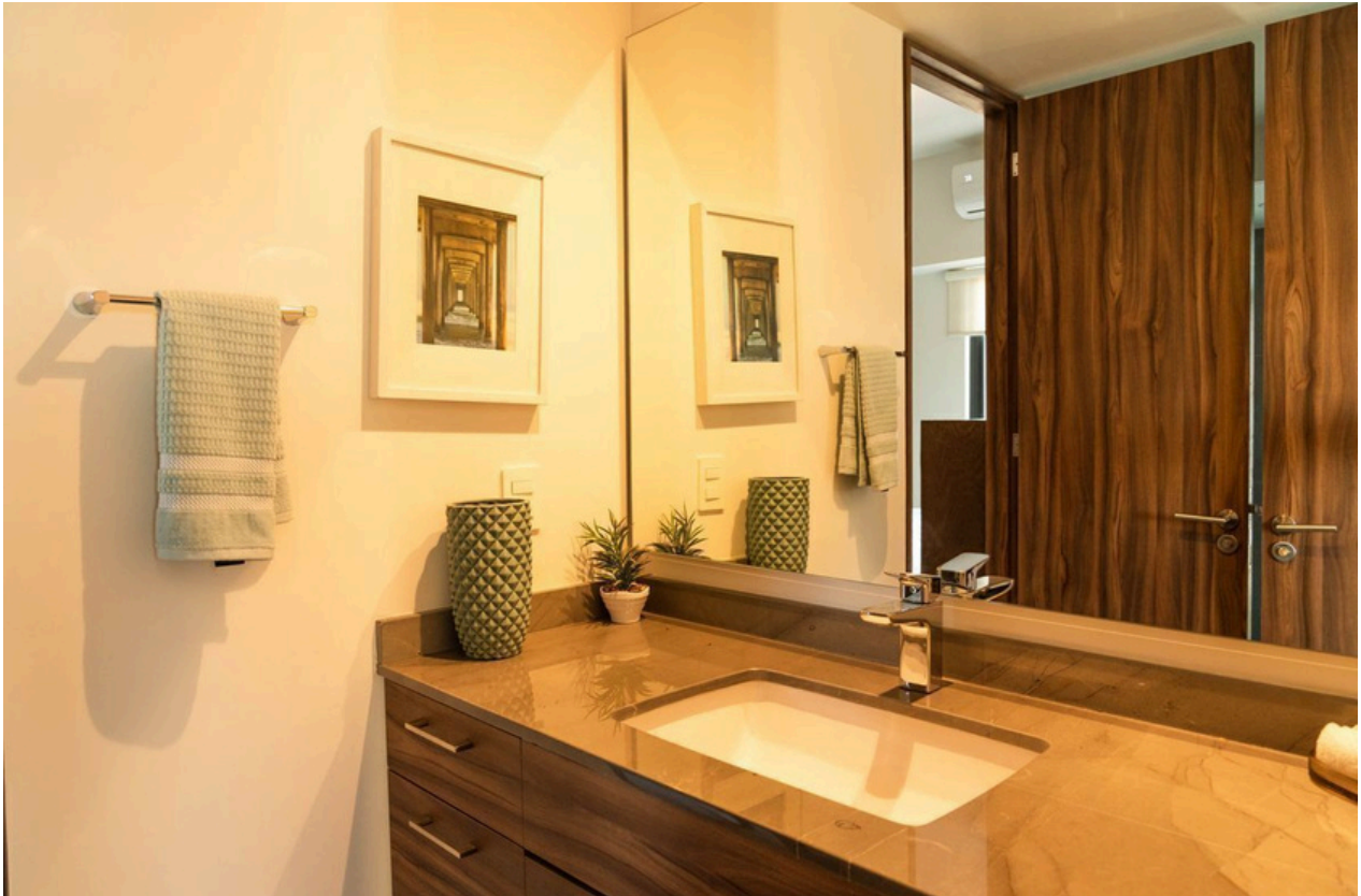
BAÑO RECÁMARA SECUNDARIA