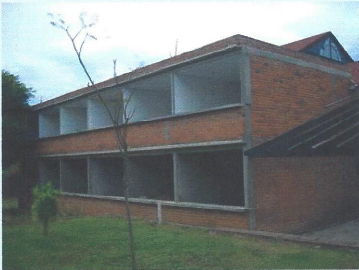
Foto 6. Vista posterior del Edificio Principal.