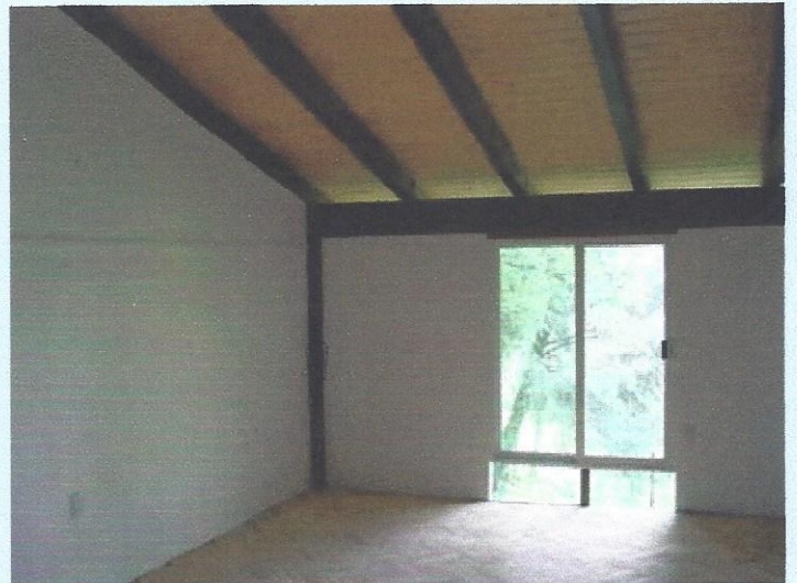
Foto 7. Vista interior de la Casa del Administrador.