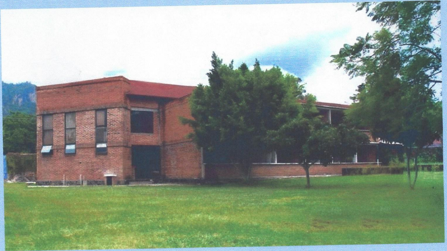
Foto 1. El Edificio Principal durante su construcción. Aloja 24 dormitorios individuales; 12 en planta baja y 12 en planta alta con sus respectivos baños, también en planta alta dos cuartos múltiples para tres personas compartiendo baño en cada uno de ellos