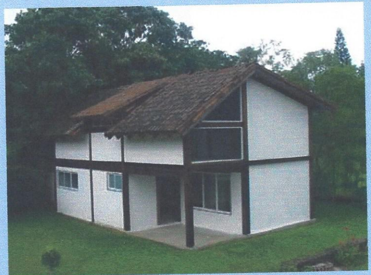
Foto 3. La Casa del Administrador, diseño alemán.