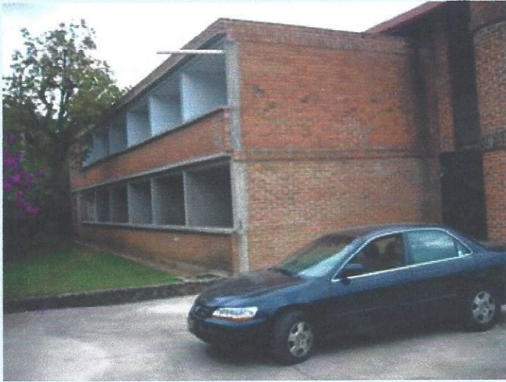
Foto 4. Vista del acceso al Edificio Principal.