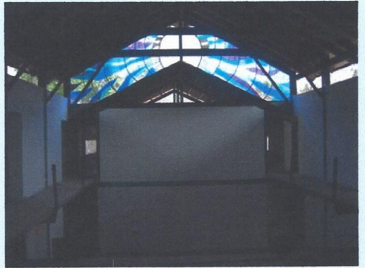
Foto 5. Vista del Vitral ubicado en el interior del Edificio Principal.