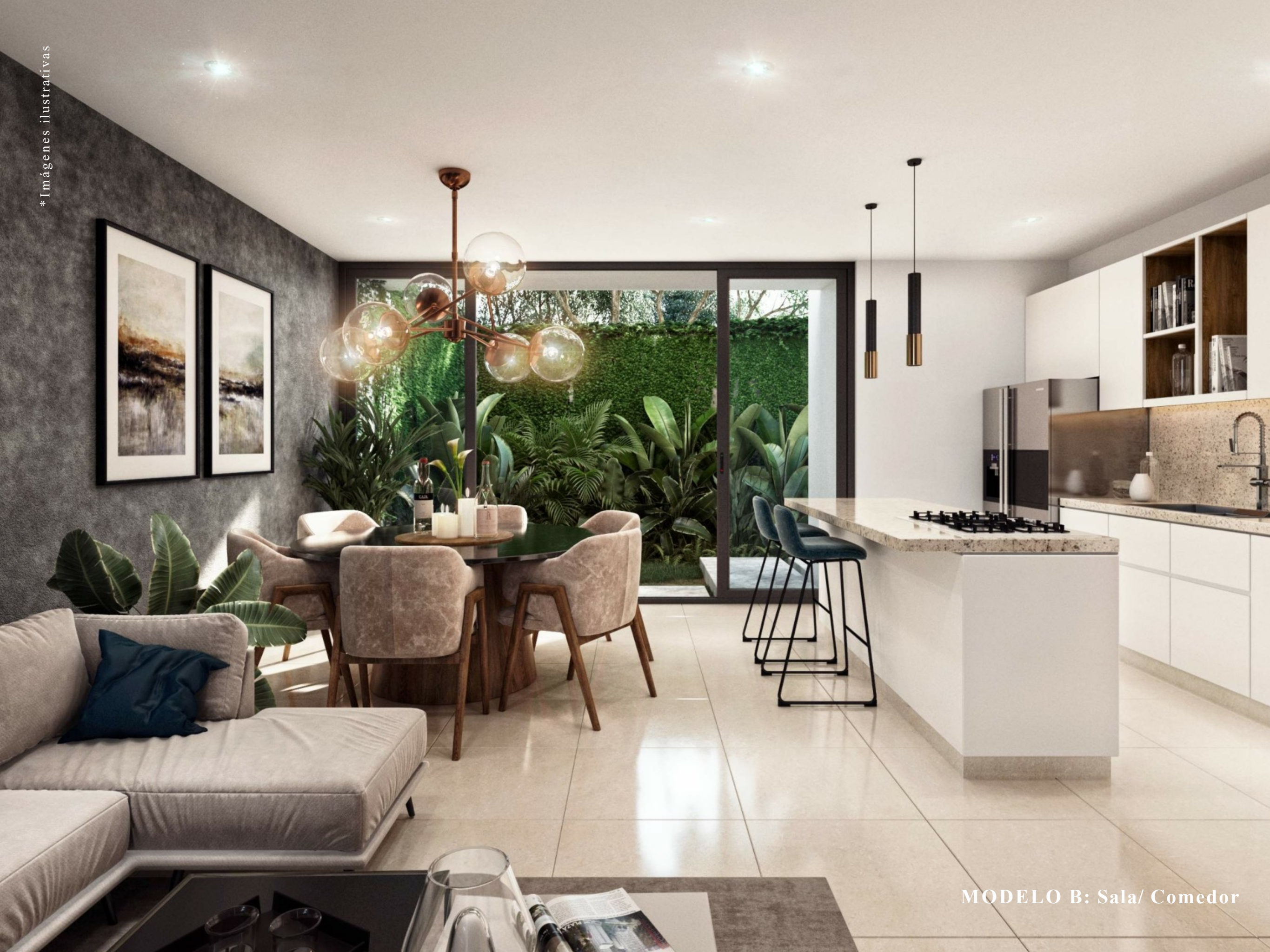
MODELO B: Sala/ Comedor