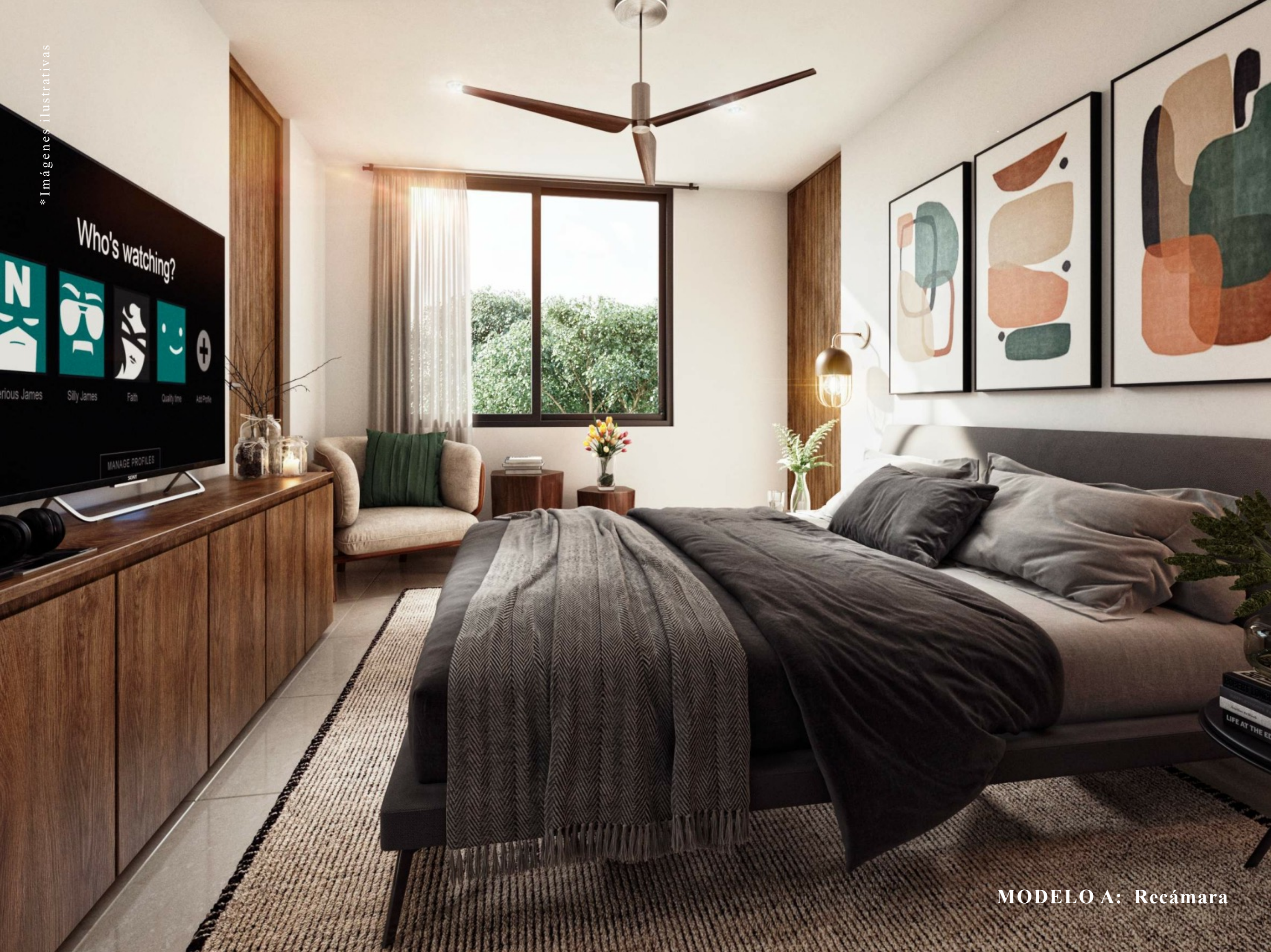
MODELO A: Recámara