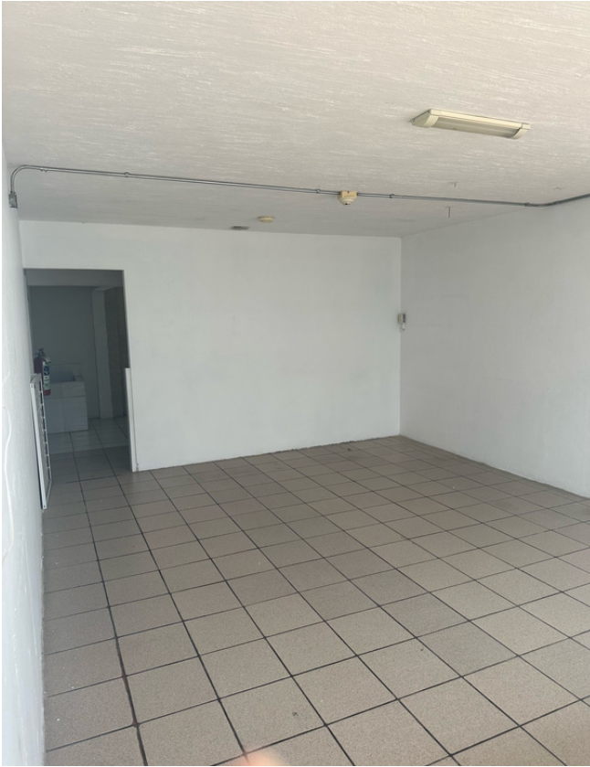
ESPACIO PARA OFICINA