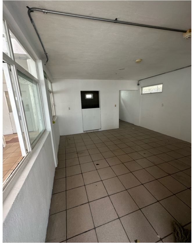
ESPACIO PARA OFICINA