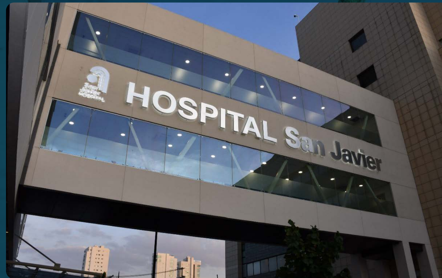
HOSPITAL SAN JAVIER