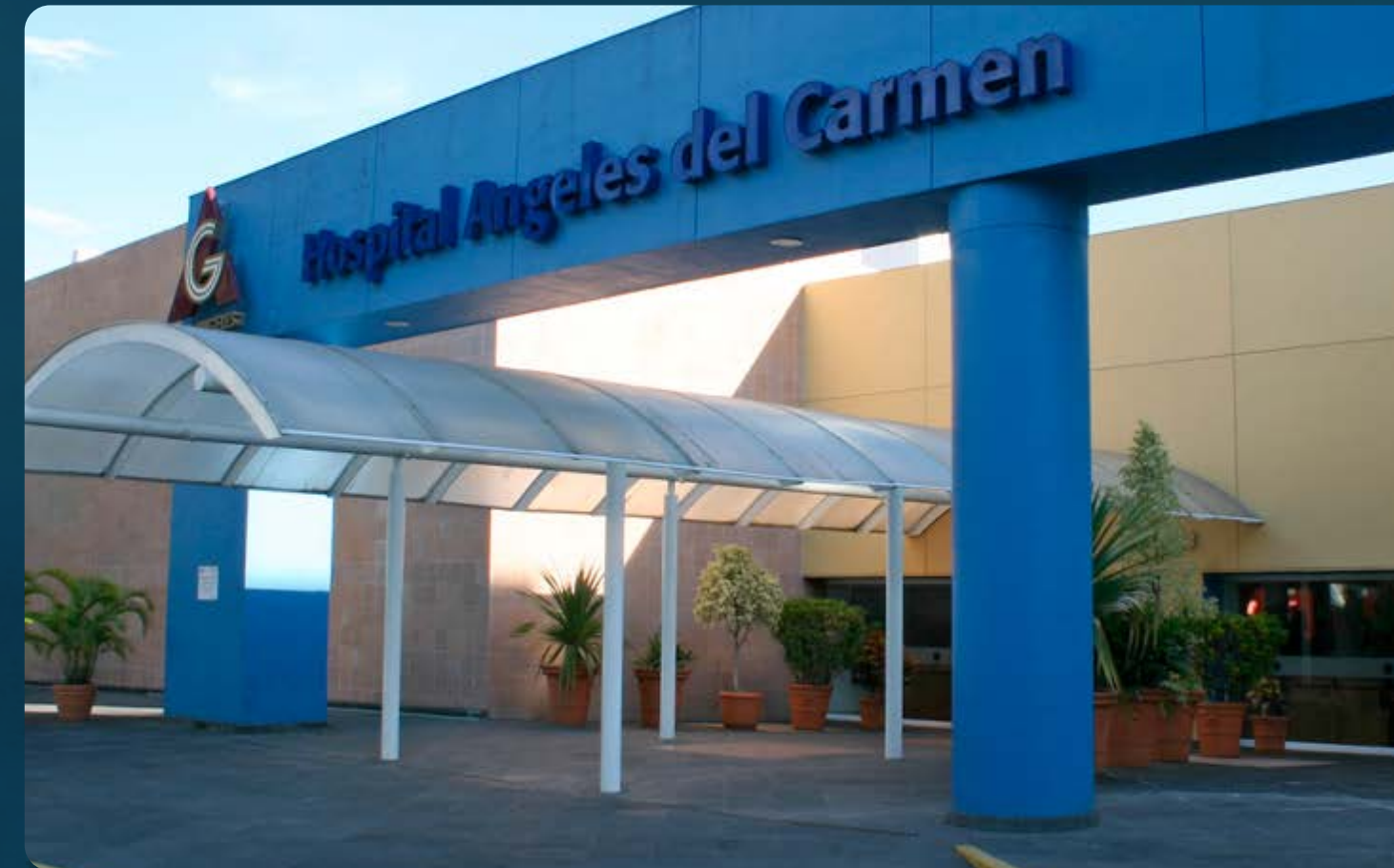
HOSPITAL ÁNGELES DEL CARMEN