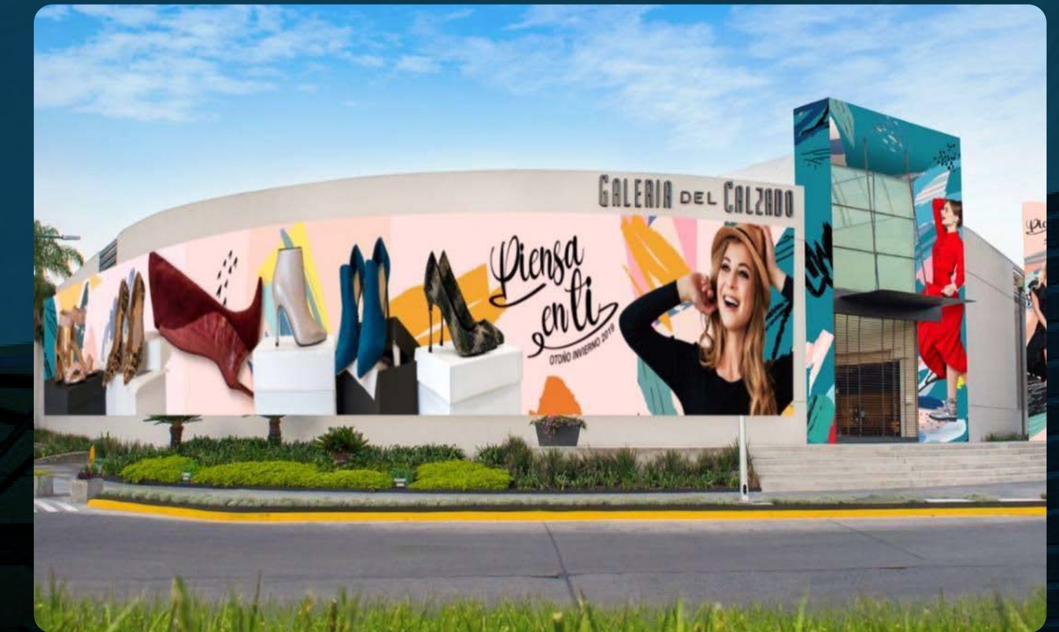
GALERIAS DEL CALZADO