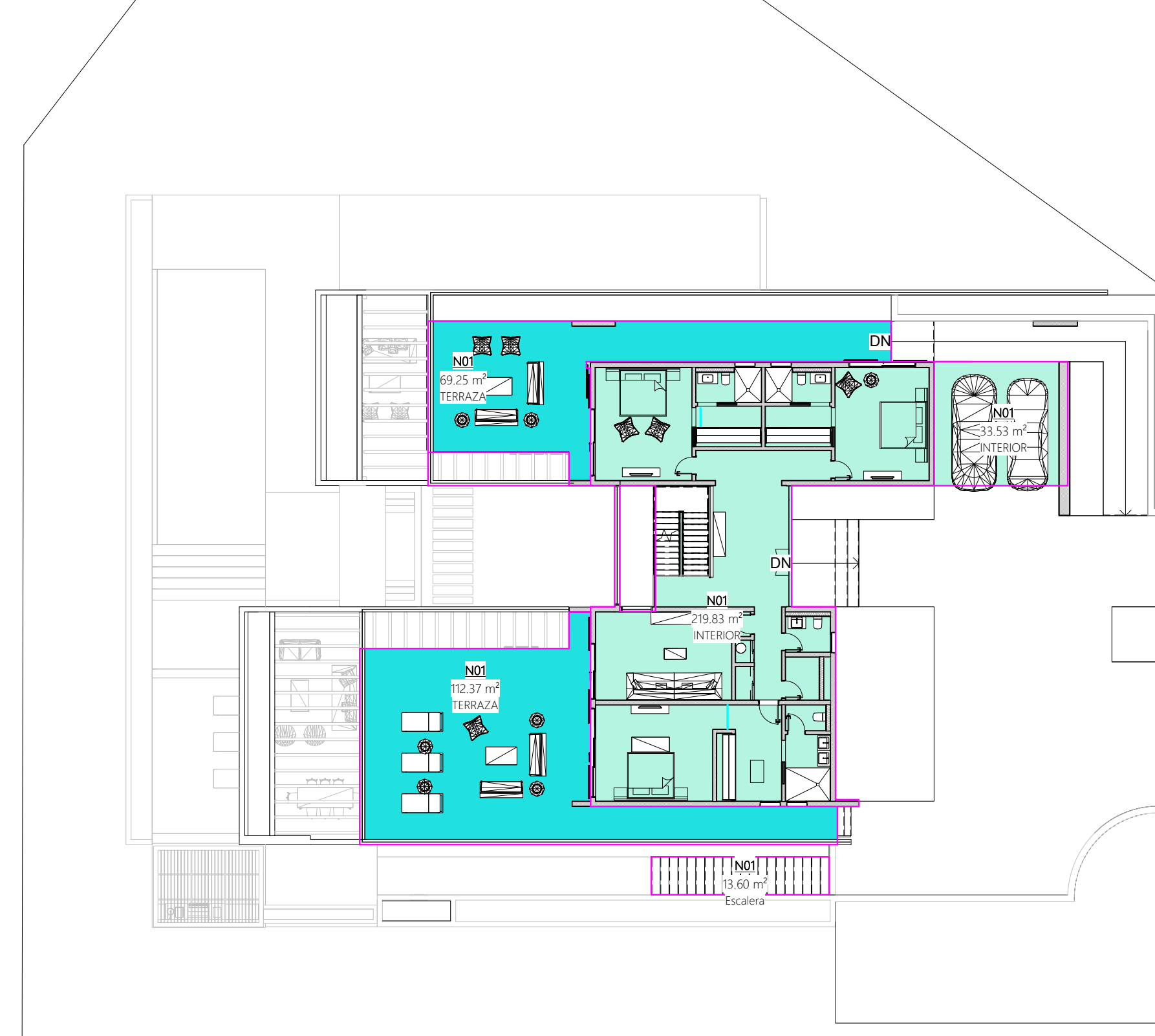
02 1ER NIVEL-AREAS ESC 1:200